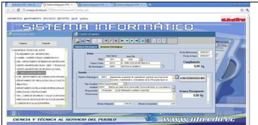
Figura C.2. Plantilla de formulario simple