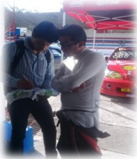
Gráfico 7.1 Encuesta competidores