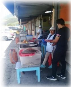
Gráfico 8.4 Encuesta Planta turística