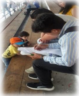
Gráfico 6.1 Encuesta asistentes