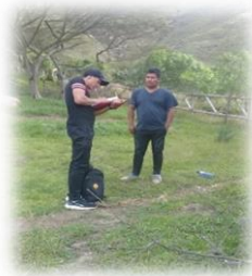
Gráfico 8.4 Encuesta Planta turística