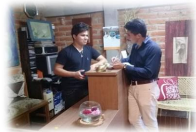
Gráfico 8.1 Encuesta Planta turística