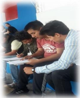
Grafico 6.2 Encuesta asistentes