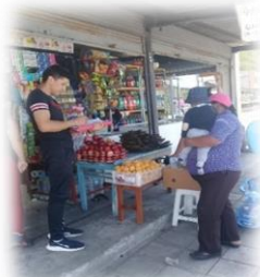
Grafico 8.5 Encuesta Planta turística