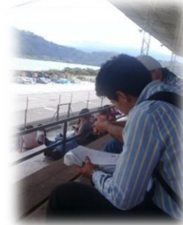
Grafico 6.5 Encuesta asistentes