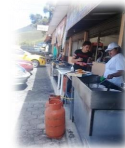
Gráfico 8.6 Encuesta Planta turística