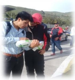
Gráfico 7.4 Encuesta competidores