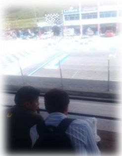
Gráfico 6.4 Encuesta asistentes