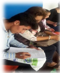
Gráfico 6.3 Encuesta asistentes