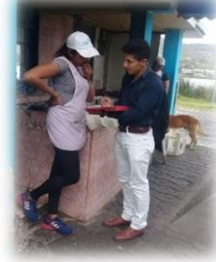
Gráfico 8.3 Encuesta Planta turística