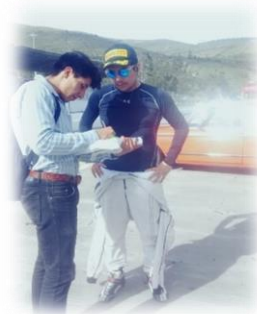
Grafico 7.2 Encuesta competidores