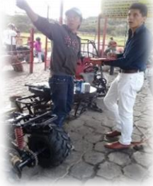
Grafico 8.2 Encuesta Planta turística