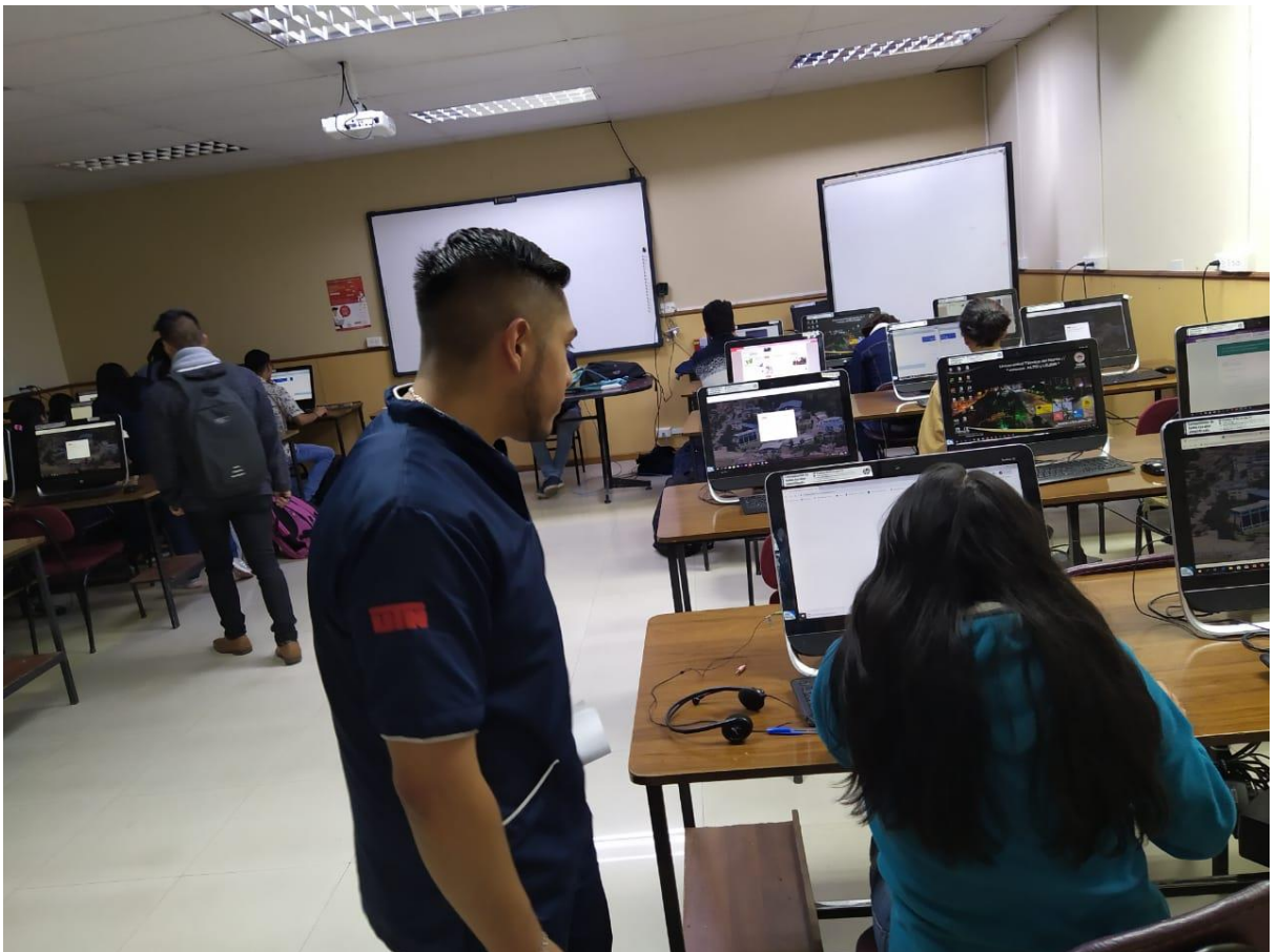
Ilustración 2 (Aplicación Test PAI)