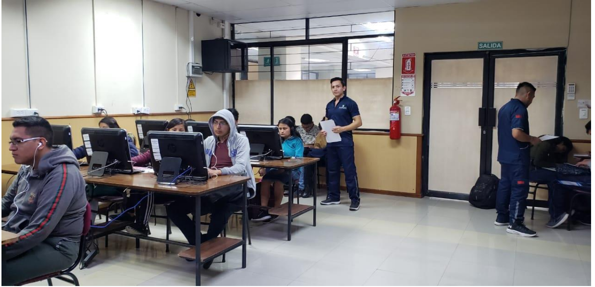
Ilustración 1 Aplicación Test Ansiedad y Depresión