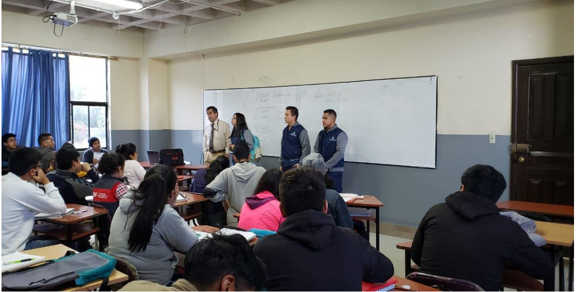
Ilustración 3 (Presentación)