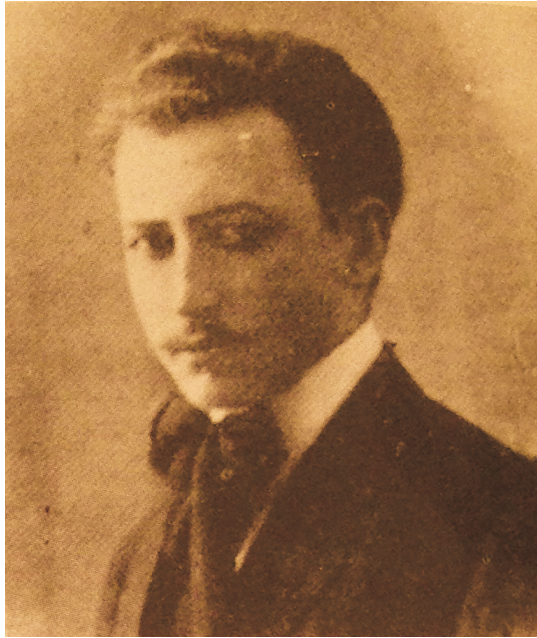
Fig. 3. Pere Maspons Camarasa, importante figura de la comunidad catalana en Ecuador, la primera mitad del siglo XX. (Diccionari...)

café y creó la Compañía de Intercambio y Crédito. Por iniciativa suya se constituyó la Fábrica de Cementos Cerro Azul, los productos de la cual, Cementina y Albalux, eran conocidos en todo el país. También colaboró en diversas publicaciones firmando con el seudónimo de “ Bachiller Hispano ”, escribió versos y poesías entre ellas un Himno a Guayaquil , entonado por el maestro Angelo Negri que es cantado en las escuelas de la ciudad. Cuando se retiró volvió a Cataluña y gestionó que una calle de la ciudad de Granollers, donde vivía, se llamara Guayaquil en recuerdo de la ciudad ecuatoriana. [fig. 3]