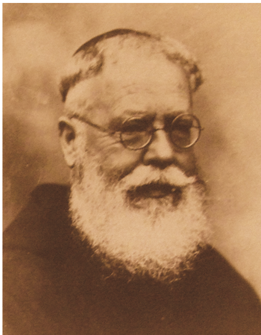
Fig. 1. El misionero capuchino Fidel de Montclar.

Alfons María d'Àger (Àguer 1865-Mataró 1937) nombre de religión del misionero Pere Sanuy Casanoves, ingresó en el Orden Capuchino en el convento de