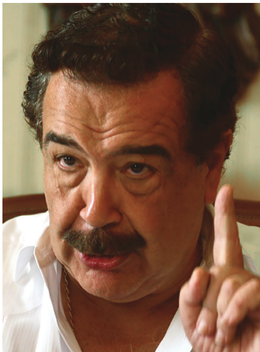
Fig. 7. El político ecuatoriano Jaime Nebot Saadi, nieto de catalán, fue candidato a la presidencia de Ecuador y es Alcalde socialcristiano de Guayaquil desde el año 2000.

nia y se trasladó a Ecuador en 1872, donde continuó los negocios de sus hermanos Joan y Pere. Solucionó las deudas contraídas y obtuvo la primera zafra. Dirigió la construcción de barcos mercantes para carga y pasajeros como medio de comunicación con Guayaquil. Enriquecido con estos negocios ayudó a su joven primo Jaume Roldós Baleta y destacó por su empuje como industrial.