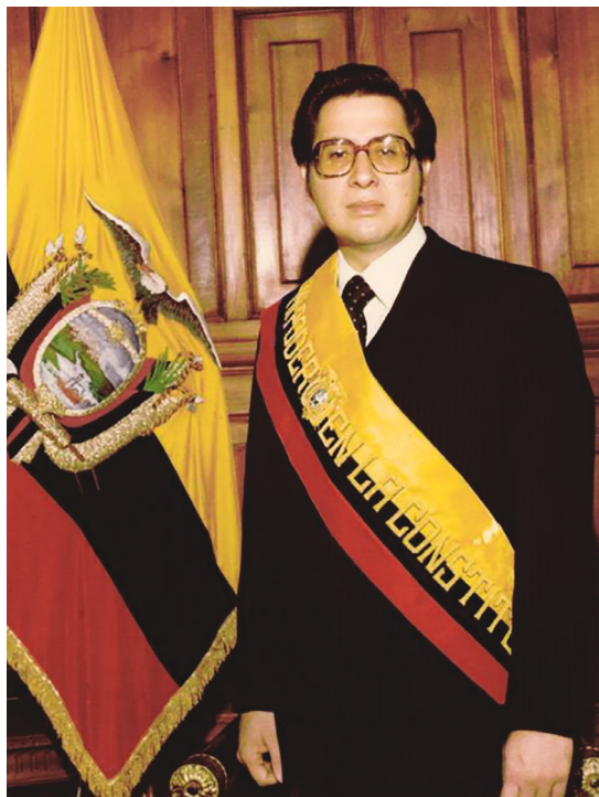
Fig. 6. El político ecuatoriano Jaime Roldós Aguilera, nieto de catalán, fue presidente de la República de Ecuador de 1979 a 1981, cuando murió presuntamente asesinado por la CIA.