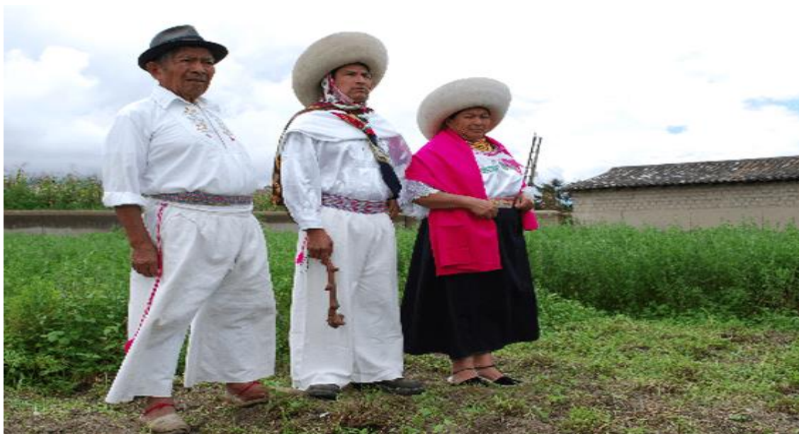
Ilustración 1 Patrimonio tangible. Vestimenta tradicional de hombre y mujer para ocasión casual y festiva del pueblo indígena Natabuela. Confederación de Nacionalidades Indígenas del Ecuador. Pueblo Natabuela.