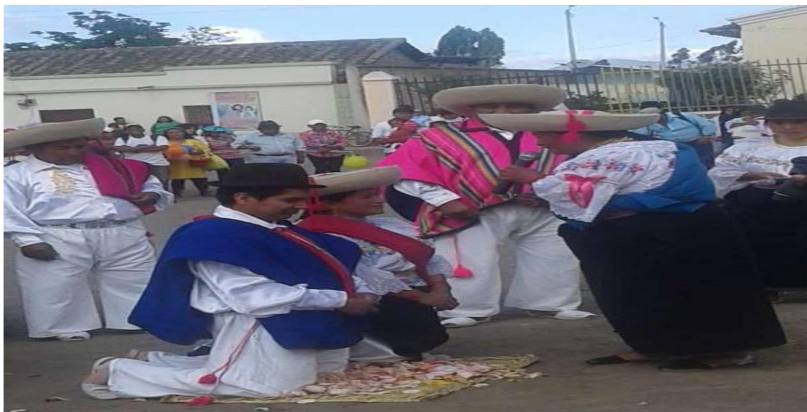
Ilustración 2 Patrimonio intangible del pueblo indígena Natabuela (celebración de bodas). Ministerio de Educación. Cartilla Natabuela