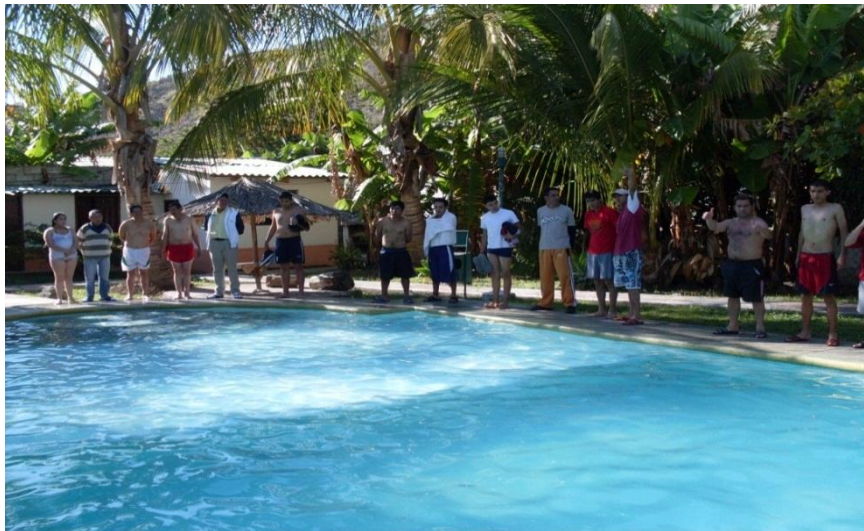
Residentes recibiendo natación en el Centro de rehabilitación SANFEL