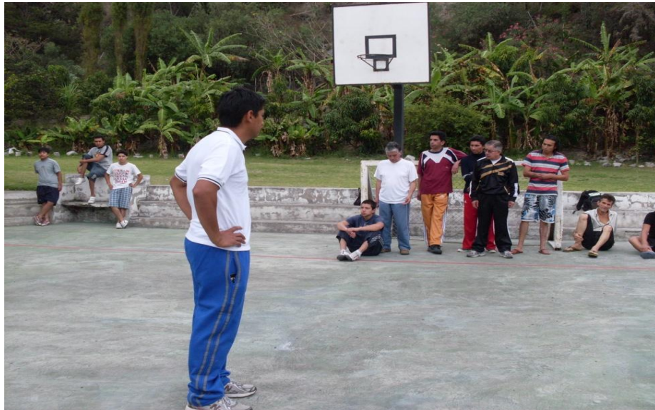
Residentes escuchando las explicaciones del Juego Recreativo que se va a realizar en el Centro de rehabilitación SANFEL