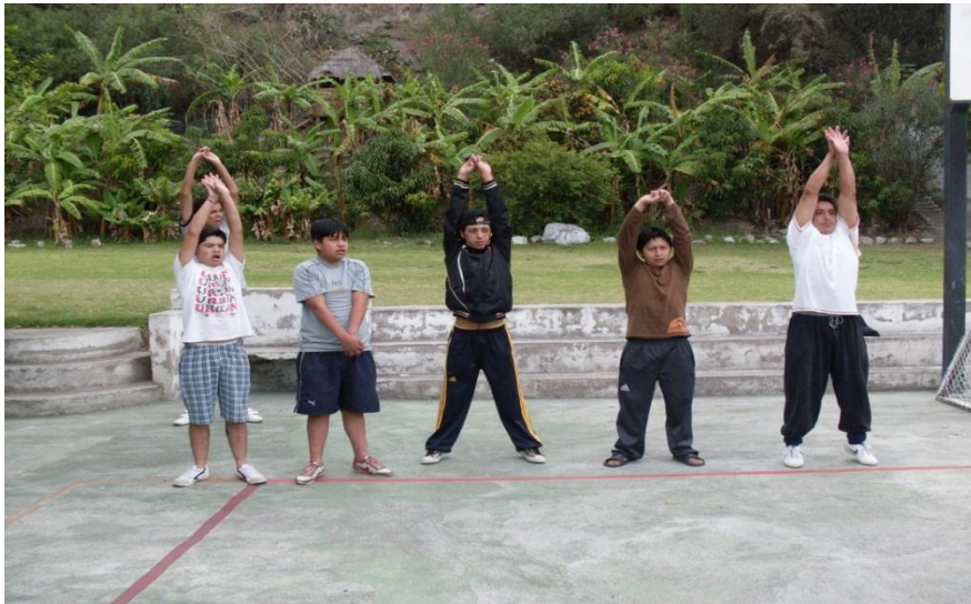
Sesion de estiramiento y finalizacion las actividades Fisicas