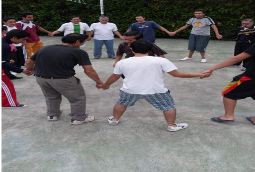
Más juegos Recreativos en el Centro de rehabilitación SANFEL