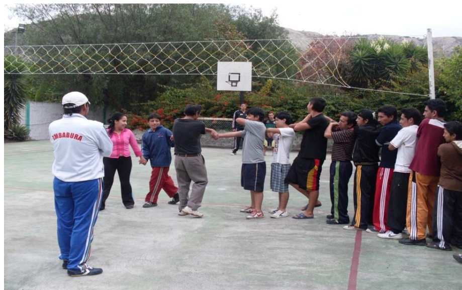
Residentes ejecutando los juegos Recreativos en el Centro de rehabilitación SANFEL