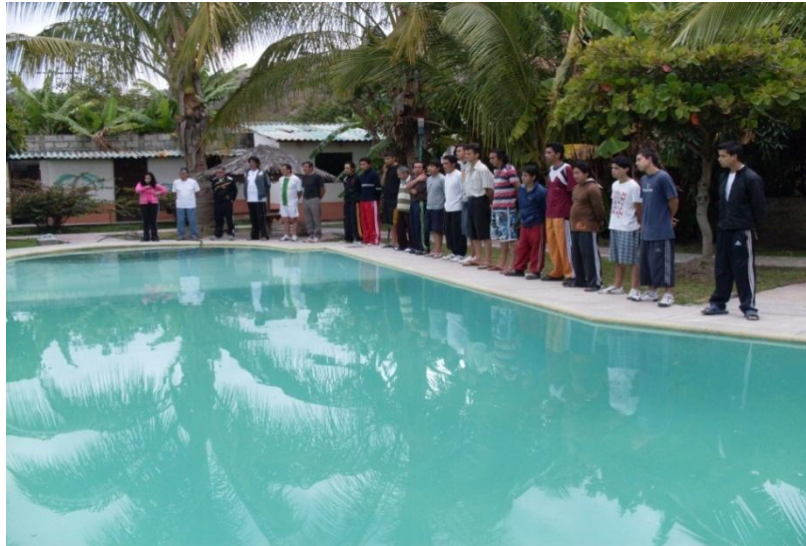
Piscina del centro de rehabilitación SANFEL