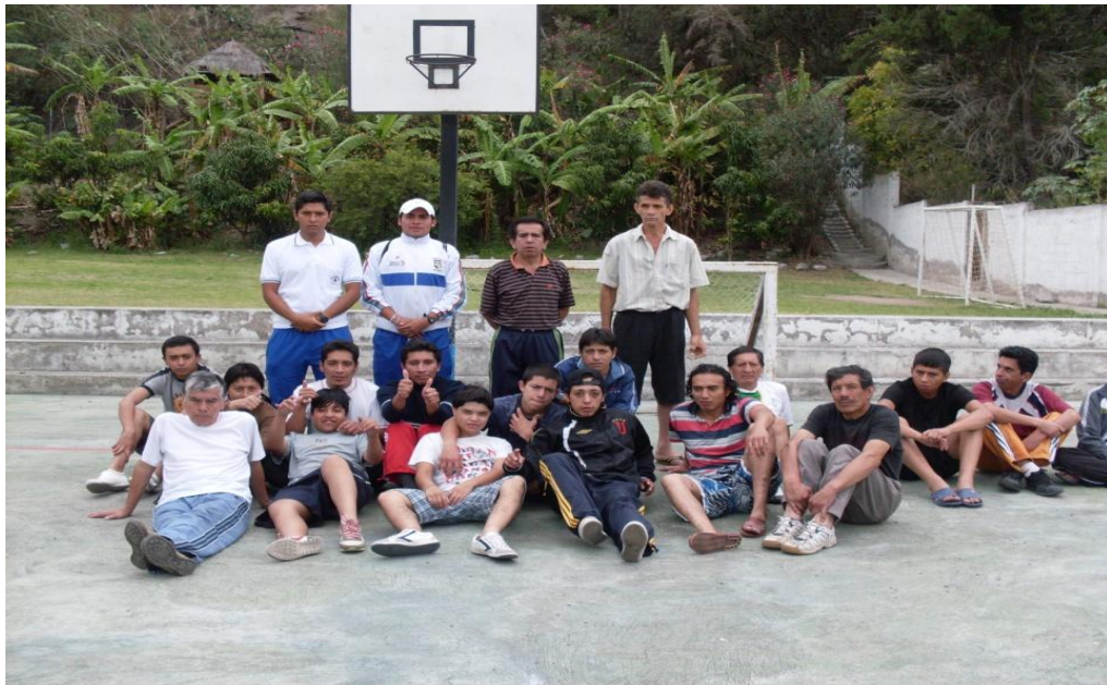
Residentes Centro de rehabilitación SANFEL