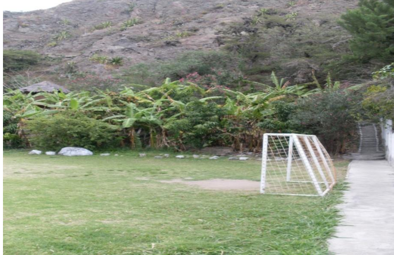
Cancha de Fútbol del centro de rehabilitación SANFEL Fotografía tomada por el grupo de Tesis: Sr. Guerreño Luis y Sr. Tejada Lenin