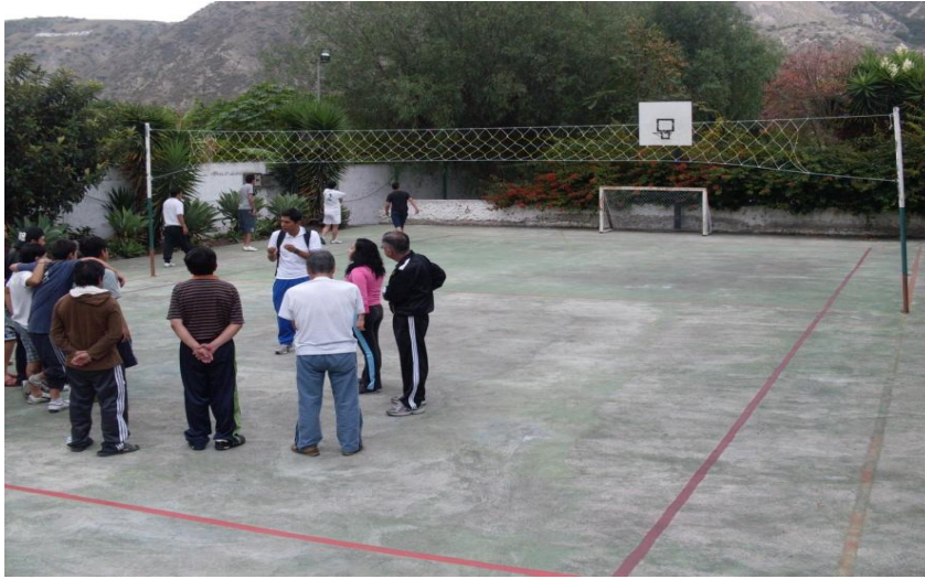
Cancha Múltiple: Baloncesto, Ecuavoley, Indor Futbol del centro de rehabilitación SANFEL