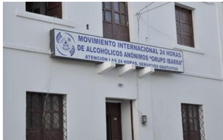
Ubicación: Ibarra Calle Eusebio Borrero 9-46