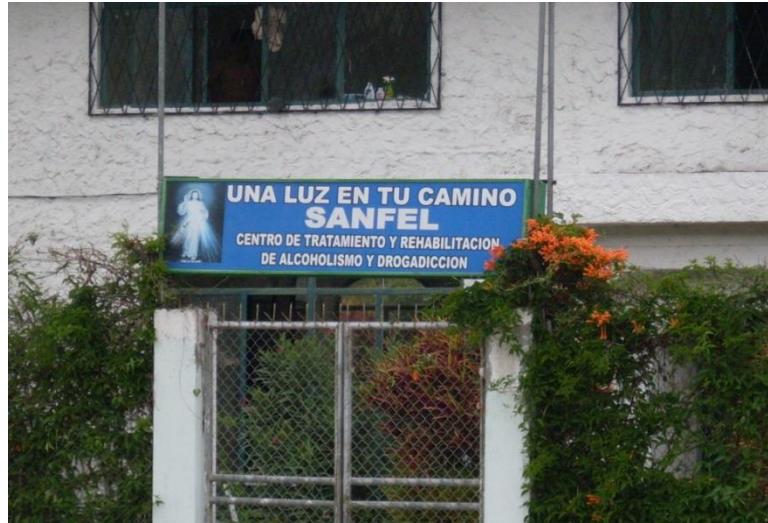
Ubicación: Panamericana Norte Ambuqui junto al Peaje del mismo nombre