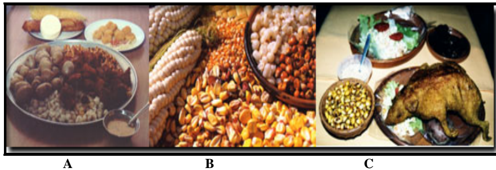
Fotografía 4.3 A: Fritadas B: Productos Agrícolas C: Cuyes

Parte importante de la cultura de Antonio Ante es la gastronomía: la exquisita y tradicional “fritada de Atuntaqui”, (Fotografía A) los sabrosos y crujientes “cuyes de Chaltura” platos que acompañados de mote, tostado, choclo, papas, deleitan los paladares más exigentes y dan a conocer a su vez el potencial agropecuario del cantón, como es la producción del maíz y sus heterogéneos productos resultado de una cosecha en un estado diferente. (Fotografía B) No en vano, González Suárez aseveró la traducción de la palabra “Atuntaqui” como “Granero Grande”