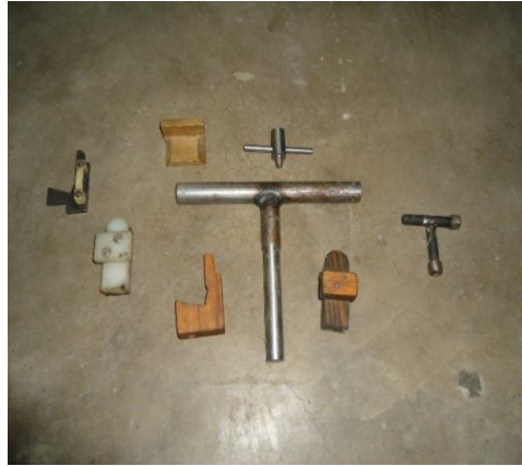
Anexo 1: Diferentes calibres de la máquina.