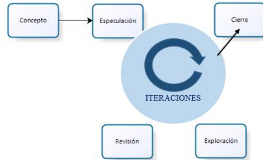
Figura 2: Manejo Scrum

El equipo tendrá una reunión al final para evaluar el desarrollo de las fases del proyecto, en las que se sugieren cambios o se mantienen la misma forma de trabajo.