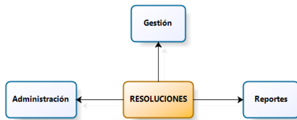
Figure 1: Modules of the application

The Web application is conformed of the following modules as it shows in the figure: