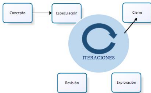
Figure 2: I Handle Scrum

The team will have a meeting at the end to evaluate the development of the phases of the project, in which they suggest changes or keep the same form of work.