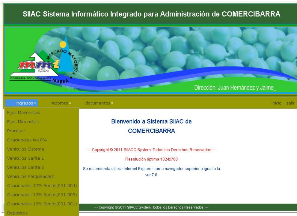
Figura. 7.2 Interface Definitivo de un Usuarios de la Aplicación Web

Todas las correcciones expuestas y mejoramiento de interfaces, contenidos, enlaces, etc. Se presenta los diseños definitivos... para más detalle revisar el anexo adjunto.