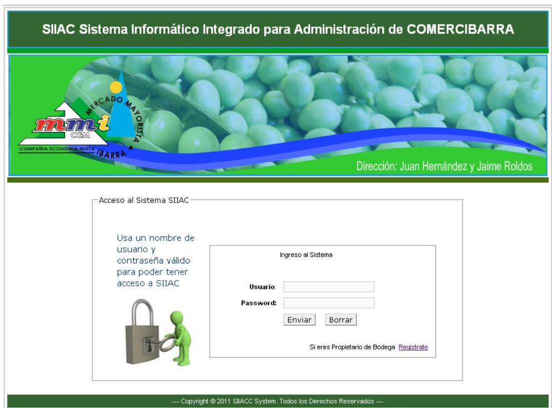
Figura. 7.1 Interface Definitivo de Ingreso a la Aplicación Web

La interface para todas las presentaciones de los usuarios será con la misma estética y diseño tanto en la cabecera, el menú, cuerpo y pie de página, etc.