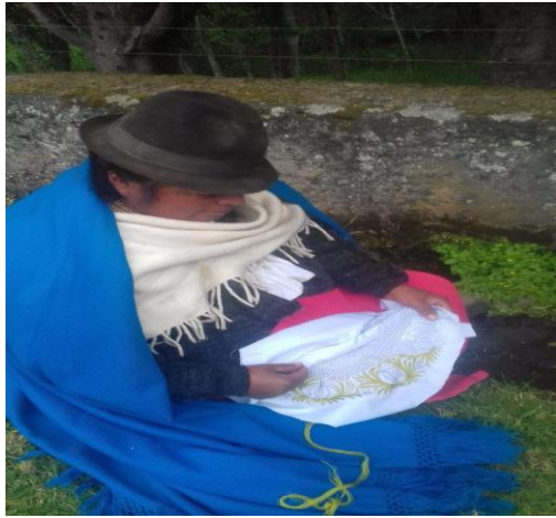
Imagen 4. Bordado en proceso de elaboración