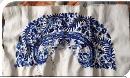
7.-Finalización del bordado