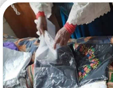
12.- Empacado de las blusas

Serian 12 pasos o actividades que las mujeres realizan hasta conseguir un producto terminado; como se puede apreciar el bordado es un espacio originado al interior del hogar, con herramientas y equipos muy comunes en la familia, como la plancha, mesa, accesorios de costura y de diseño; y como ya se vio anteriormente, el