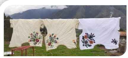
10.-Secado del bordado