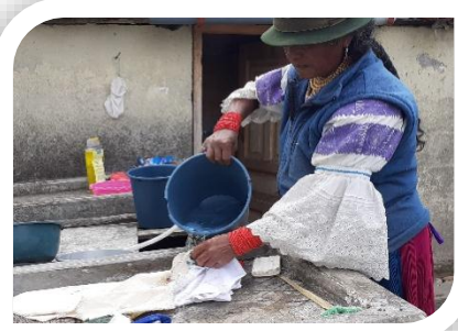
9.-Lavado del bordado