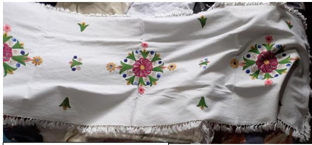
CENTROS DE MESA