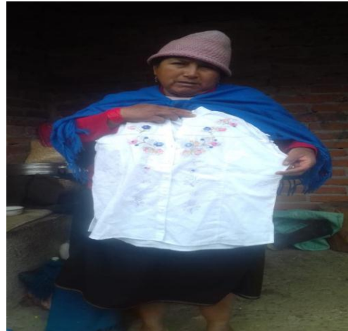
Imagen 5. Blusa con el plasmado de Bordado