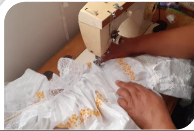
8.- Unión de la blusa a maquina