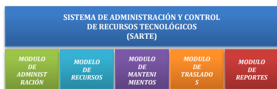
Figura 6.1. Esquema general del sistema (SARTE).

Después de haber realizado un estudio de los procesos involucrados en la administración y control de los recursos tecnológicos de la Cooperativa de Ahorro y Crédito Atuntaqui Ltda., se ha visto conveniente clasificarlos, en cinco módulos principales. Mismo que fueron optimizados para una mejor administración de tecnología.