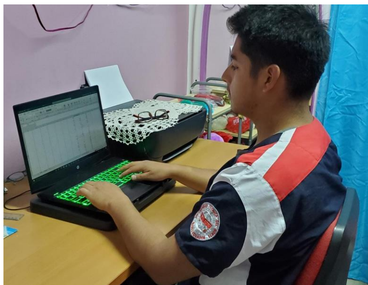
Tabulación de datos