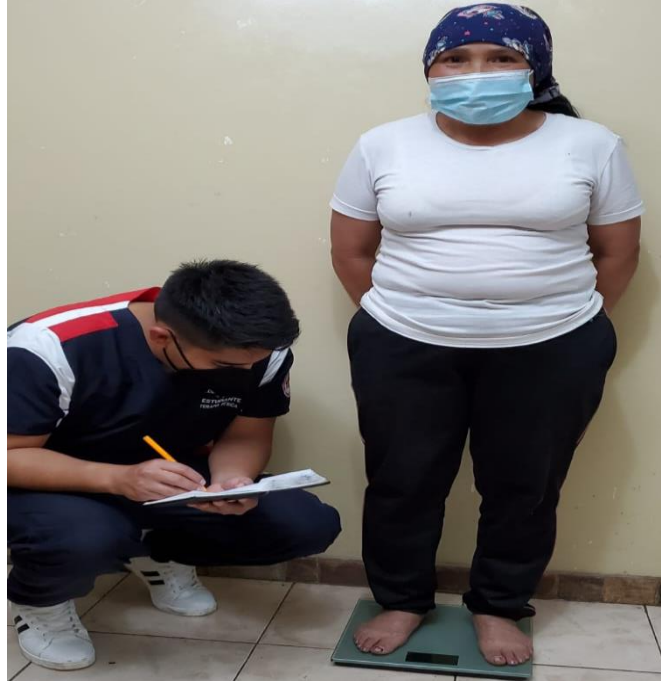
Toma de medidas antropométricas: peso