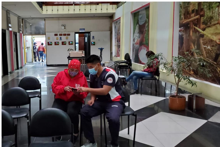
Llenado de cuestionario internacional de actividad física