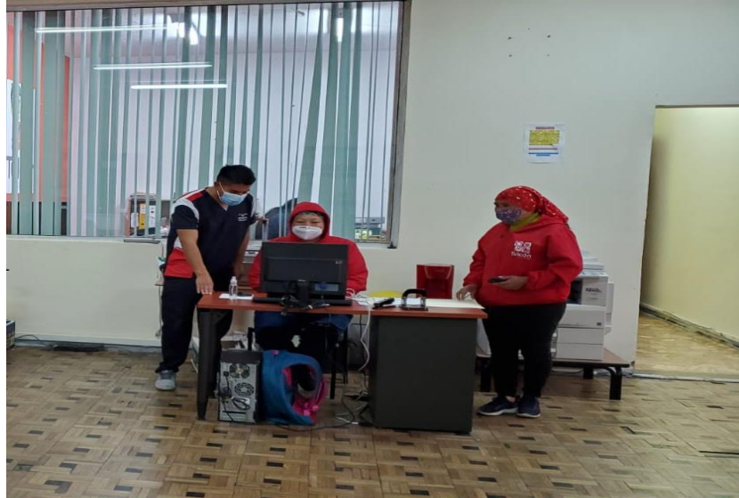
Llenado de cuestionario internacional de actividad física