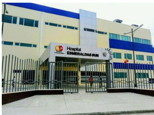
Gráfico 1. Hospital Esmeraldas Sur Delfina Torres de Concha