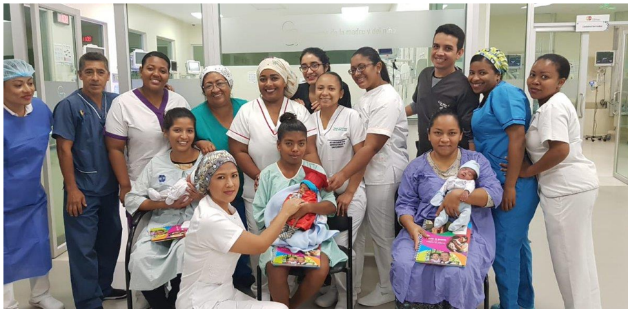
Gráfico 2. Personal de salud área de Neonatología

dos de ellos con especialización en neonatología, 2 médicos generales y un médico residente, el personal de enfermería que consta de 25 enfermeras y 8 auxiliares.