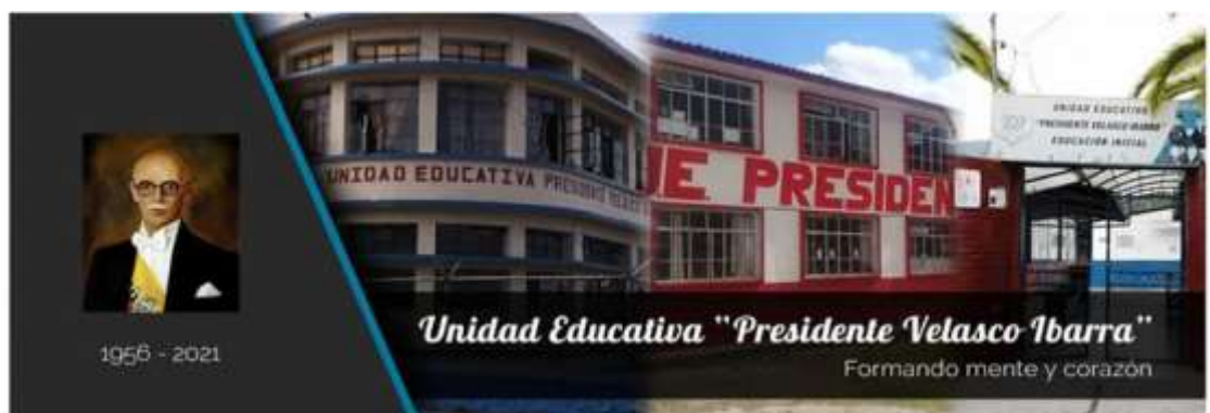
Figura 2. Unidad Educativa “Presidente Velasco Ibarra”