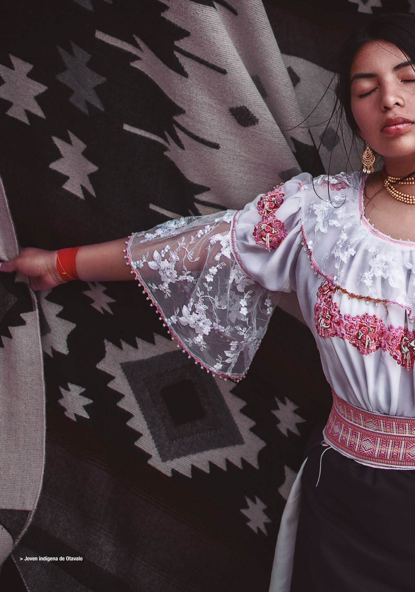
> Joven indígena de Otavalo