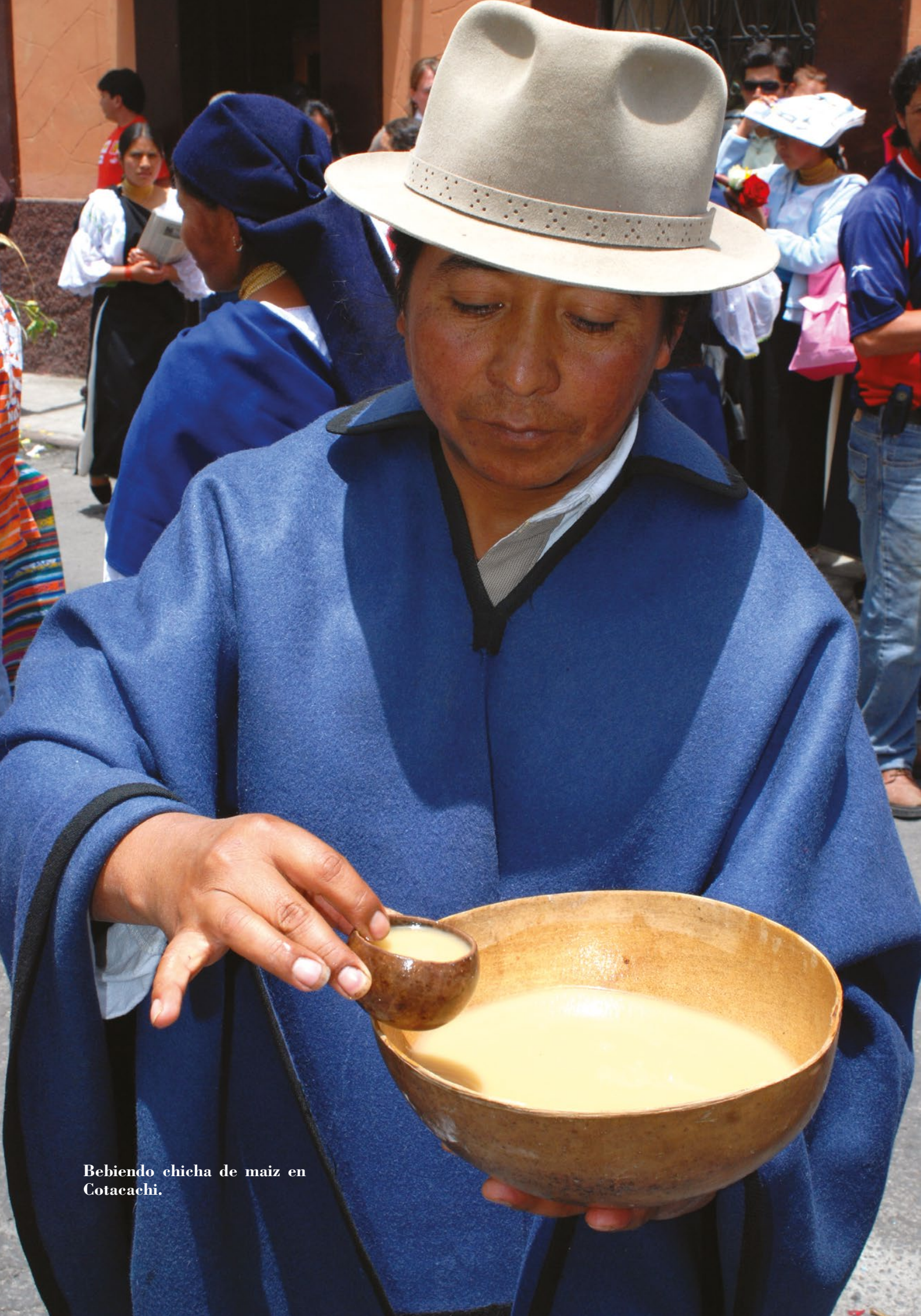
Bebiendo chicha de maiz en Cotacachi.