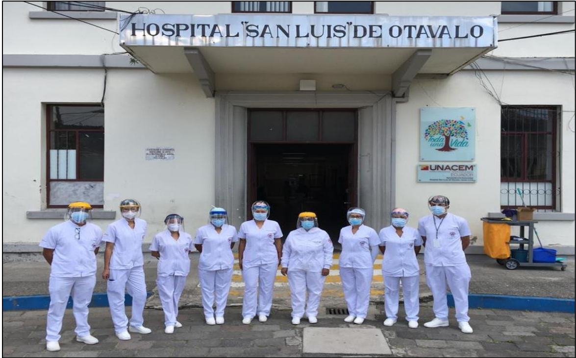
Gráfico 1: Hospital San Luis de Otavalo