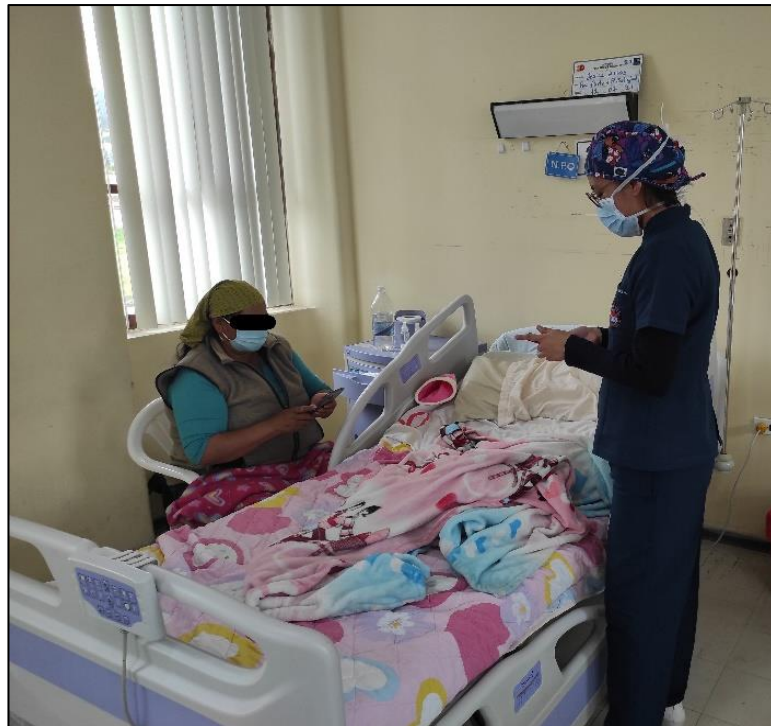
Explicación previa de la encuesta a realizar.