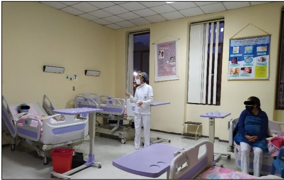
Socialización de la investigación a las pacientes atendidas en el servicio de ginecología del hospital San Luis de Otavalo