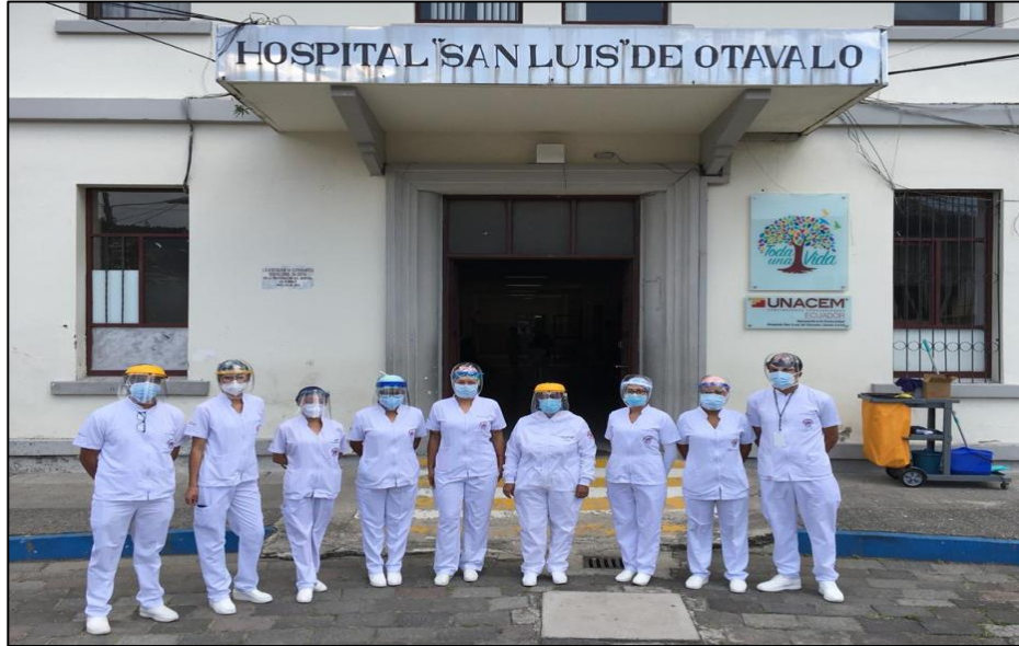
Hospital San Luis de Otavalo