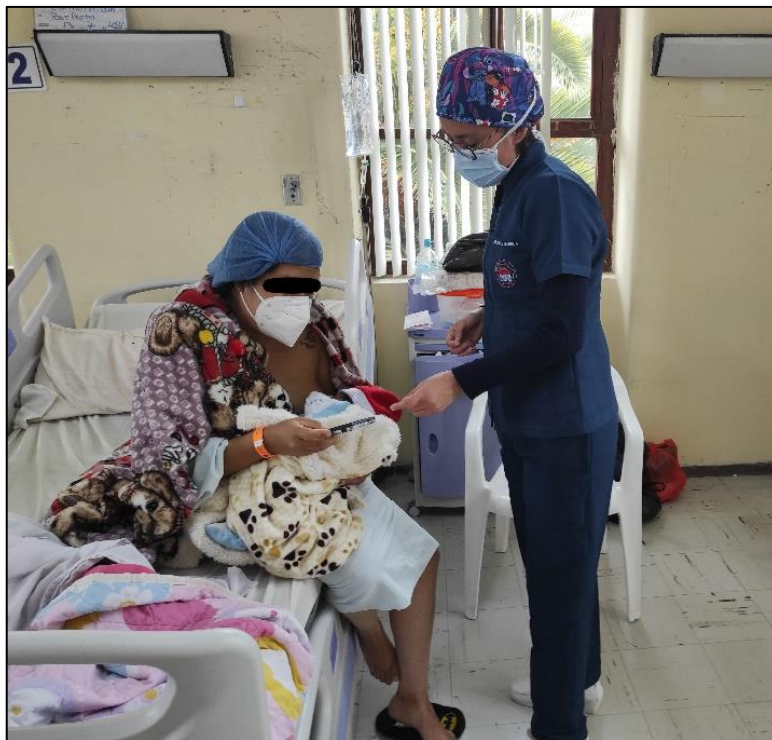
Paciente postparto realizando la encuesta sobre conocimiento de depresión postparto. HSLO