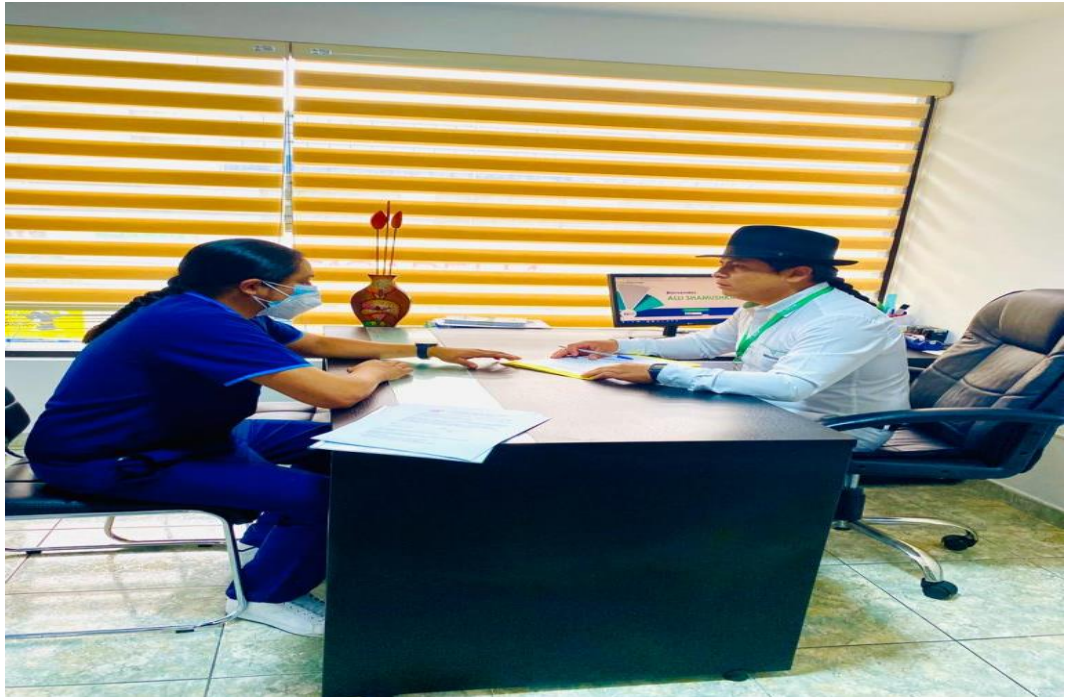
Fotografía 3: Aplicando la Ficha de Recolección de datos a los trabajadores Elaborado por: Luis Byron De La Torre Pillajo