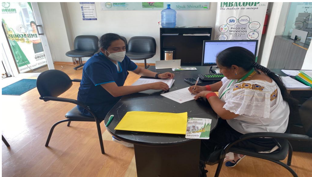
Fotografía 2: Aplicando el Cuestionario de OSWESTRY Elaborado por: Luis Byron De La Torre Pillajo