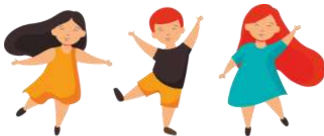
Figura 6 Esquema corporal en movimiento

Objetivo: O.ECA.1.1. Explorar las posibilidades de los movimientos a través de la participación en juegos que integren diversas opciones.