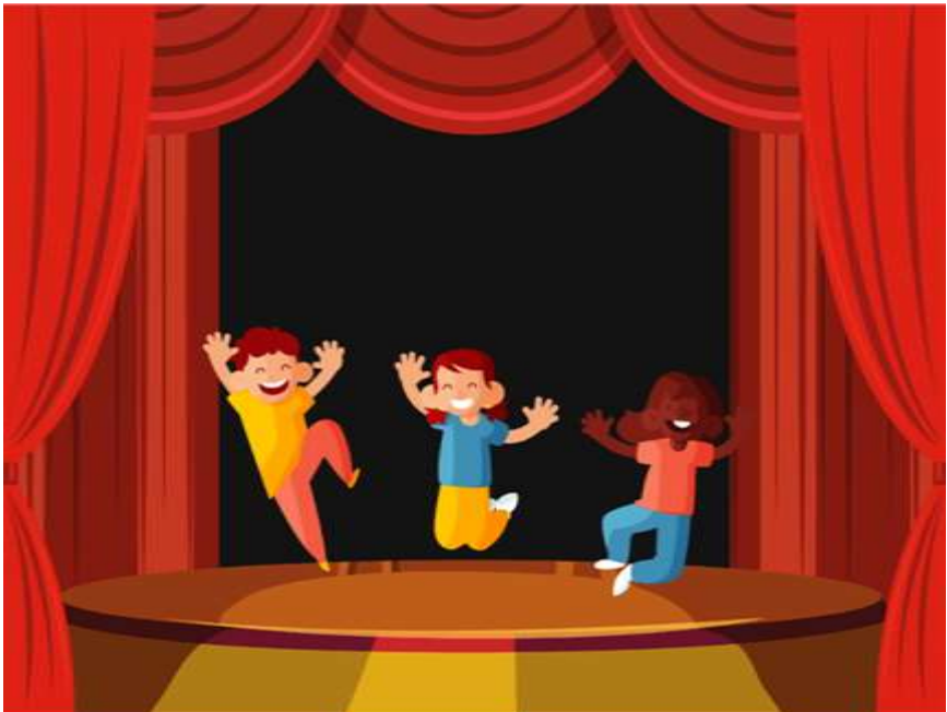
Figura 8 Creación Artística Colectiva

OI.2.12. Demostrar una actitud cooperativa y colaborativa en la participación en trabajos de grupo, de acuerdo a pautas construidas colectivamente y la valoración de las ideas propias y las de los demás.