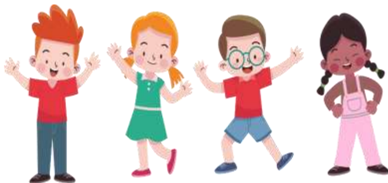
Figura 2 Identidad y Exploración.

Objetivo: OI.2.7. Comunicarse en forma efectiva a través del lenguaje artístico, corporal, oral y escrito, con los códigos adecuados, manteniendo pautas básicas de comunicación y enriqueciendo sus producciones con recursos multimedia.