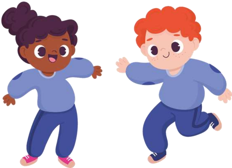
Figura 5 Percepción sensorial por medio del moviendo

Objetivo: O.ECA.4.7. Utilizar las posibilidades del cuerpo, la imagen y el sonido como recursos para expresar ideas y sentimientos, enriqueciendo sus posibilidades de comunicación, con respeto por las distintas formas de expresión y autoconfianza en las producciones propias.