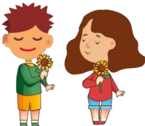
Figura 1 Respiración consciente.

Objetivo: OG.ECA.8. Explorar su mundo interior para ser más consciente de las ideas y emociones que suscitan las distintas producciones culturales y artísticas, y las que pueden expresar en sus propias creaciones, manifestándolas con convicción y conciencia.