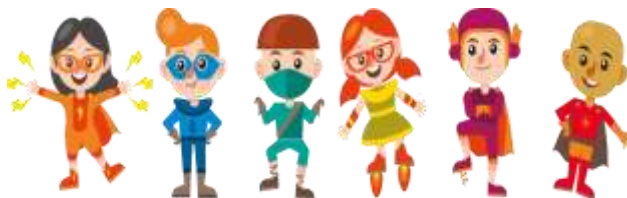
Figura 7 Expresión corporal en base a la creatividad

O.ECA.2.1. Realizar producciones artísticas individuales a partir de la combinación de las técnicas y materiales dados.