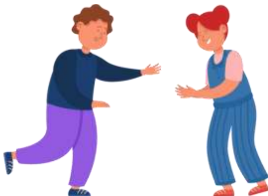
Figura 4 Desplazamiento y Equilibrio

O.ECA.3.7. Participar en procesos de interpretación y creación corporal individual y colectiva, y valorar las aportaciones propias y ajenas.