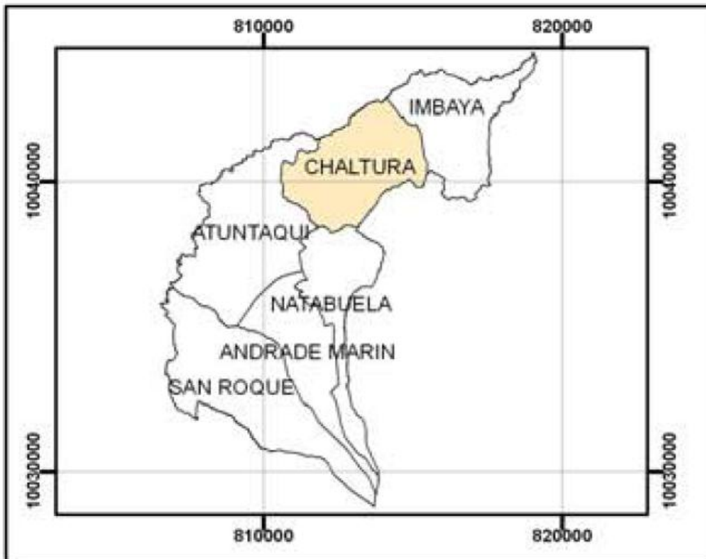
GRÁFICO N° 1 MAPA LIMÌTROFE PARROQUIAL

Fuente: Plan de Ordenamiento Territorial de las Parroquias Urbanas Elaboración: Autores