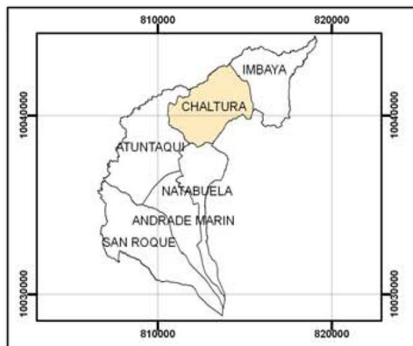
GRAFICO N° 3 MAPA DE LA PARROQUIA DE SAN JOSÉ DE CHALTURA.

Fuente: Plan de desarrollo social de la parroquia de chaltura. Elaboración: Autores.