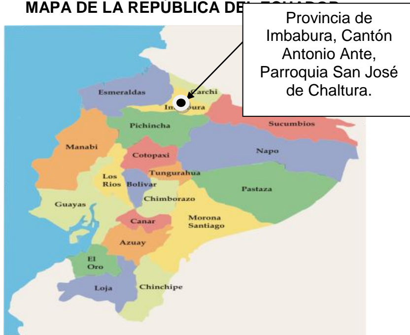
GRAFICO N° 2 MAPA DE LA REPÚBLICA DE