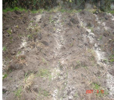
Foto 8. Aplicación de cal después de la siembra, nivel 1.