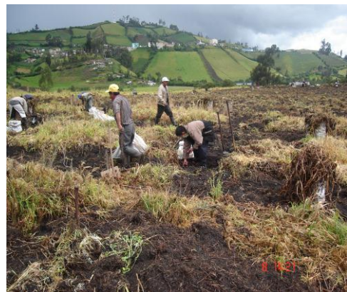
Foto 16. Cosecha.