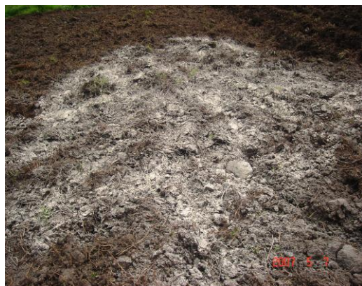
Foto 4. Aplicación de cal antes de la siembra.