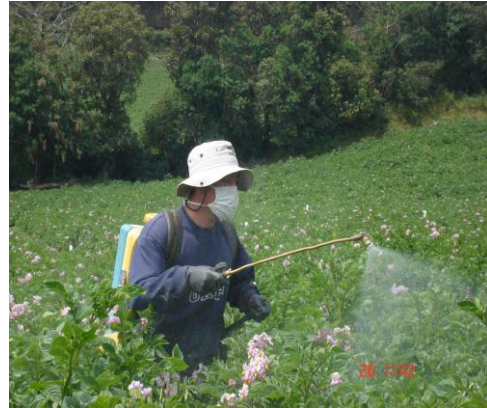
Foto14. Aplicación de fungicidas.