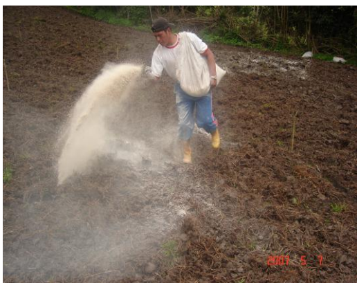
Foto 3. Aplicación de cal antes de la siembra, nivel 3.