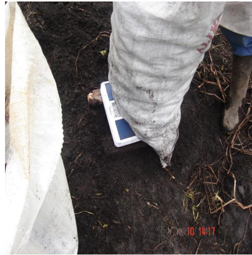
Foto 18. Pesaje por categorías.