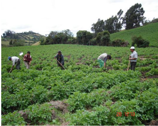
Foto 13. Primer aporque.