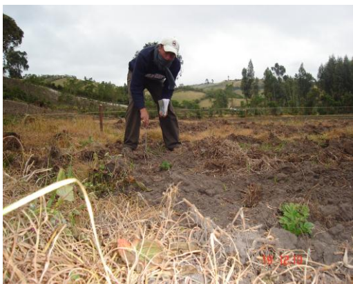
Foto11. Toma de altura de plantas a los 45 días después de la siembra.