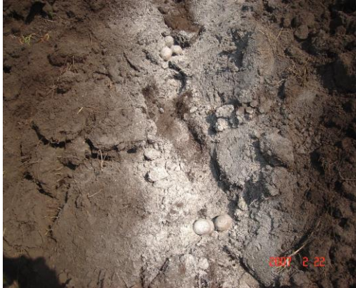
Foto 5. Aplicación de cal a la siembra, nivel 1.