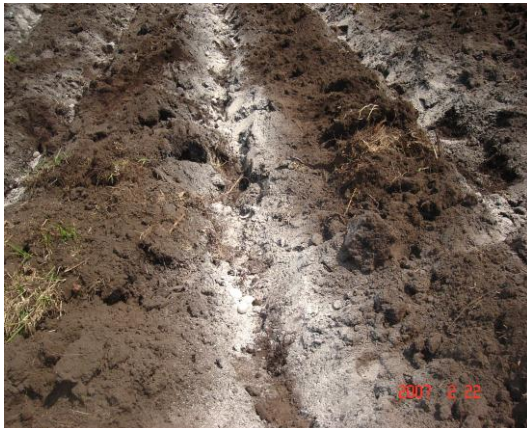
Foto 7. Aplicación de cal a la siembra, nivel 3.