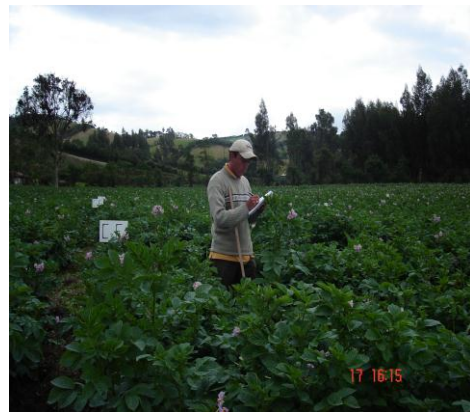
Foto 12. Toma de altura de plantas a la floración.