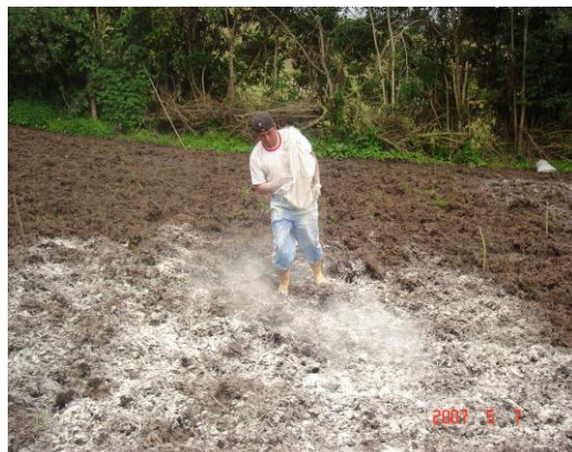
Foto 2. Aplicación de cal antes de la siembra, nivel 2.