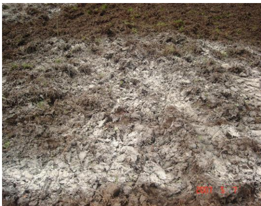
Foto 1. Aplicación de cal antes de la siembra, nivel 1.