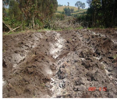
Foto 6. Aplicación de cal a la siembra, nivel 2.