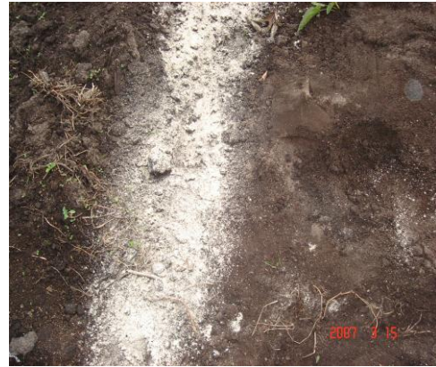
Foto 10. Aplicación de cal después de la siembra, nivel 3.