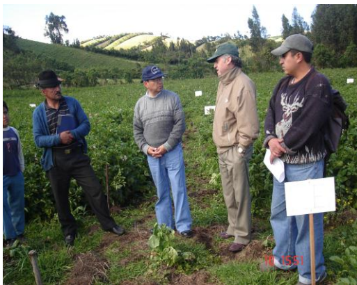
Foto 15. Visita de campo.