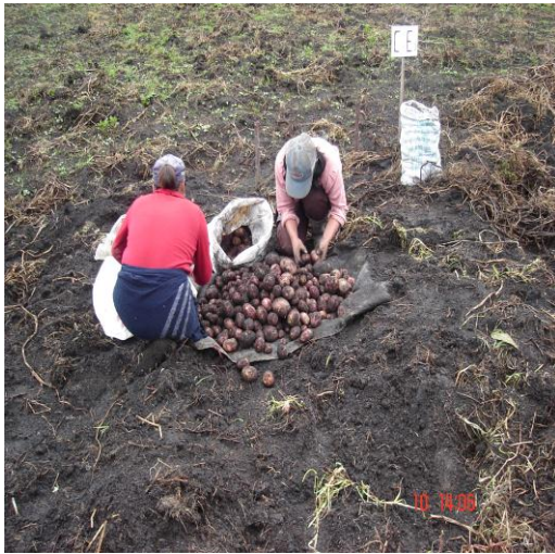
Foto 17. Selección por categorías