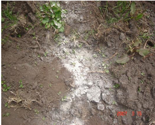
Foto 9. Aplicación de cal después de la siembra, nivel 2.