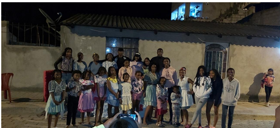
Figura 10. Integrantes de la Academia Renacer Afro 10

Pregunta 1: ¿Cuáles son los componentes que se observa para identificar la destreza, habilidad y espacio que utilizan los grupos de danza en la comunidad de Mascarilla?