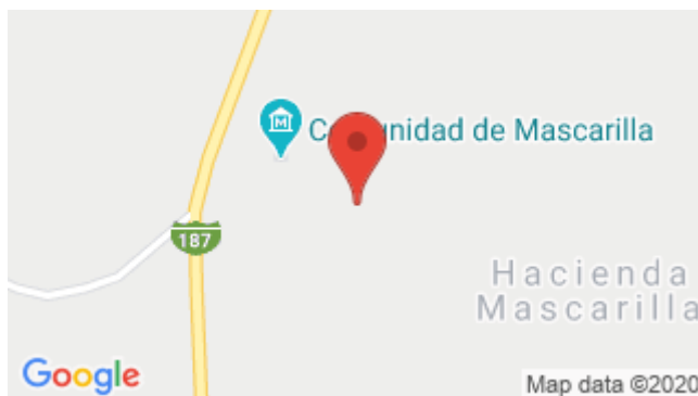
Figura 1. Ubicación Geográfica de la comunidad de Mascarilla 1