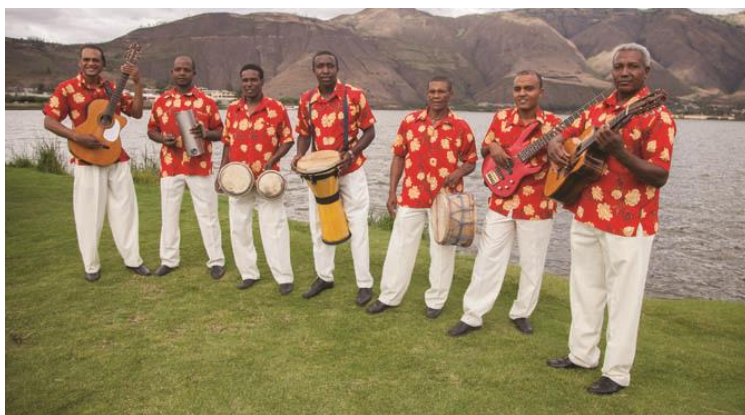
Figura 12. Agrupación musical Marabú