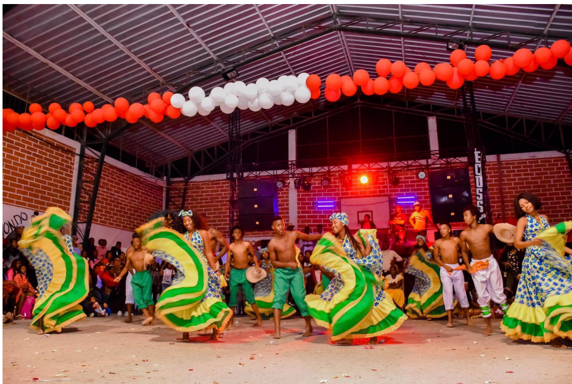
Figura 23. Academia Renacer Afro bailando marimba