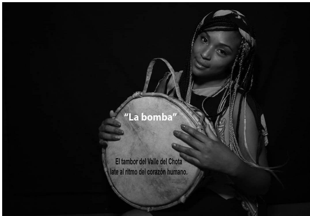
Figura 3. Mujer con la bomba como instrumento 3

El Valle del Chota es una región ubicada en el norte de Ecuador, conocida por su rica tradición cultural y su música bomba. La historia de la música bomba en el Valle del Chota se remonta a la época precolombina, cuando los pueblos indígenas de la región ya utilizaban tambores y percusiones en sus rituales y ceremonias religiosas. Con la llegada de los españoles en el siglo XVI, la música bomba se fusionó con las tradiciones musicales africanas y europeas, y se convirtió en una forma popular de expresión en las comunidades afrodescendientes e indígenas del Valle del Chota.