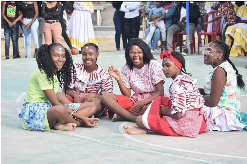
Figura 14. 14 Variedad de peinados 14

Las faldas también eran de colores, ya que les indicaban en que horario huir, sea el día, la noche, estos colores les indicaban que color de flores, plantas y demás debían seguir. Usaban faldas largas, bajo la rodilla, con plises, esta, era donde guardaban también las semillas, los mensajes, en cada pliegue ponían cositas para poderse liberar, poder huir, sabían que cada uno de los pliegues hacía referencia a la cantidad de esclavos que iban a