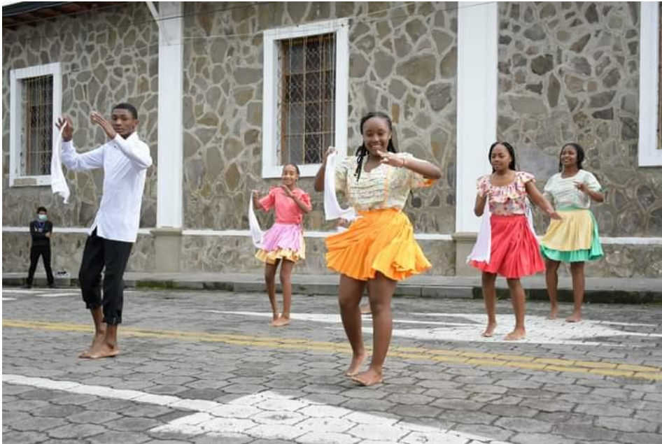
Figura 5. Academia Renacer Afro bailando Bomba 5

de esta iniciativa para lograr este objetivo. En esta entrevista, resaltó que;” La Bomba”, un instrumento y género musical de la sierra ecuatoriana es un logro del Municipio de Mira y el INPC que trabajaron en la incorporación de La Bomba en la Lista Representativa del patrimonio cultural inmaterial del Ecuador, como mecanismo de salvaguardia y de revitalización de los saberes y practicas ancestrales que abarca esta manifestación.