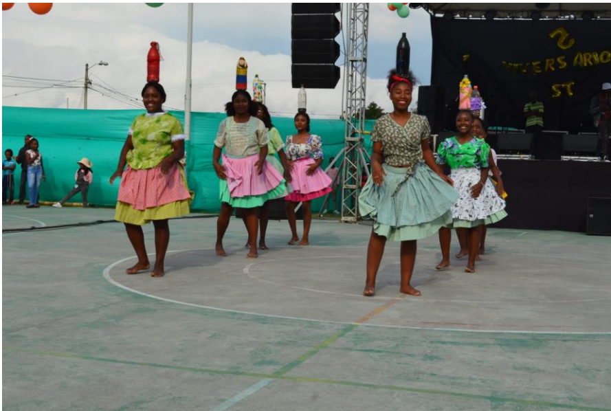
Figura 13. 13 Integrantes de la Academia de Danza Renacer Afro con traje de Bomba 13

También la vestimenta lleva collares, y decían que; mientras más collares tenga la mamá, la abuela significaba el tener más poder, el ser más sabia y más cimarrona, a través de los mismos contaban los días, los meses, los años y hasta la hora ya que no tenían de otra. En cada uno de los mullos que cada collar tenía, señalaban la fecha y por ello ya sabían que fecha es, cuándo es su cumpleaños y demás, así lo usaban al collar como estrategia para saber que distancia deben recorrer, cuánto tiempo los llevaba poder liberarse.