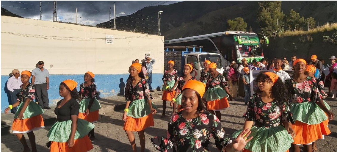
Figura 16. 16Agrupación Afro Illescas 16

El traje de los hombres, por lo general, siempre ha sido un pantalón negro, camisa blanca, tirantes, sombrero, allí también ellos escondían sus secretos, esa vestimenta simbolizaba el trabajo, el esfuerzo y la pasión con la que ellos hacían en sus actividades diarias, definitivamente entregaban su vida en ello y también mantuvieron en el traje los secretos para mostrar hoy que significaba libertad, trabajo, construcción y aporte al país; las iglesias, carreteras, ferrocarriles, lo cual hoy gozamos y nos debemos sentir orgullosos al usarlo, demostrar que ese traje fue parte de nuestra liberación y revitalizarla generación tras generación. A veces, se ponían pantalón blanco, camisa blanca, sombrero negro o blanco entero, usaban también pañuelos para amarrarse en la cabeza con distintos nudos, mismo que significaban el secreto que tenían, de cuándo van a huir. Por cierto, casi nunca usaban zapatos, eh allí el bailar descalzos las agrupaciones hoy en día.