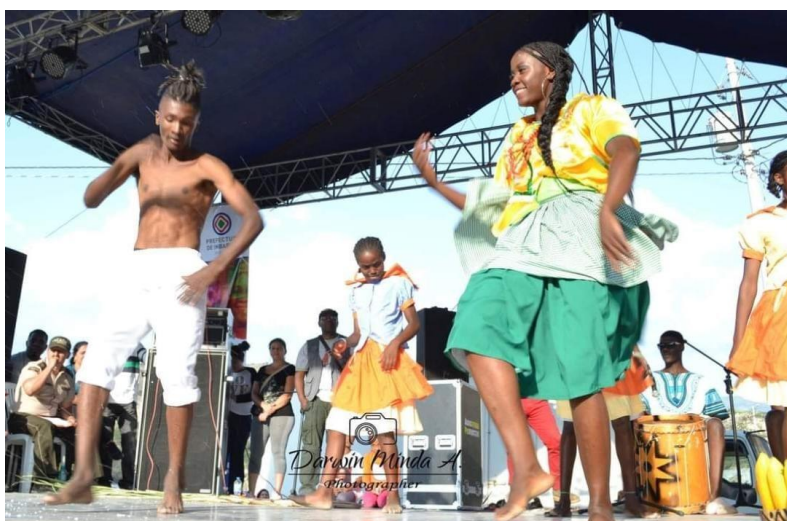
Figura15 15. Danzando con peinados típicos 15

También indicaban si la mujer era soltera, niña, adolescente, doncella, según como estaba el amarrado, el peinado, el vestido, este símbolo de libertad debe ser empoderado, ya que sin esa libertad ganada, no estaríamos disfrutando de este hoy distinto, de aprender, de emprender y luchar a través de la etnoeducación, para que sea escrita y sea parte del currículo educativo, y así se pueda seguir con el legado, debido a que quienes vivirán esos