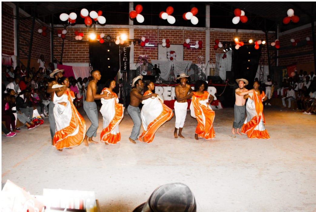
Figura 6. Estudiantes de la UTN bailando 6 Marimba

Dentro de este ámbito o ritmo afro, hay variedades, ya que de la marimba se deriva lo que es el andarele, el bambuco, el currulao y la caderona, ritmos provenientes de la marimba por los cuales cada ritmo se baila de distinta manera, no varía mucho lo que es los trajes e instrumentos, pero sí varía mucho en los pasos y el ritmo.