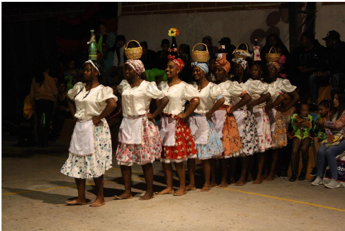
Figura 22.22 Agrupación dancística Samba Tropical 22