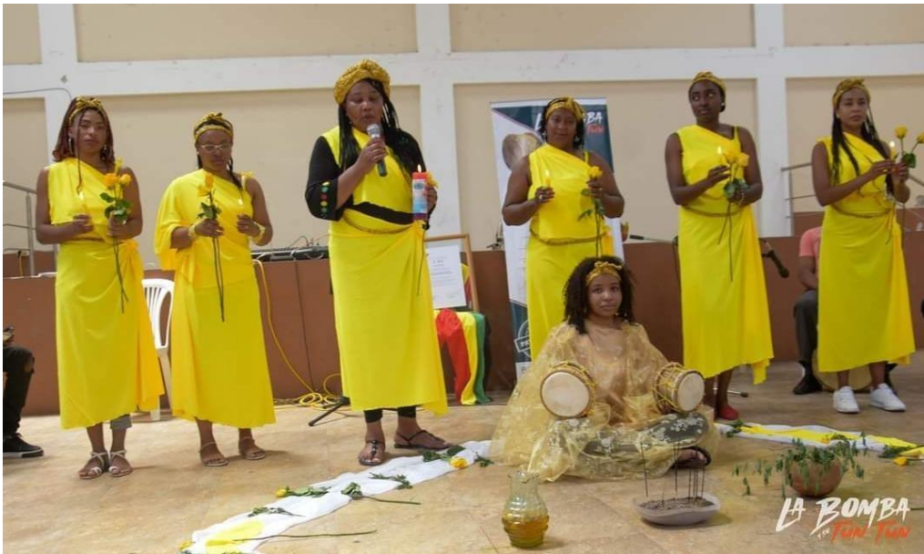
Figura 20.20 Práctica de la Cochita Amorosa 20

A través de los distintos espacios que nuestra cultura e identidad nos ayuda a fortalecer nuestra cultura, tenemos a la “Cochita Amorosa”, misma que al hacerla con nuestros estudiantes, nos ayuda a trasportarnos en el tiempo y empatar con nuestros ancestros, así, esto ayuda a fomentar sentido de pertenencia en los alumnos, a crear más confianza en sí mismos, así como también, permite conocer aquellos pensamientos, experiencias y sentimientos que ellos llevan dentro frente a su cultura, por ello: