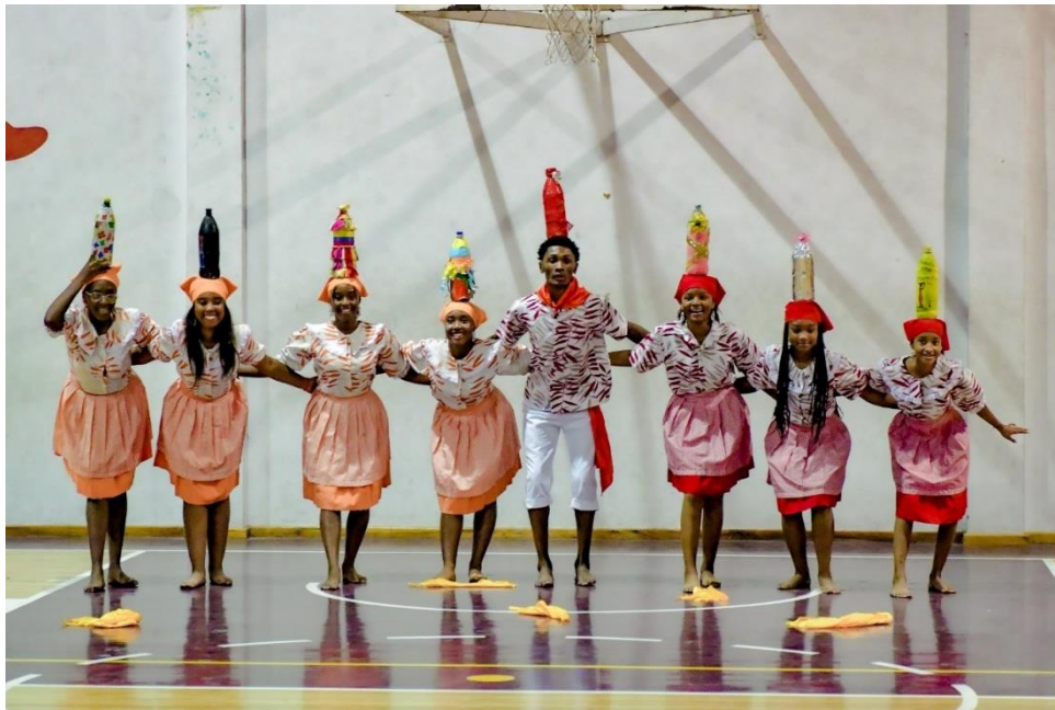
Figura 17.17 Indumentaria del baile de la Bomba 17

Hablando de la bomba como instrumento, para ellos poder enseñar, identificaban a las personas idóneas para hacerlo, mismas que se vean interesadas en mantener esa cultura viva, y, sobre todo, mantener una identidad que por años los ultrajaron, lo hacían solo práctico, ya que al no saber ni leer ni escribir lo único que ellos podían hacer es enseñar mediante la práctica y corregir a quien se deja corregir.