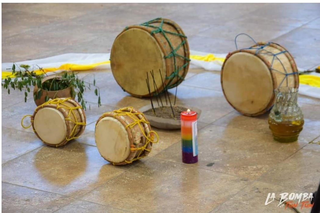
Figura 21.21 Elementos de la Cochita Amorosa 21

También, según Carabalí, (2022), menciona que: la cochita amorosa dentro del territorio afrochoteño es el espacio de encuentro, donde se puede conversar, hablar, sentir, transmitir energía y sobre ello se hace énfasis en el fuego, de cómo nuestros ancestros en la antigüedad se reunían alrededor del fuego, en la cochita, para calentarse mientras contaban sus anécdotas e historias. A partir de ese fuego ir poniendo energías positivas dentro de uno mismo para compartirlas y expulsando las energías negativas.