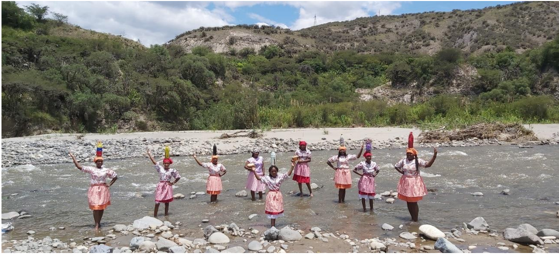
Figura 9. Mujeres danzando bomba en el Río Chota 9