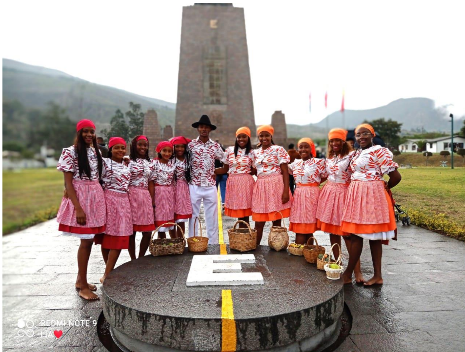
Figura 2. Academia Renacer Afro en Traje de Bomba 2

La danza afrochoteña en Ecuador es una forma de expresión artística que combina elementos de la cultura afroecuatoriana con la tradición de la danza choteña. El proceso artístico de esta danza incluye varios pasos que son: