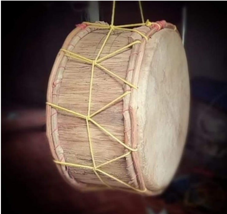
Figura 19.19 Instrumento musical - La Bomba 19

Me basé en estos aspectos para dar a entender de que aún hay esperanza en los niños, esperanza que a través del tiempo será transmitida de generación en generación, en las instituciones educativas y también en los diferentes grupos afro – culturales existentes en el Ecuador.