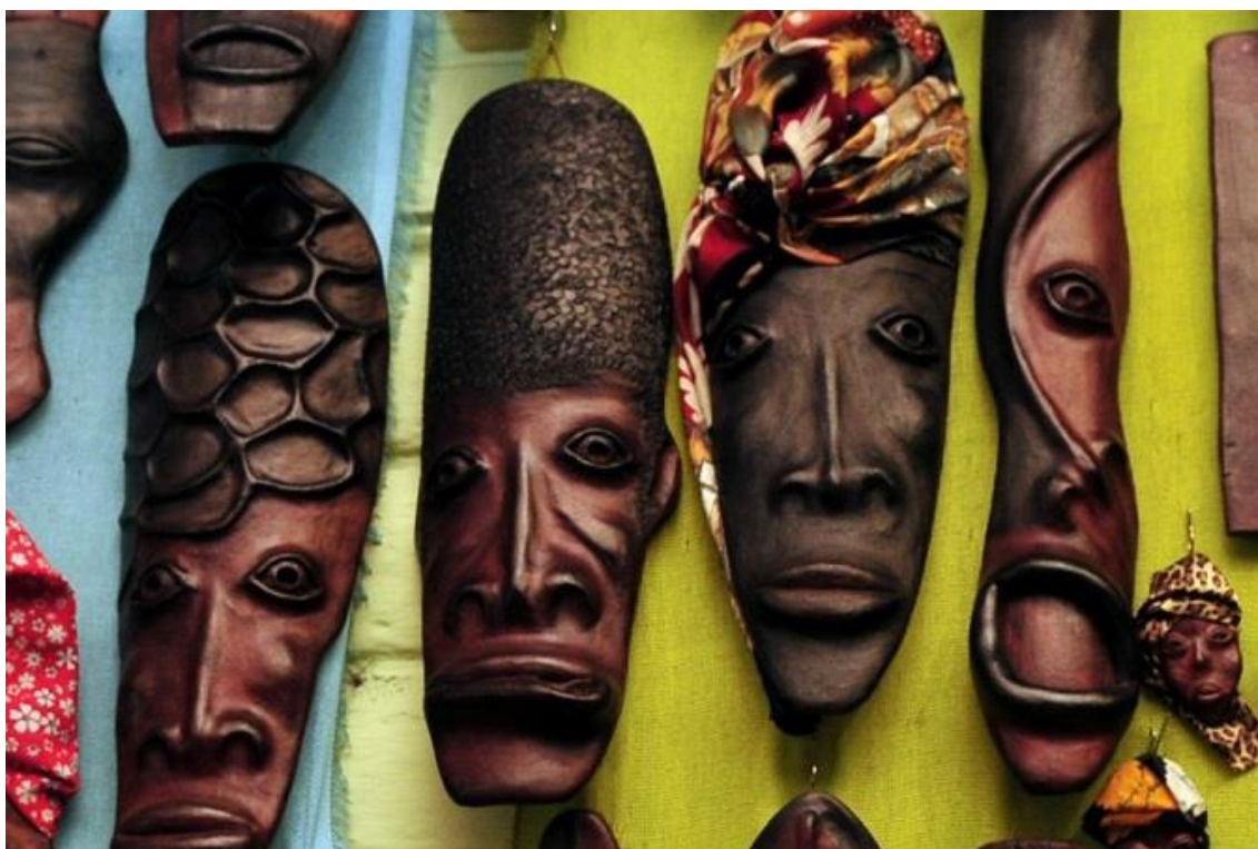
Figura 8. Máscaras de la Asociación “GAEN” 8

Mina A. P., (2022), en su investigación, hace referencia al grupo organizado “GAEN”, mismo que es un ente reconocido a lo largo del territorio afro, así como también es reconocido a nivel nacional e internacional, abrió el camino hace 25 años aprendiendo la técnica de la cerámica ya que desde el una de las integrantes menciona que desde el primer momento iniciaron a moldear la tierra donde pueden expresar gestos, emociones, sentimientos, personajes, a través de las máscaras hechas en arcilla, ellas buscan fortalecer su identidad y costumbre del pueblo afro. Sobre la definición de artesanía según Andrade, (2008), señala que, la riqueza de las artesanías muestra que es un ámbito dinámico, incluye procedimientos productivos rudimentarios que se mantienen a pesar de la incorporación de tecnologías sofisticadas y de industrialización, que dan lugar incluso a adaptaciones, transformaciones y en otros casos a la desaparición de diseños, conocimientos y tecnologías, o que también ratifican su persistencia. Las mujeres se organizaron para trabajar bajo el pretexto de moldear el barro realizando las máscaras de arcilla y más objetos artesanales, según Acosta (2022), les permitió despertar el interés de capacitarse y así conocer más su identidad a través de este arte. La elaboración de las máscaras les permitió mantener viva su historia, su destreza y lucha constante para sobresalir ante situaciones diversas.