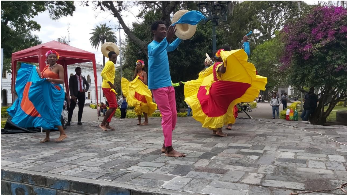
Figura 7. Grupo de Danza Afro UTN bailando marimba 7