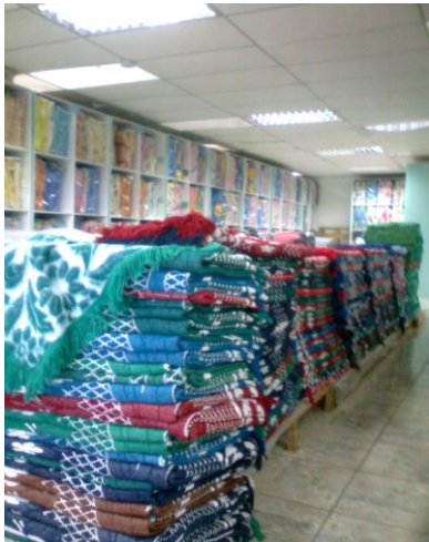
En el almacén cobijas diseño