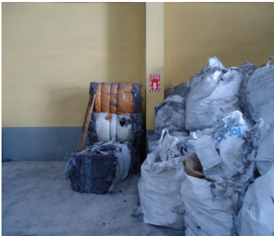
Base de padding