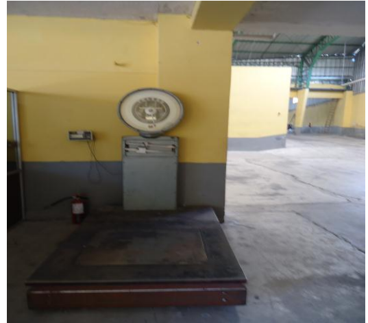
Pesa para recepción de material