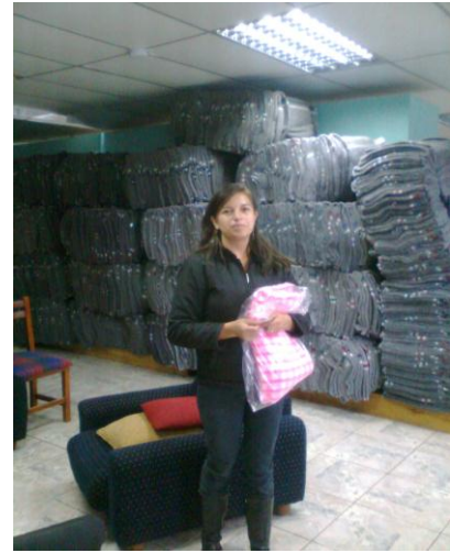
En el almacén junto a las cobijas escocesas