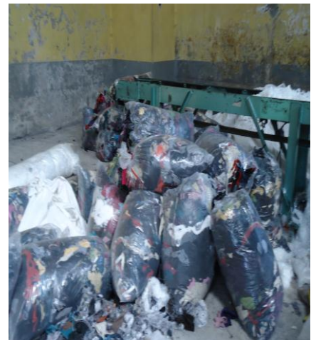
Materia prima para elaborar base de padding y plumón