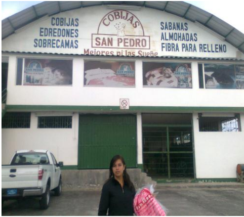
En la entrada de la fábrica