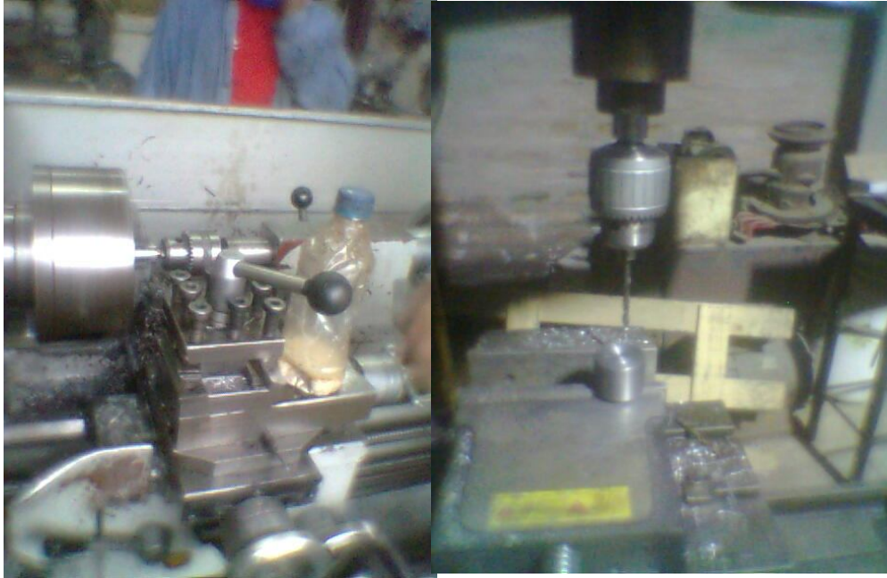
ANEXO 3: Torneado de partes.