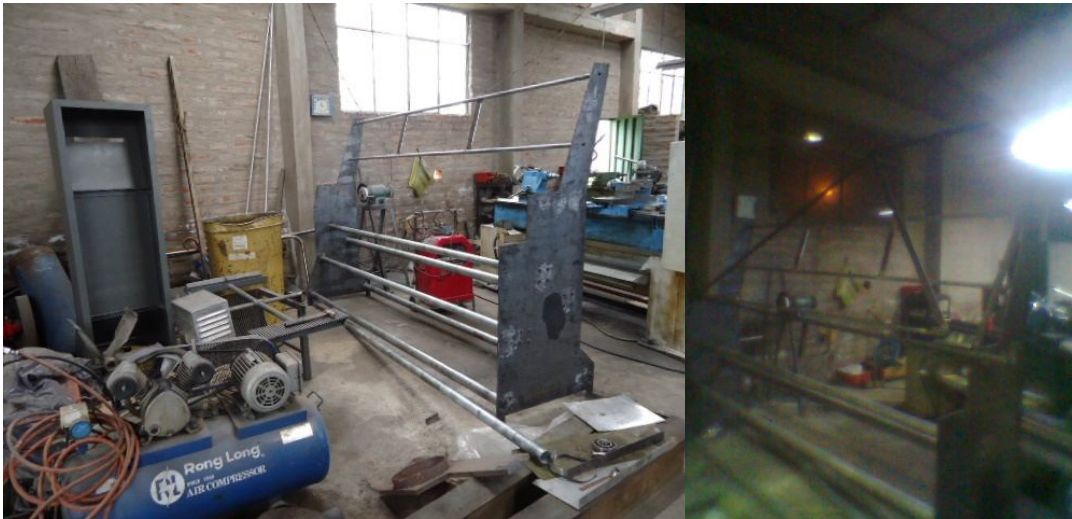
ANEXO 4: Armado de la Bancada.