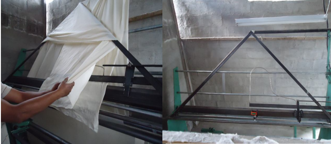
ANEXO 7: Sistema Doblador.