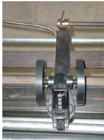
ANEXO 10: Cuenta metros.