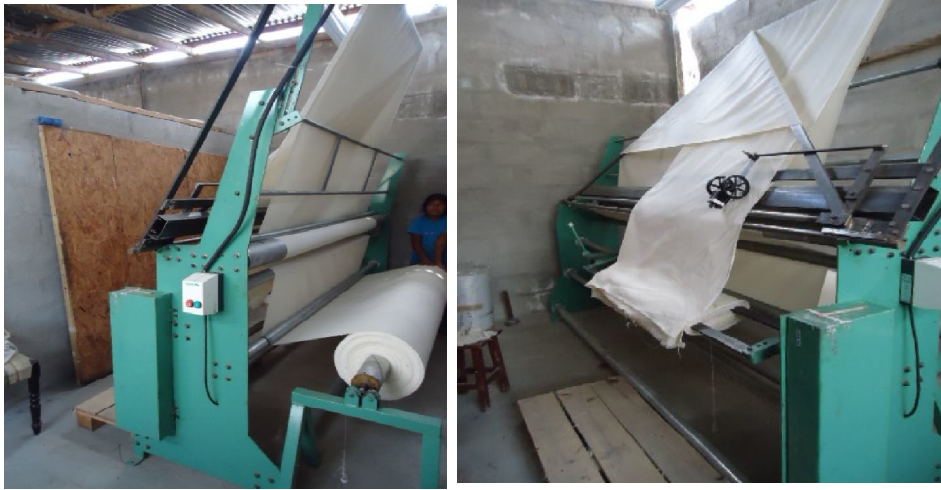
ANEXO 9: Máquina dobladora Vista anterior y posterior.