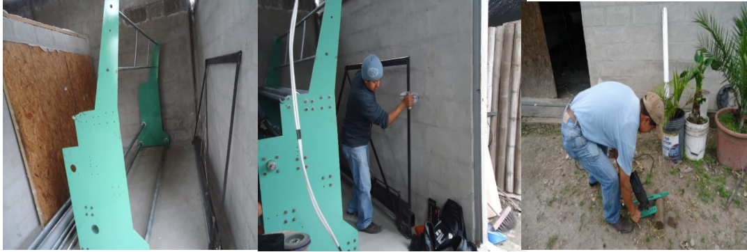
ANEXO5: Montaje de la Máquina Doblador.