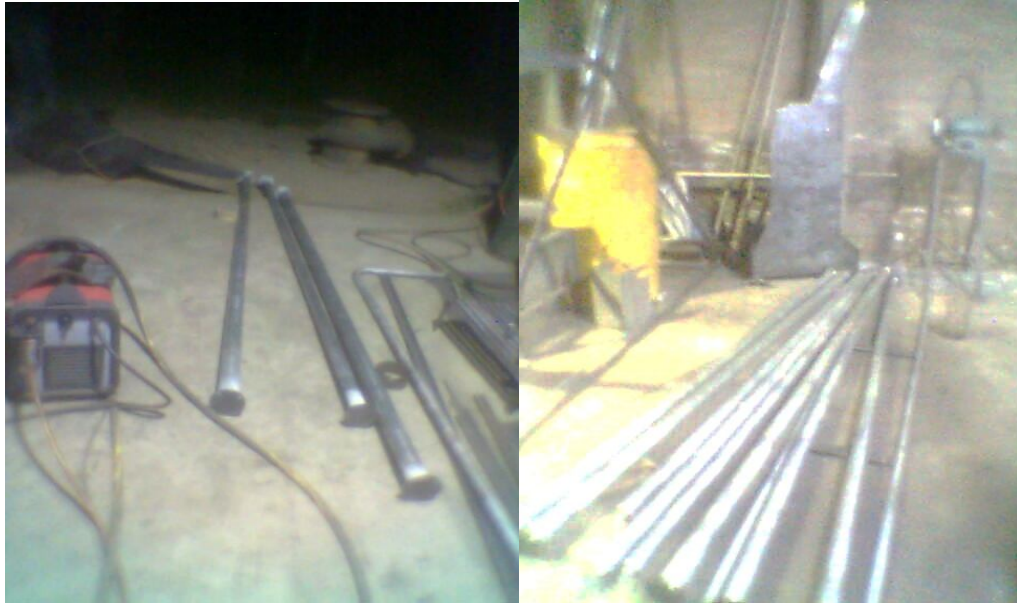
ANEXO 1: Materiales Utilizados.