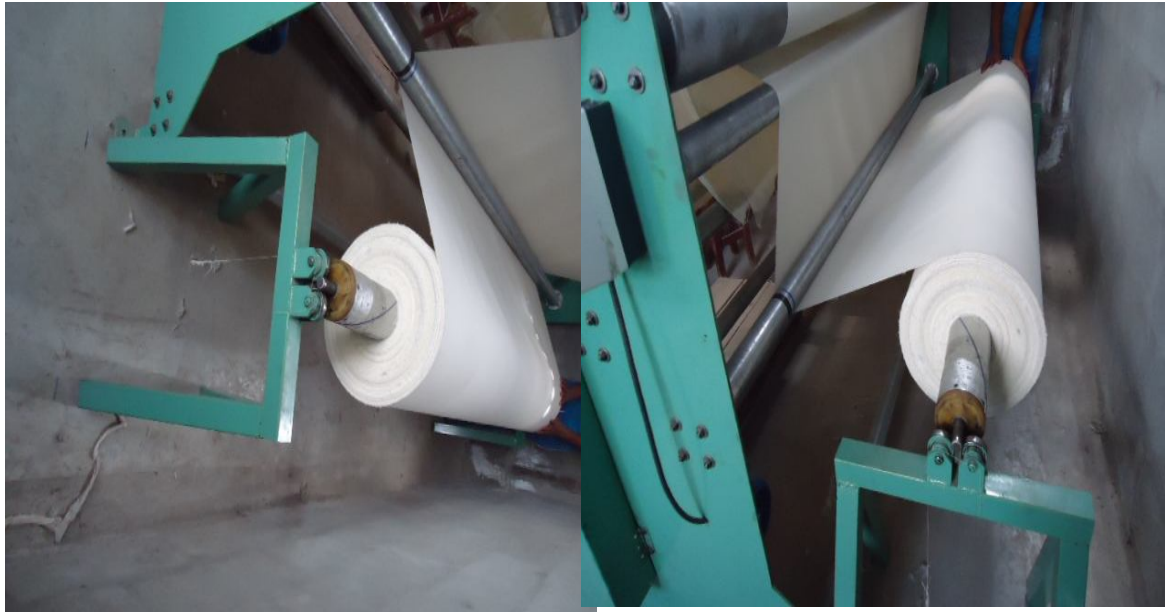
ANEXO6: Sistema Desenrollador.