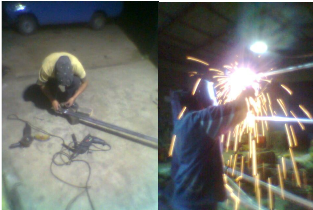
ANEXO 2: Perforaciones y Suelta e Elementos.