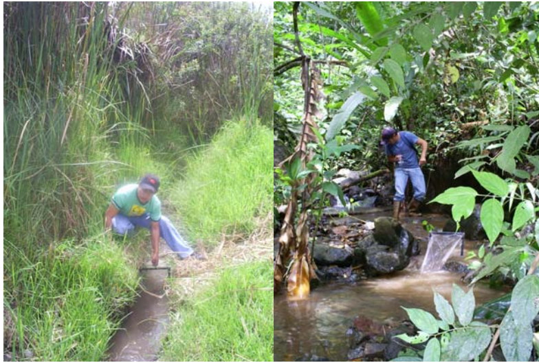
Fig. 2 Toma de Muestras