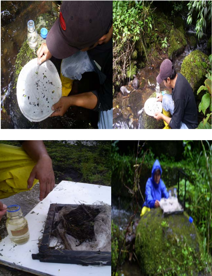
Fig. 4 Muestras en Alcohol y Análisis en el laboratorio