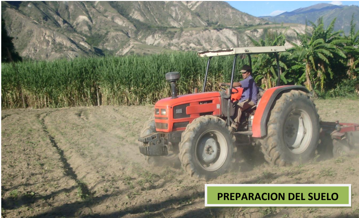
PREPARACION DEL SUELO