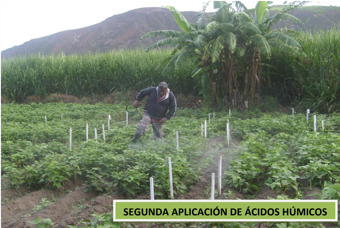
SEGUNDA APLICACIÓN DE ÁCIDOS HÚMICOS