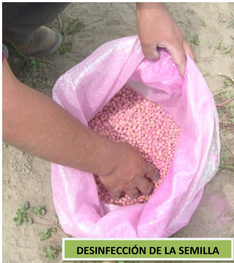
DESINFECCIÓN DE LA SEMILLA