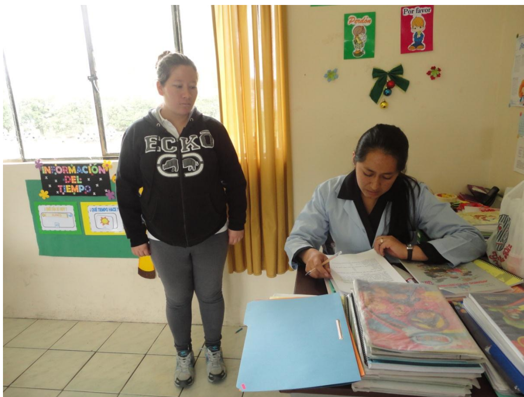
FUENTE: ENCUESTA APLICADA A DOCENTES DE LAS ESCUELAS FISCALES DEL CANTON COTACACHI