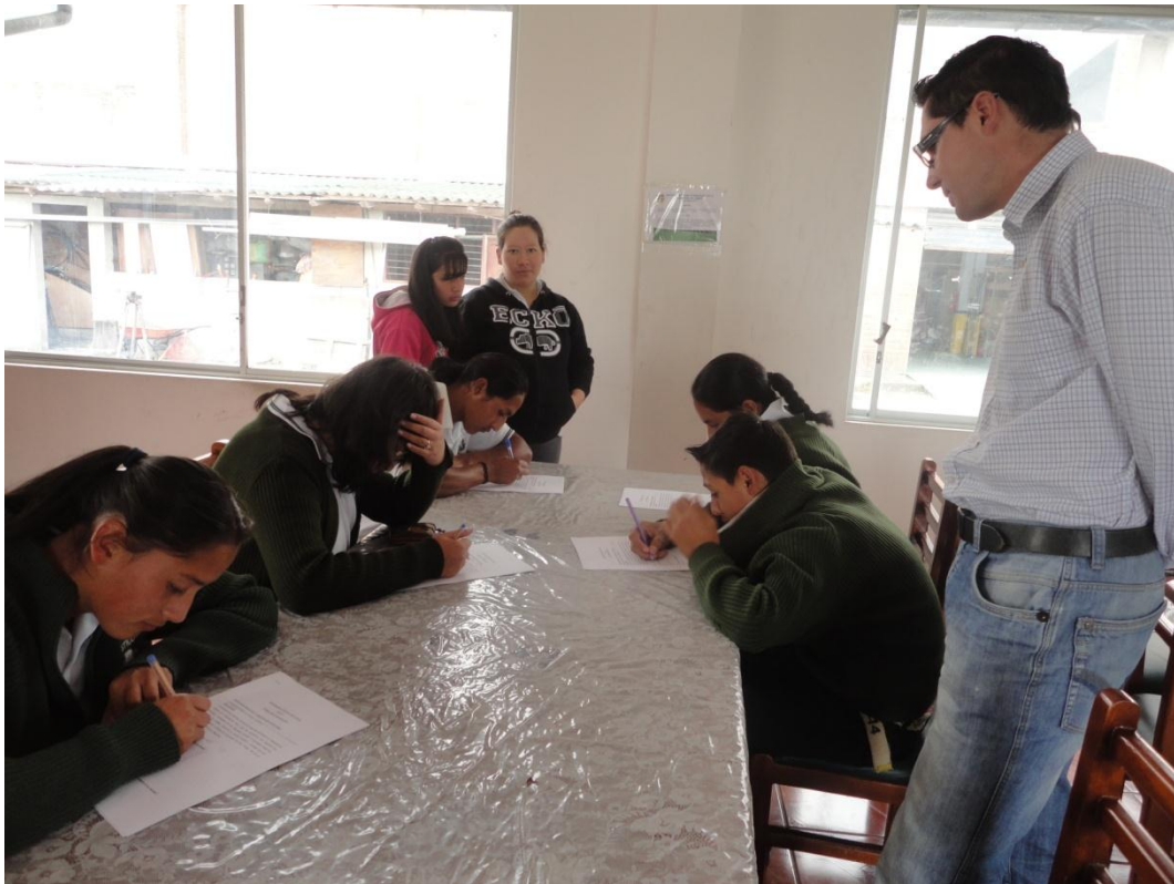
FUENTE: ENCUESTAS APLICADA EN LA ESCUELA DE CUERO