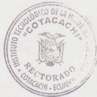
MSc. Cléver Cerpa RECTOR UEC

Calle Filemón Proaño s/n - Sector San Teodoro - Cotacachi - Imbabura