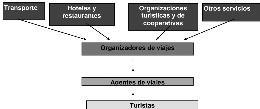
Figura 1 Medio ambiente turístico

De todos los datos analizados anteriormente se puede determinar que la estructura del servicio turístico está resumido en el siguiente esquema: