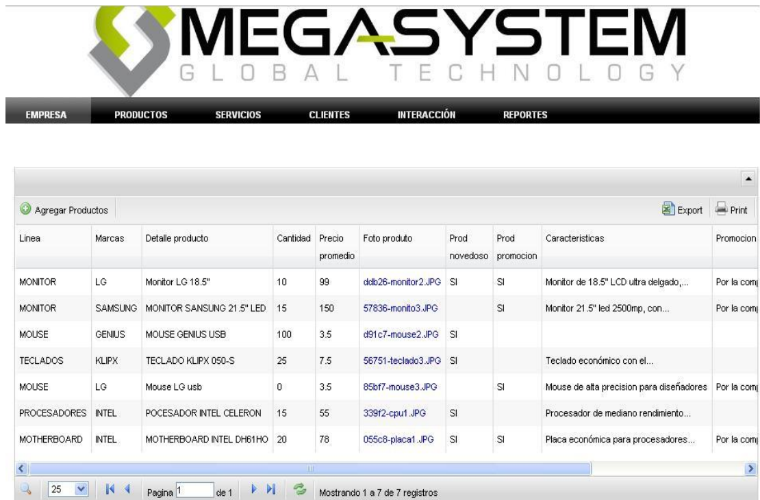
Figura 9: Página administración de Productos

Productos.- se ingresa todos los productos que se maneja en stock