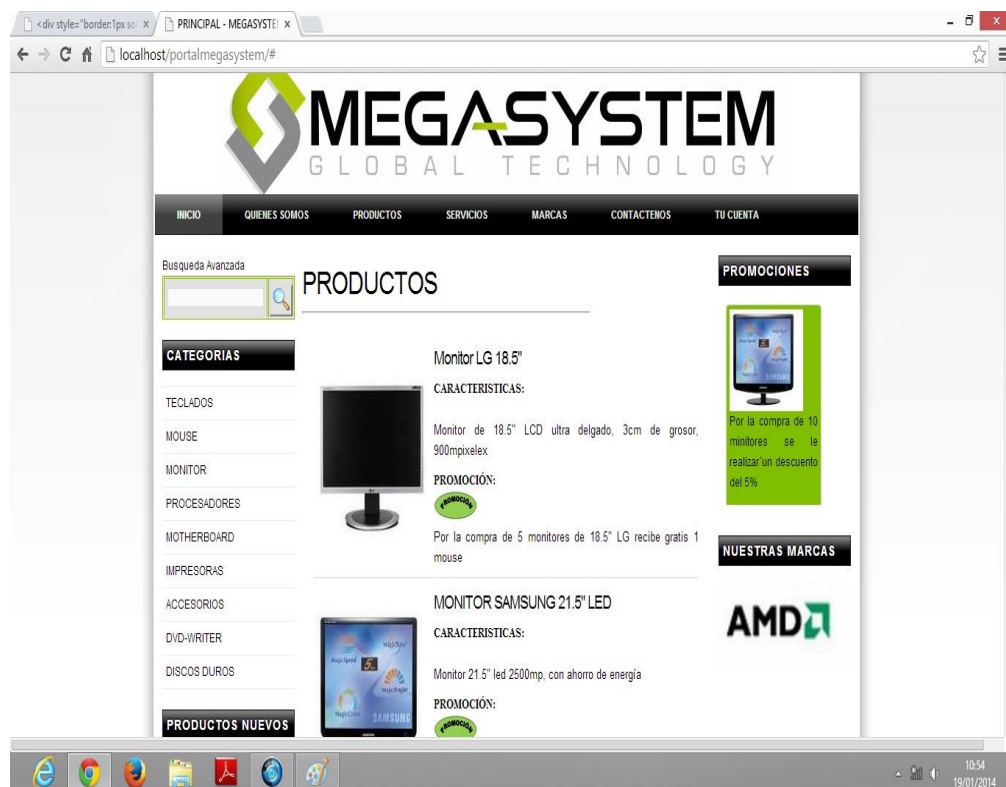
Figura 22: Página Frontend de Usuarios no Registrados

En este módulo se presenta la información general de la empresa, se puede navegar por páginas que muestran catálogos de los productos categorizados por líneas y por marcas, permite interactuar con los responsables de la empresa por medio de formularios de solicitudes, de sugerencias y de contacto con la empresa, se puede buscar productos usando el buscador, en esta parte la información de productos no contienen precios. Para poder acceder a este módulo se pone en un navegador web la siguiente dirección www.megasystemecuador.com/