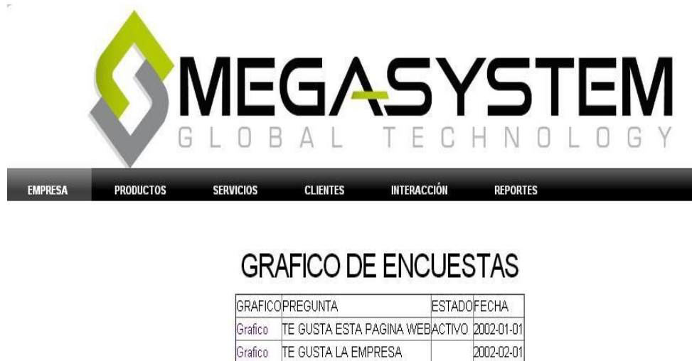
Figura 19: Cuadro de Encuestas

Gráfico Encuesta.- realiza un grafico estadístico de cada una de las preguntas.