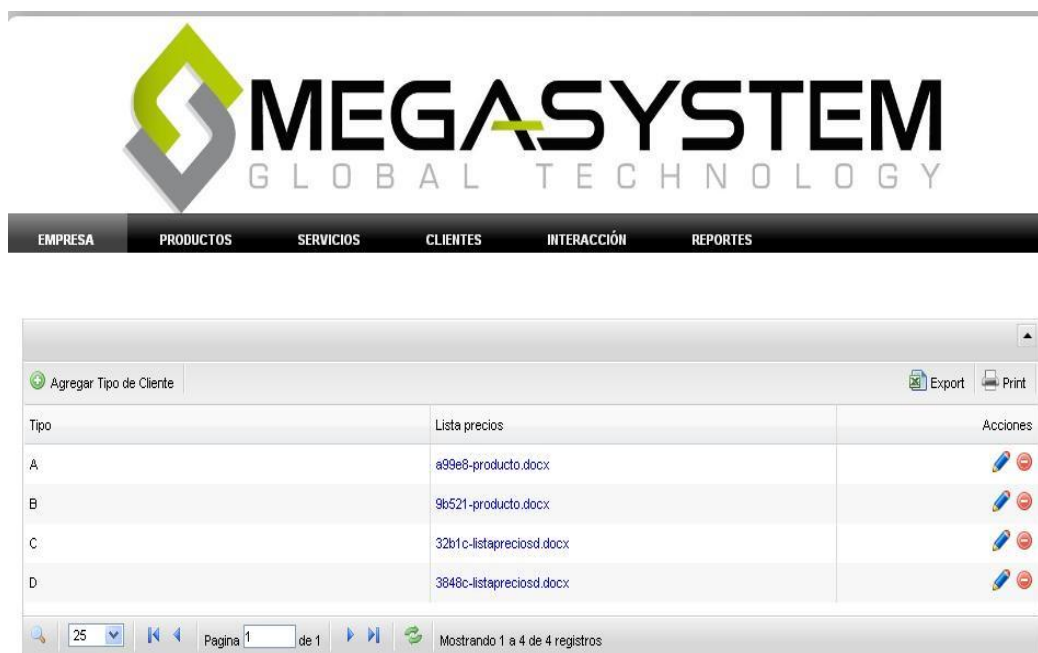
Figura 14: Página administración de Tipo de Clientes

Tipo Clientes.- administra los tipos de clientes según como se le considere dentro de la empresa.