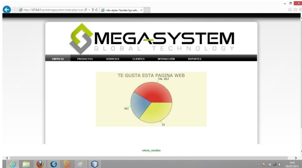
Figura 20: Gráfico estadístico de encuesta

En la opción Reportes se puede realizar reportes de la información que se está administrando en el módulo del administrador, se pueden realizar reportes de: Sugerencias, Contactos Invitados, Usuarios, Líneas, Marcas, Productos, Encuestas, Cotizaciones