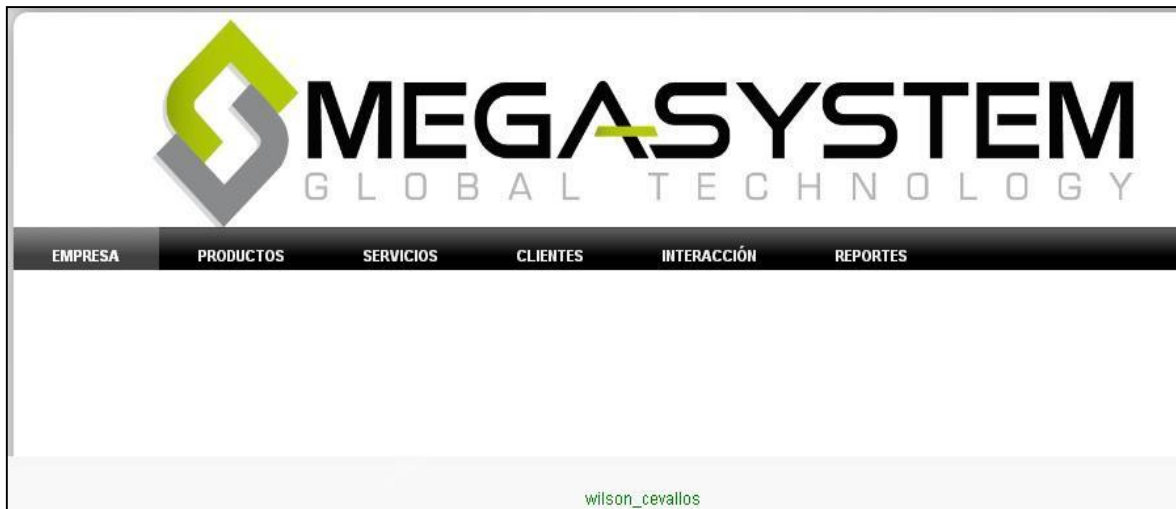
Figura 2: Página de administrador

En la opción Empresa se encuentra un submenú para administrar información referente a la empresa: Información de Empresa, Instalaciones, Asesores, Noticias, Fotos Inicio.