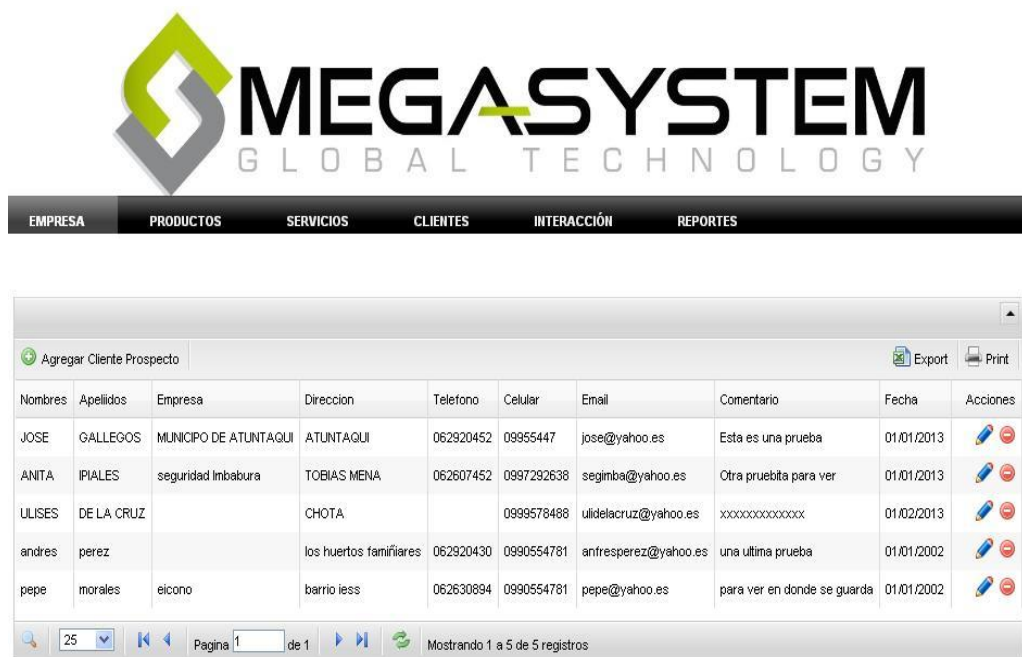
Figura 12: Página administración de Contactos Invitados

Contactos Invitados.- son cualquier tipo de persona que se lo considera clientes invitado y que se contacta con la empresa mediante el portal.