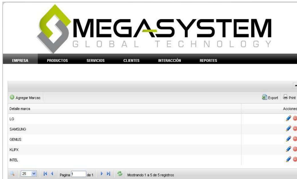
Figura 8: Página administración de Marcas

Marcas.- administra las marcas que maneja la empresa.