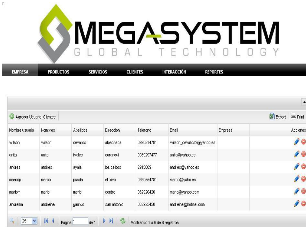
Figura 13: Página administración de Usuarios Registrados

Tipo Clientes.- administra los tipos de clientes según como se le considere dentro de la empresa.