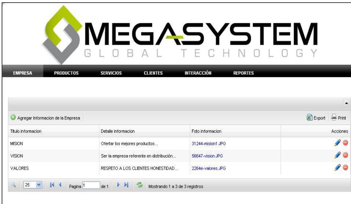
Figura 1: Página Información de Empresa

Información de Empresa.- administra toda la información referente a la empresa que se quiera que los usuarios conozcan y vean en la página.