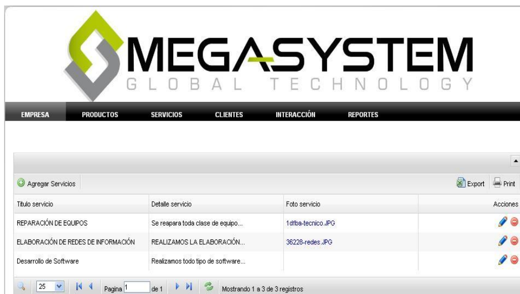
Figura 11: Página administración de Servicios

En la opción Servicios se puede administrar información referente a los servicios generales que ofrece la empresa.