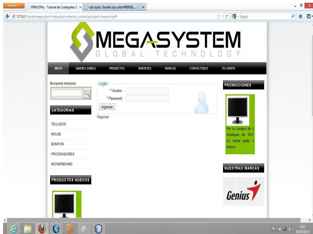
Figura 23: Formulario de ingreso a módulo usuarios registrados

por la empresa, si no está registrado tiene la opción en el botón Registrarse en donde se despliega un formulario para ingresar sus datos, si no recuerda los datos de login y password, tiene la opción Olvidaste tu Contraseña en donde se ingresa el correo con el que se registró y el sistema envía un correo automáticamente a esa dirección.