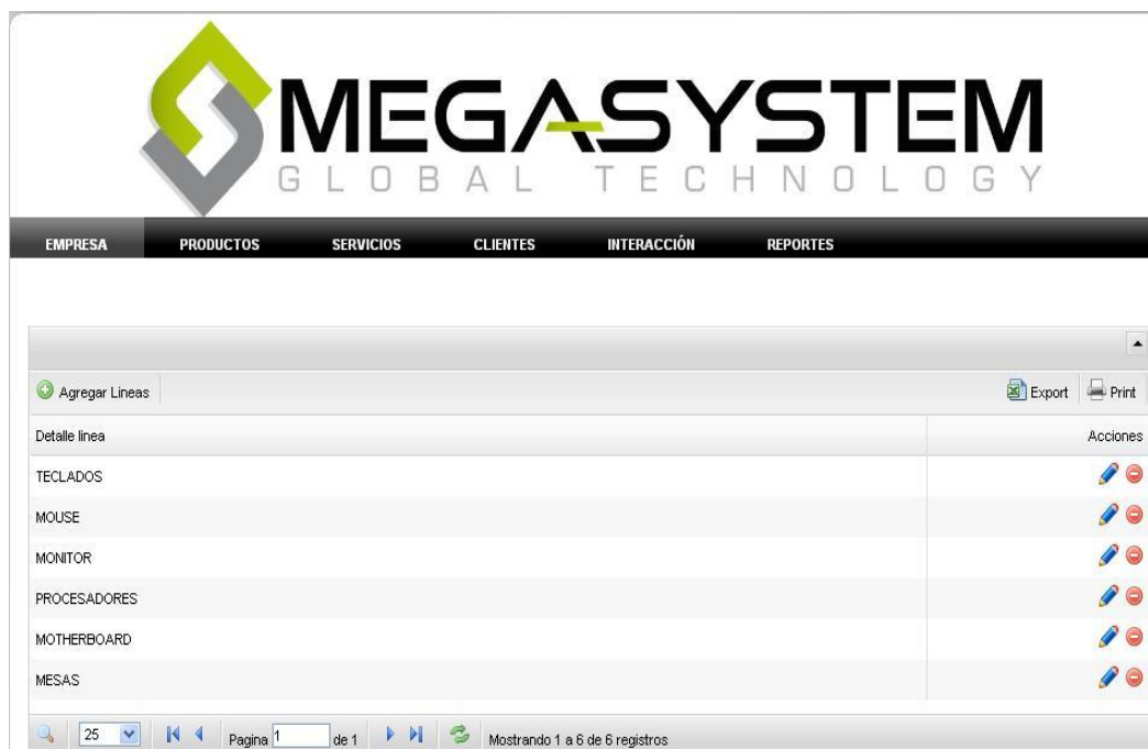
Figura 7: Página administración de Líneas de productos

Líneas. - se ingresan las líneas de productos que maneja la empresa