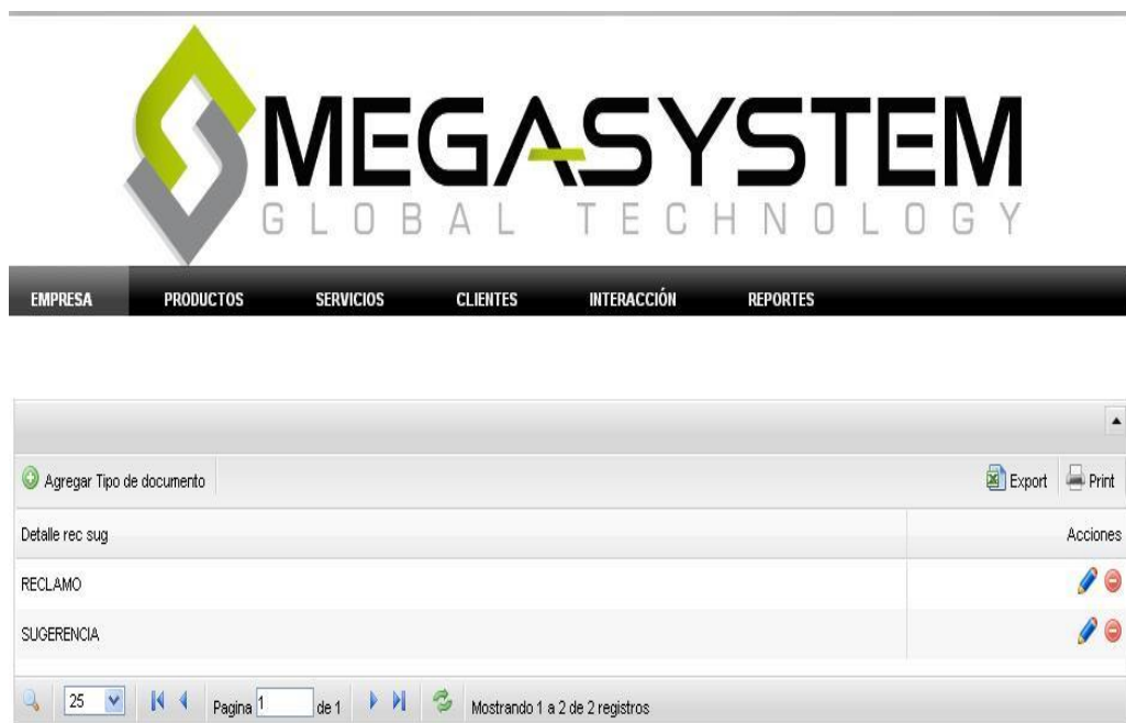
Figura 15: Página administración de Tipo de Documento

Tipo Documento. - se puede definir qué tipo de documento queremos crear como: sugerencias, reclamos, solicitudes para que sea presentado en la página al cliente.