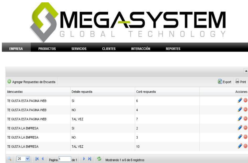
Figura 18: Página administración de Respuestas de Encuestas

Respuestas Encuesta.- ingreso de las varias respuestas posibles a cada una de las preguntas de la encuesta.