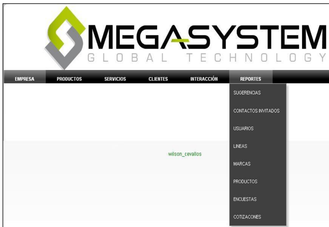
Figura 21: Página administración de Reportes

En la opción Reportes se puede realizar reportes de la información que se está administrando en el módulo del administrador, se pueden realizar reportes de: Sugerencias, Contactos Invitados, Usuarios, Líneas, Marcas, Productos, Encuestas, Cotizaciones