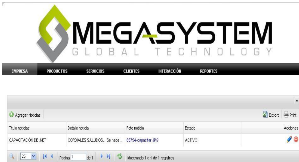
Figura 6: Página administración de Noticias

En la opción Productos se encuentra un submenú para administrar información referente a los productos: Líneas, Marcas, Productos, Precios.