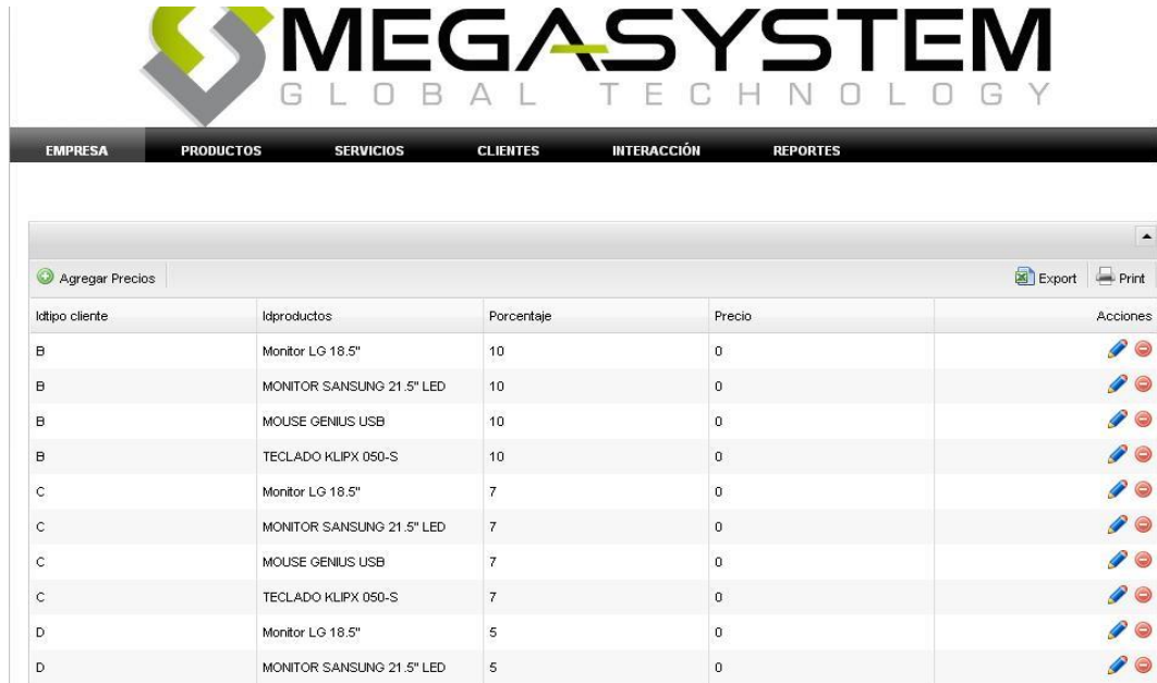
Figura 10: Página administración de Precios

Precios.- administra los precios diferenciados de los productos, según el tipo de cliente.