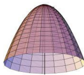
Figura N° 1. Modelo parabolóide de las ramas

En el análisis dendrométrico de ramas, el modelo geométrico que proporcionó el volumen más próximo al real fue el parabolóide (figura 1), con un coeficiente de 0.83, (tabla 2).