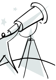
Nombre de imagen o gráfico.

La información más importante se incluye aquí, en los paneles interiores. Utilice estos paneles para presentar su organización y describir los productos y servicios especí-