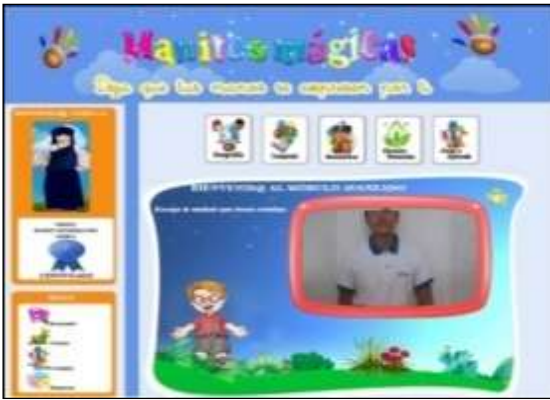
Figura. 6. Pantalla Principal Modulo Avanzado