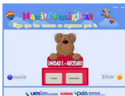
Figura 4. Pantalla de acceso a los contenidos.