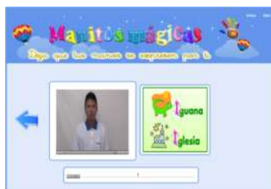
Figura 5. Presentación de temas

El módulo avanzado tiene cinco unidades: Geografía (países, provincias del Ecuador, Mapas), matemáticas (suma, resta, multiplicación, vocabulario), Lenguaje y Comunicación (verbos, sustantivos, antónimos, sinónimos, entre otros) y Ciencias naturales, además se forma oraciones con esas palabras, frases cotidianas para poder entablar una conversación, un buscador y juegos. A continuación algunas imágenes de su interfaz.