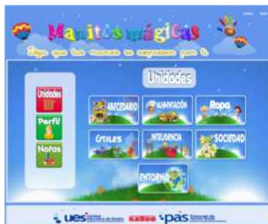
Figura 3. Menú Principal del Módulo Básico

La aplicación web “Manitos Mágicas” es una herramienta de apoyo, se compone de dos módulos: módulo básico y avanzado. El módulo básico tiene siete unidades: Abecedario, Alimentación, Ropa (Vestido), Útiles, Inteligencia, Sociedad, Entorno. A continuación algunas imágenes de su interfaz.