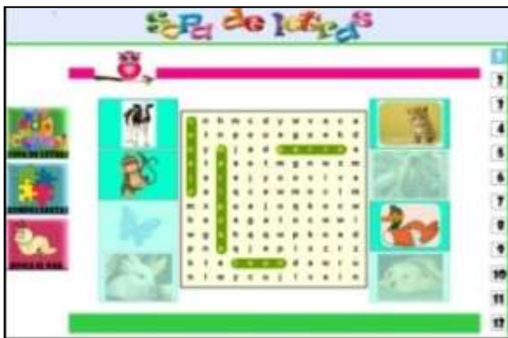
Figura. 8. Pantalla de actividades lúdicas