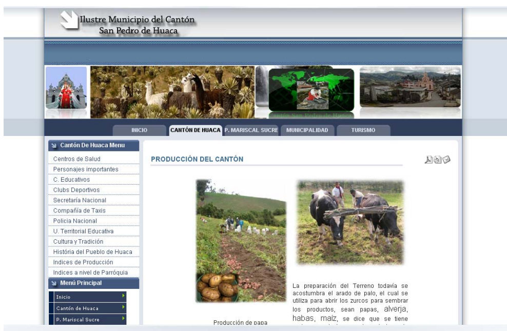
Figura. 7.1 Interface Definitivo del Portal web

La interface para todas las presentaciones será con la misma estética y diseño tanto del banner, del menú y enlaces, etc.