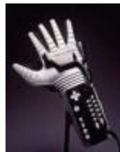
Figura 5.1.a. Dataglove

cada dedo. Una pequeña tira de plástico mylar es cubierta con una tinta eléctricamente conductora y colocada a lo largo de la longitud de cada dedo. Cuando los dedos son llevados rectos, una corriente eléctrica pequeña pasando a través de la tinta permanece estable. Cuando se dobla un dedo, la computadora puede medir el cambio en la resistencia eléctrica de la tinta. La ventaja principal de los diferentes tipos de guantes es que proporcionan un dispositivo de interacción más intuitivo que el ratón o una palanca de mando. Esto es porque los guantes permiten que la computadora lea y represente ademanes de la mano. Los objetos en el ambiente pueden por lo tanto ser "cogidos" y manipulados, el usuario puede apuntar en la dirección deseada de movimiento, las ventanas pueden ser cerradas, etc.