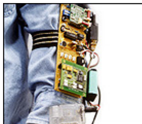
Figura 5.2. Computador Corporal

Hasta la fecha, los computadores personales suelen estar en una mesa e interaccionan con sus dueños una pequeña fracción del día. Los portátiles, laptops, móviles y similares minimizan los problemas asociados con la movilidad, pero el paradigma de trabajo se mantiene. Los computadores corporales intentan evitar esto cambiando el modo de utilizar un computador. Un computador corporal se puede observar en la figura 5.2 .