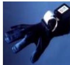
Figura 5.1.b. Powerglove