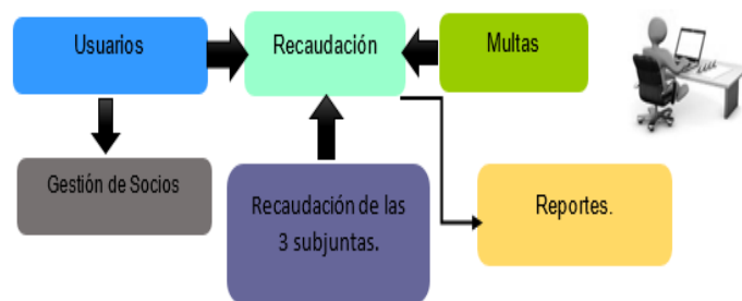
Figura 1: Diagrama de bloques de la aplicación.

La aplicación está conformada por los siguientes módulos.