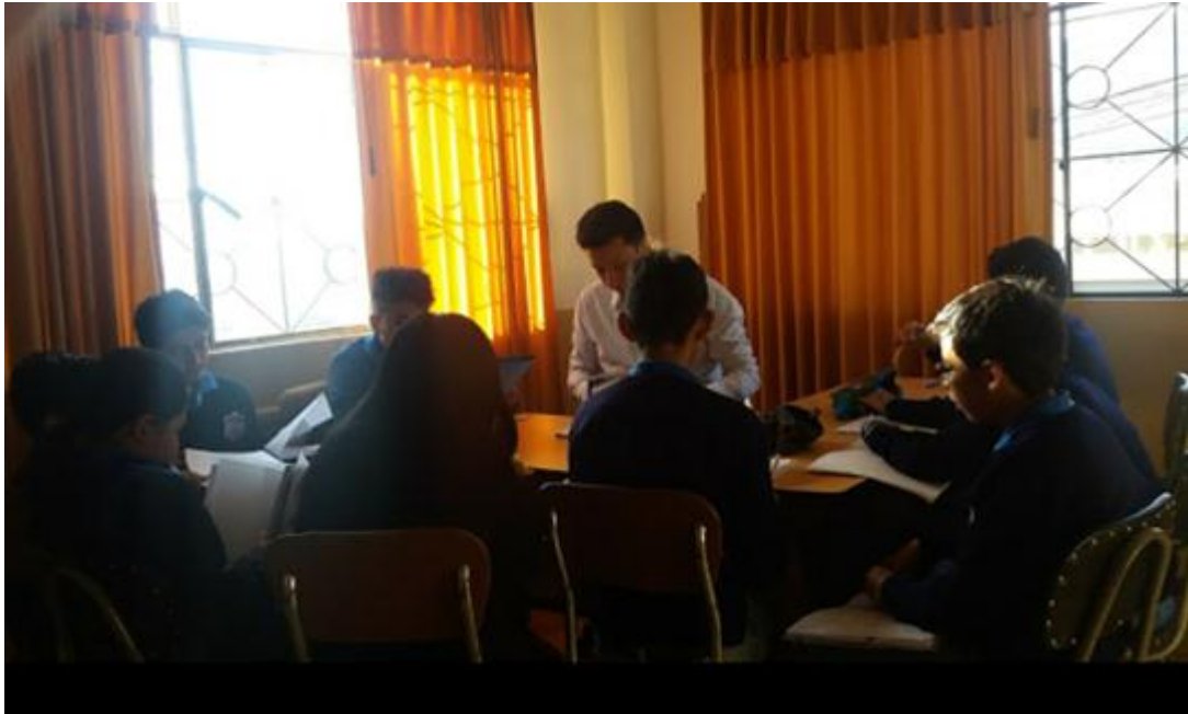
Fuente: Unidad Educativa Ulpiano Pérez Quiñones Elaborado por: Alexis Castillo