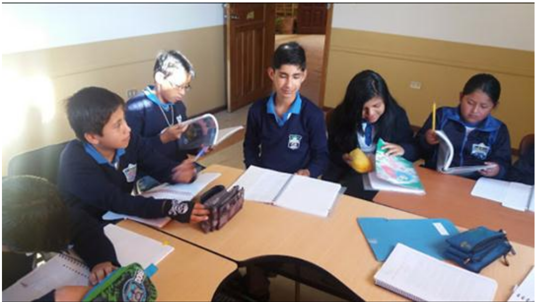
Fuente: Unidad Educativa Ulpiano Pérez Quiñones Elaborado por: Alexis Castillo