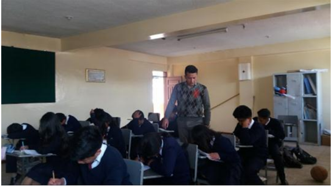
Fuente: Unidad Educativa Ulpiano Pérez Quiñones Elaborado por: Alexis Castillo