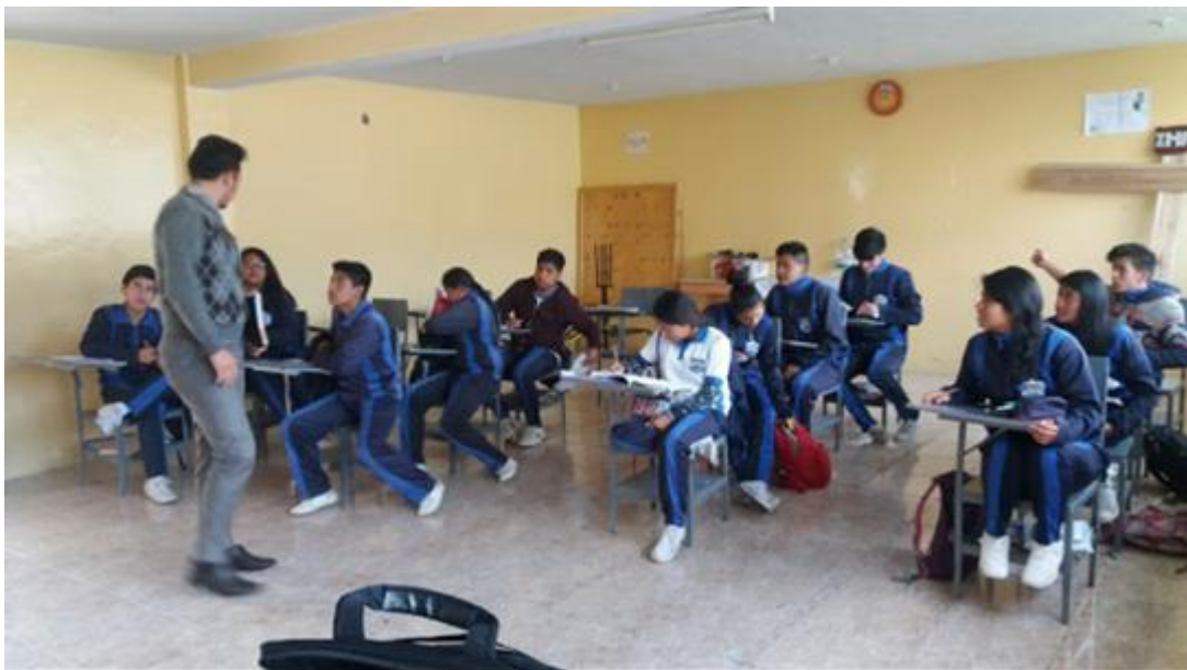
Fuente: Unidad Educativa Ulpiano Pérez Quiñones Elaborado por: Alexis Castillo