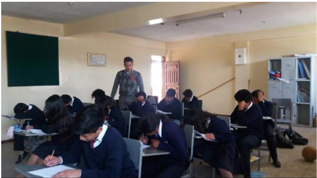
Fuente: Unidad Educativa Ulpiano Pérez Quiñones Elaborado por: Alexis Castillo