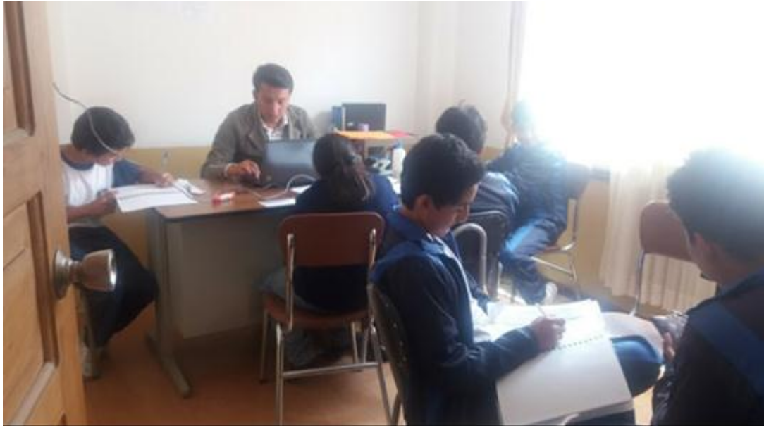
Fuente: Unidad Educativa Ulpiano Pérez Quiñones Elaborado por: Alexis Castillo