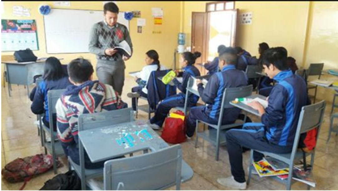
Fuente: Unidad Educativa Ulpiano Pérez Quiñones Elaborado por: Alexis Castillo