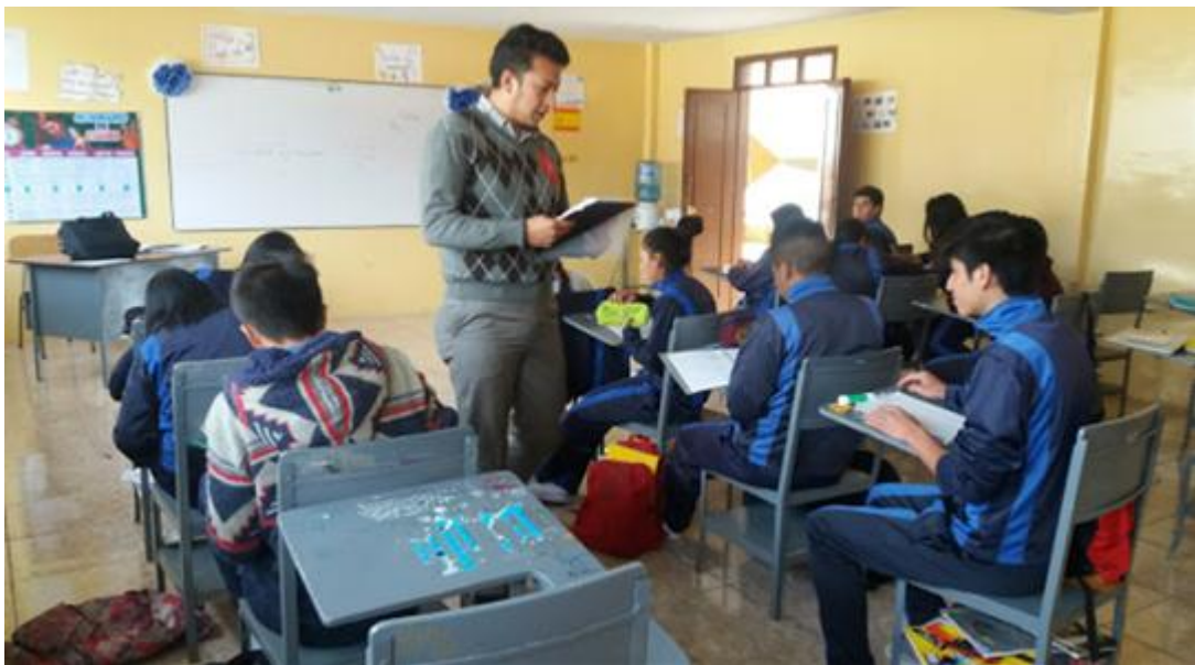
Elaborado por: Alexis Castillo