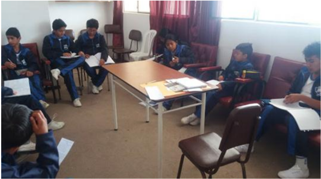
Fuente: Unidad Educativa Ulpiano Pérez Quiñones Elaborado por: Alexis Castillo