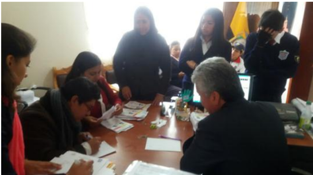
Fuente: Unidad Educativa Ulpiano Pérez Quiñones Elaborado por: Alexis Castillo