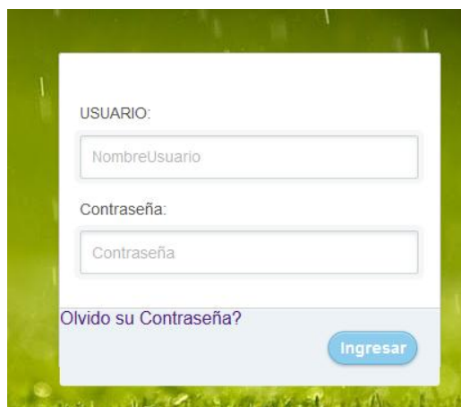
FIGURA 22: Pantalla de Ingreso al Sistema

En la siguiente pantalla se muestra el login o pantalla de ingreso de usuarios y contraseña. Con la cual se conectara a la base de datos MongoDB.