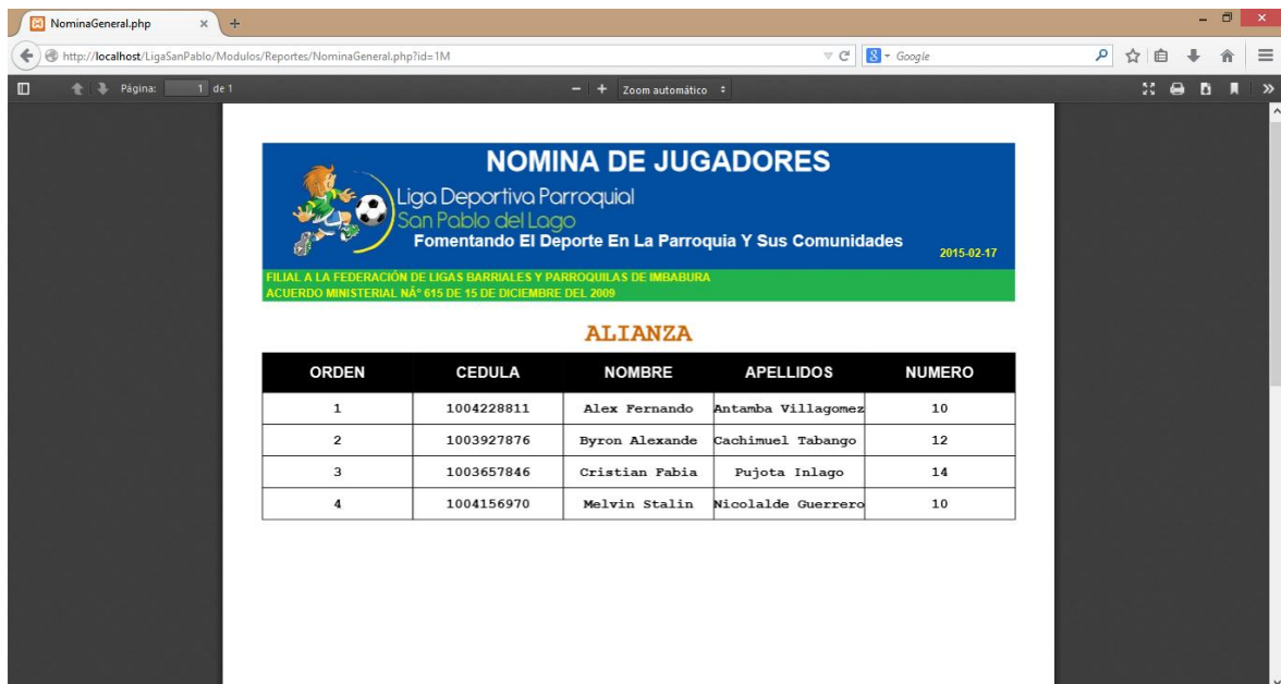
FIGURA 27: Pantalla del Sistema para imprimir los reportes Nominas.