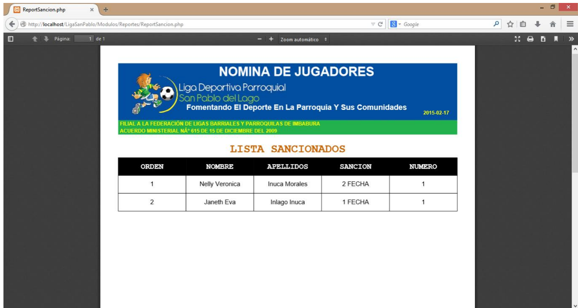
FIGURA 28: Pantalla del Sistema para imprimir los reportes Sancionados.