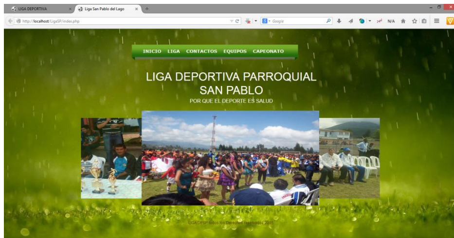
FIGURA 20: Pantalla principal o portada del Aplicacion

Logearse con su cuenta y clave de Usuario.