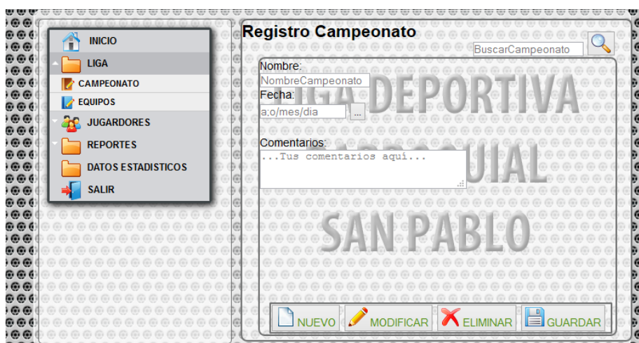
FIGURA 23: Pantalla del Sistema para Ingreso de datos Campeonato

Para poder crear campeonatos debemos dar clic en el enlace Liga\campeonato, de la misma forma para crear los equipos hacemos clic en Liga\Equipos