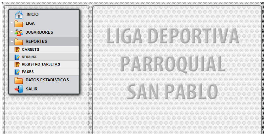
FIGURA 25: Pantalla del Sistema para visualizar los reportes

En esta sección podremos visualizar e imprimir los reportes de los jugadores, carnets, nominas, reportes de tarjetas, Documentos de Pases.