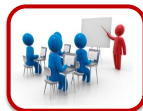
RUP: Fase de Transición