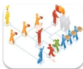
Proceso de Gestión de Talento Humano