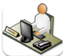
RUP: Fase de Construcción