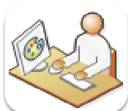
RUP: Fase de Elaboración