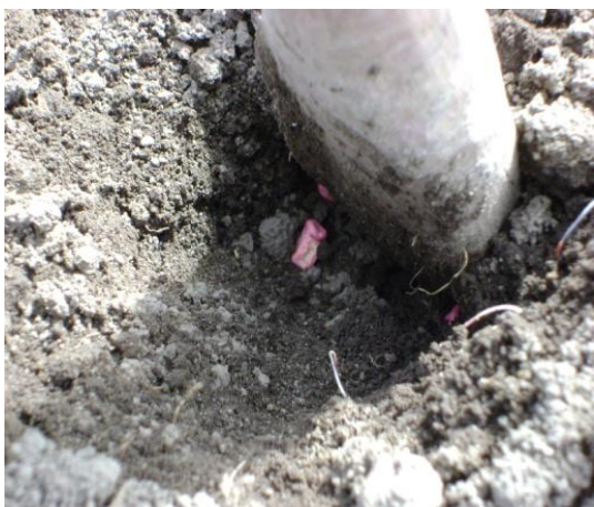
a) Siembra variedad Quantum