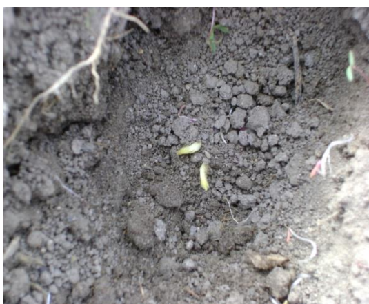
c) Germinación variedad Asthom