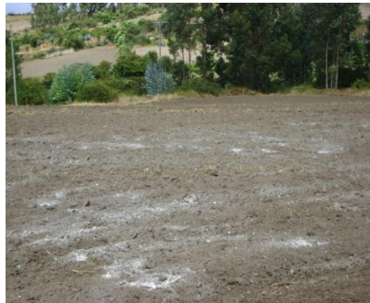
b) Aplicación de cal