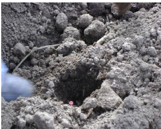
c) Siembra variedad semi verde