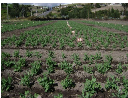
c) Fase de desarrollo