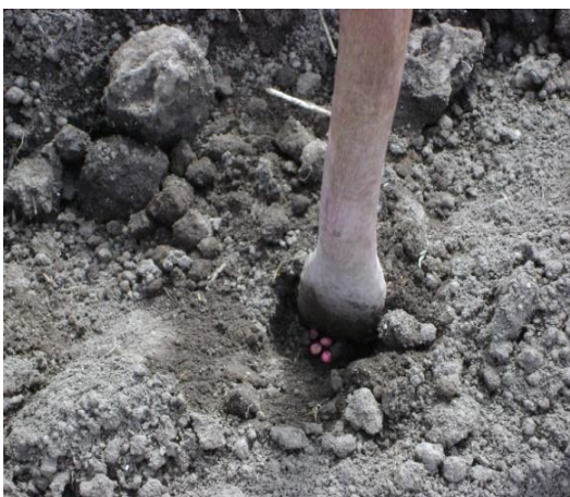
b) Siembra variedad Asthom