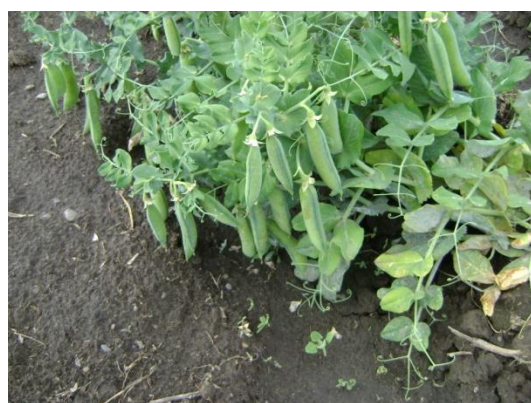
f) Riego en la Fase de maduración