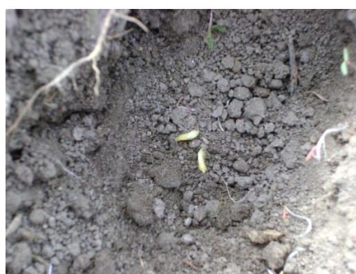
b) Fase de germinación