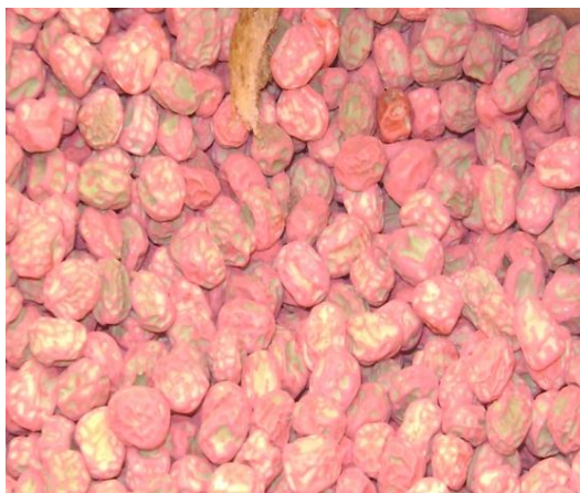
a) Variedad Quantum