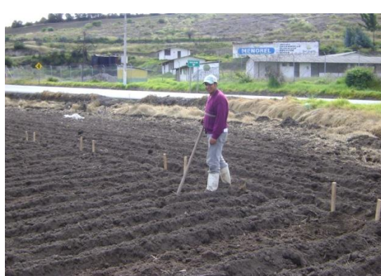
f) Preparación de las parcelas