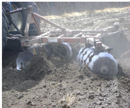
d) Incorporación del fertilizante y cal