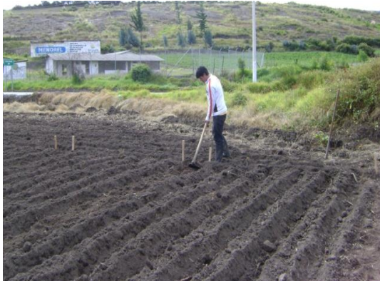
e) Preparación de las parcelas