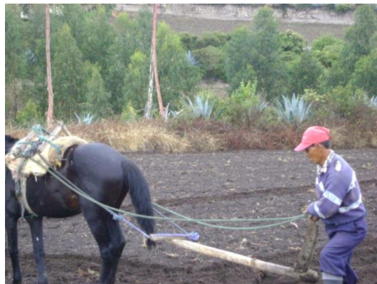
b) Surcado del terreno