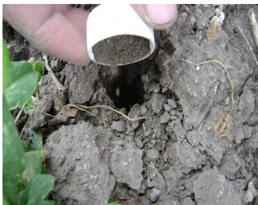
f) Aplicación de micorriza