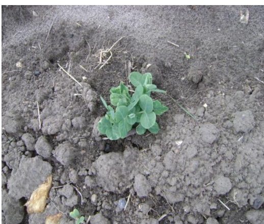
d) Germinación variedad Semi verde