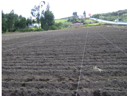
d) Colocación de piola