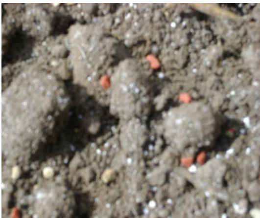
c) Aplicación del fertilizante