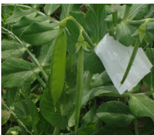
e) Fase de formación de vaina