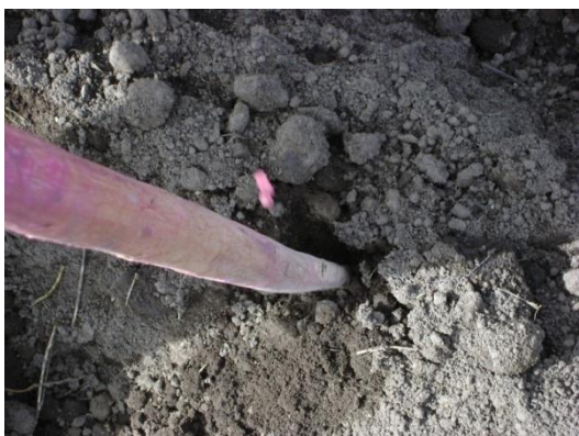
a) Fase de siembra