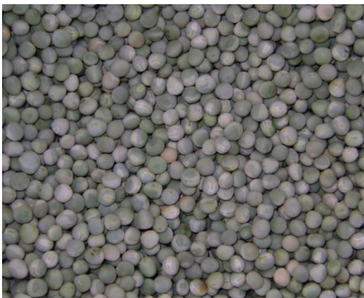
c) Variedad Semi verde