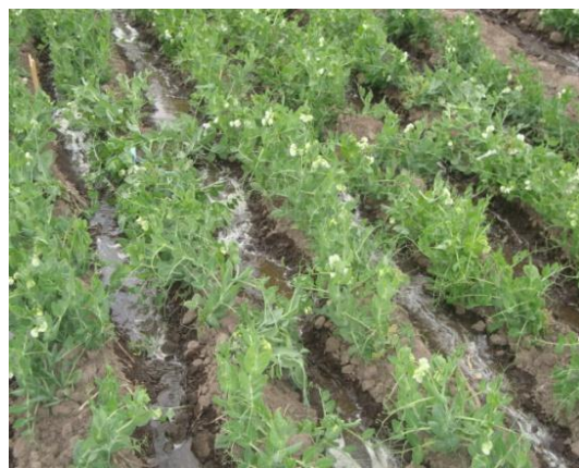
d) Riego en Fase de floración