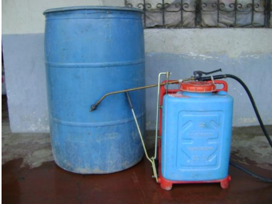
a) Bomba y tanque de Fumigar