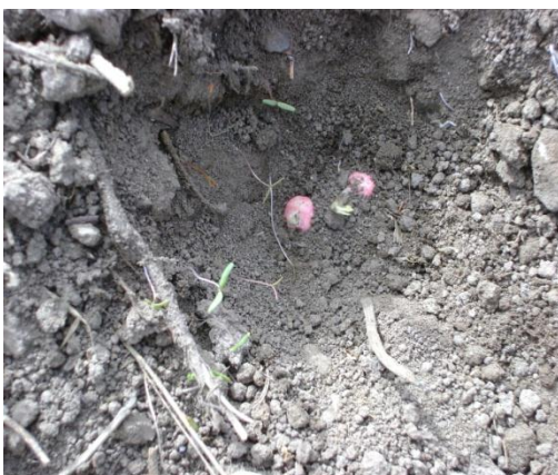
d) Germinación variedad Quantum