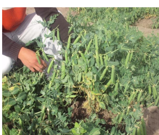
f) Fase de cosecha