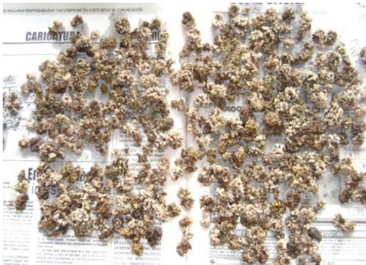
a) Cepa de rizhobium