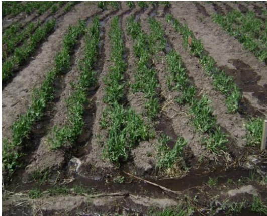
c) Riego en Fase de desarrollo