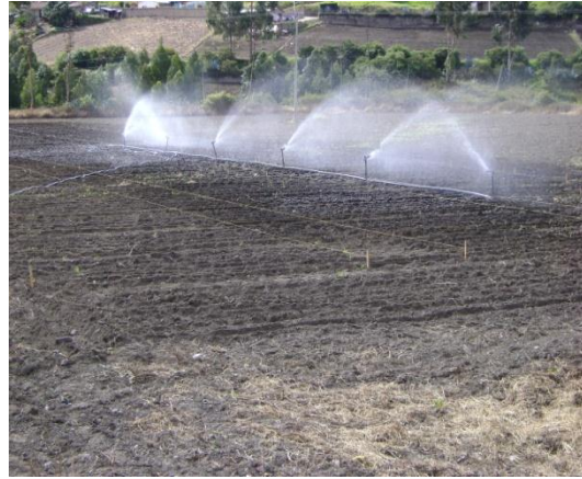
b) Riego por aspersión