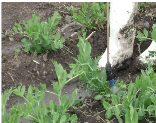
b) Aplicación de control químico