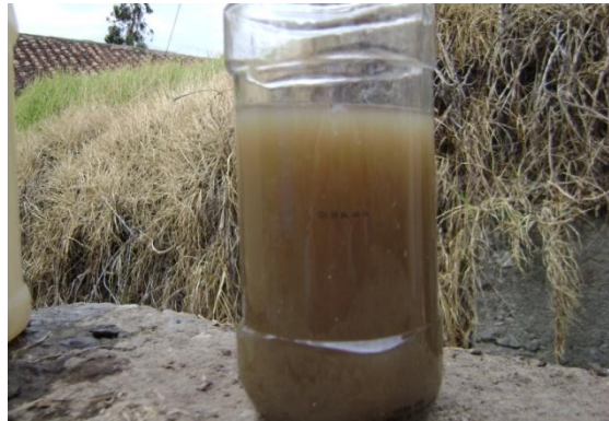
b) Rhizobium para la inoculación