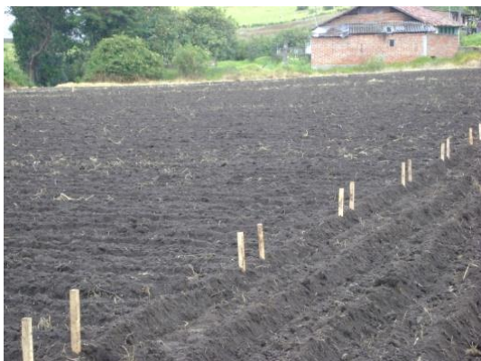
c) Ubicación de estacas