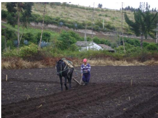
a) Surcado del terreno