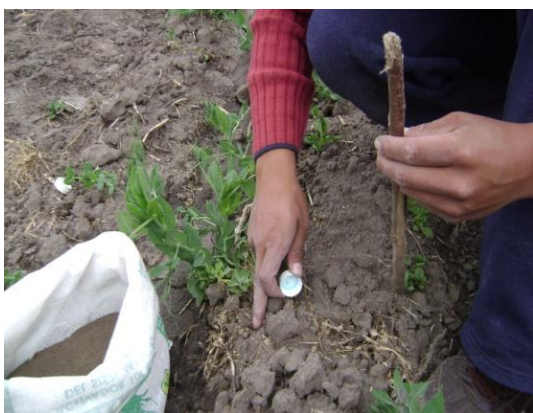
e) Aplicación de micorrizas