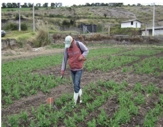
c) Aplicación de silicio