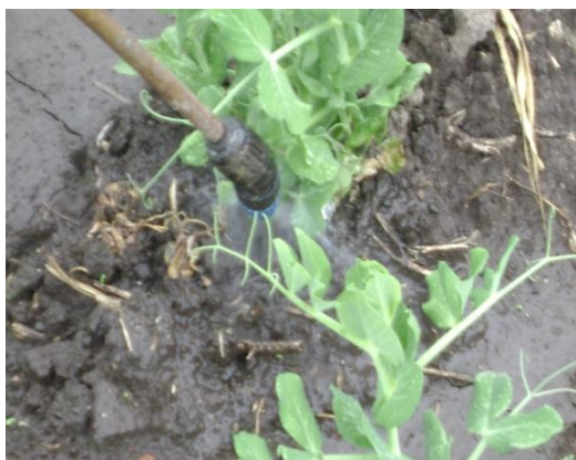
d) Aplicación de silicio