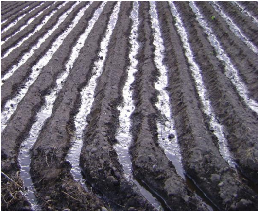
a) Riego inicial por gravedad