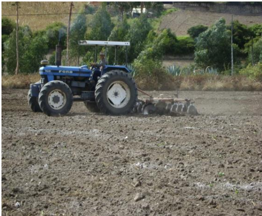
a) Preparación del terreno con rastra