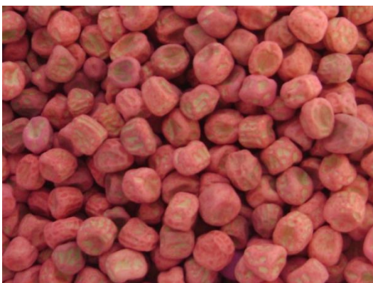
b) Variedad Asthom