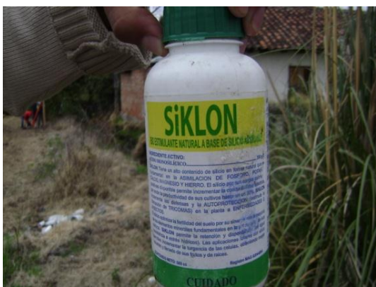
e) Fuente de silicio