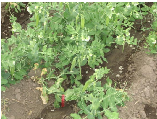
e) Riego en la fase de envainamiento