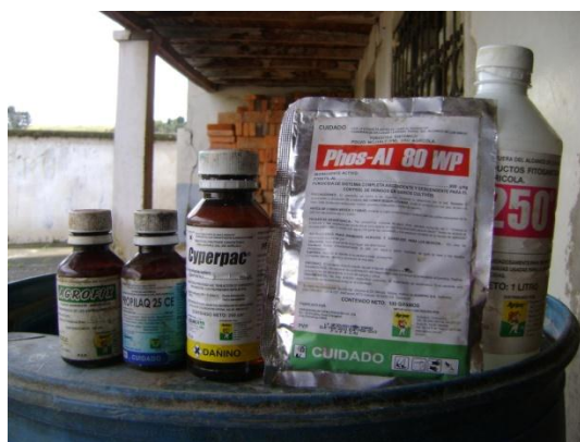
f) Productos del control químico