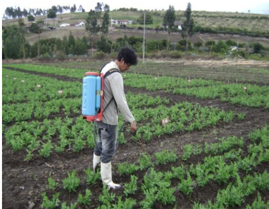
a) Aplicación de control químico