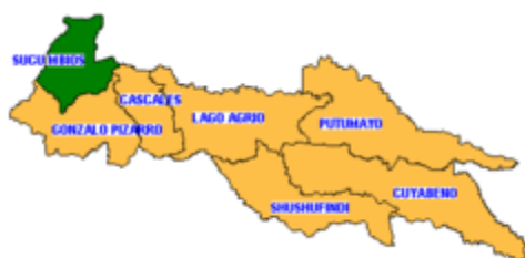
Gráfico 1: Cantón Lago Agrio

El Centro de Salud Abdón Calderón se encuentra ubicado en el Barrio Abdón Calderón, zona urbana del cantón Lago Agrio, en las calles Miguel Iturralde y Tungurahua, posee un clima tropical con máximas precipitaciones en verano y temperaturas cálidas a lo largo de todo el año. Dicho clima posibilita una vegetación de selva ecuatorial, característica de la Amazonía sobre todo en las comunidades alejadas de influencia de este centro de salud. La temperatura promedio es de 25 °C, posee una humedad relativa alta situada entre el 77% al 85%, (11).