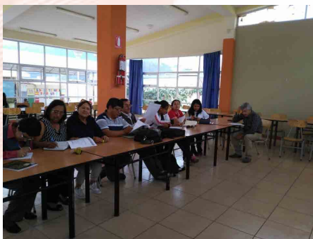
Docentes durante la capacitación

comportamiento, bajo rendimiento escolar, vulnerabilidad incluso puede llegar hasta el suicidio.