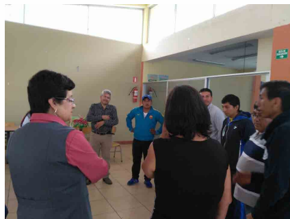
Docentes de JK participando de la dinámica

nombrar la película que nombro al inicio y así hasta terminar con todo el grupo. Por ejemplo el resultado sería “mi amiga, de la cintura para arriba es María y de la cintura para abajo es la cruda verdad”