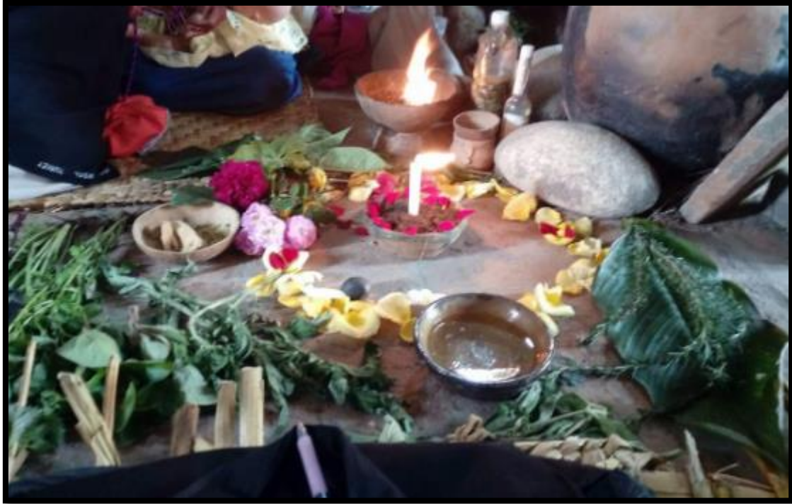
Imagen 3. Ritual presenciado