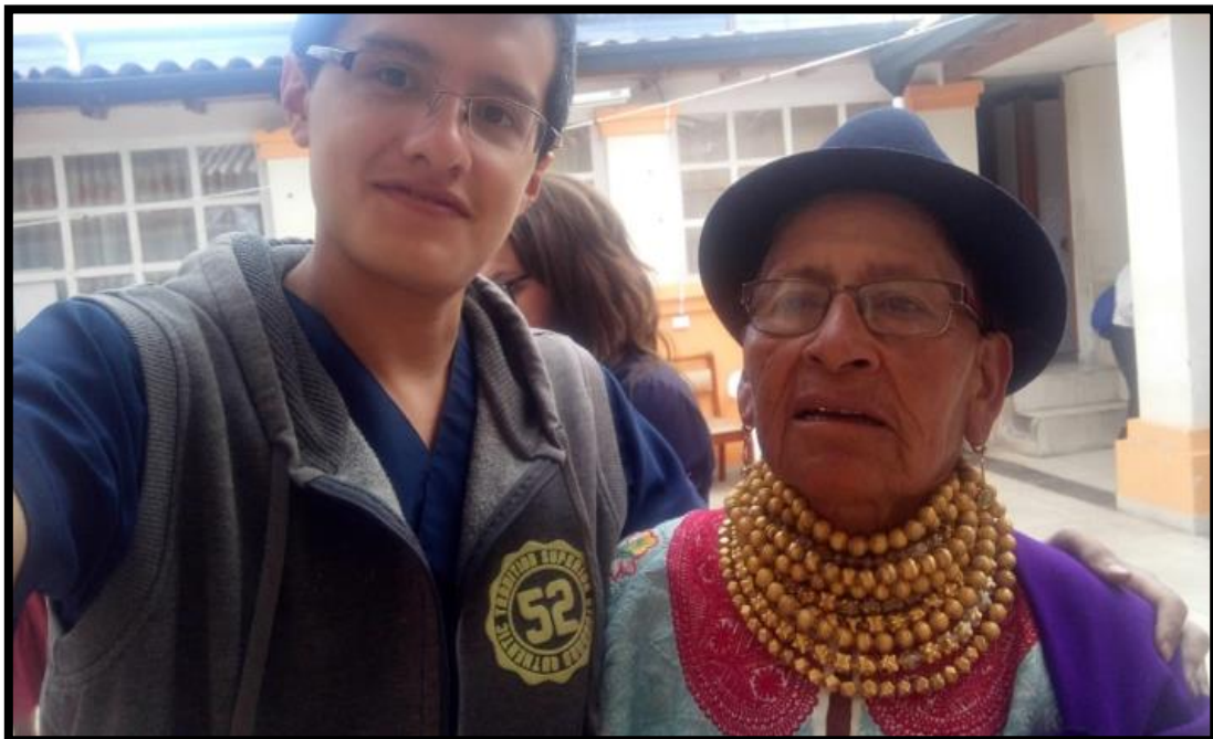
Imagen 2. Aplicación del instrumento