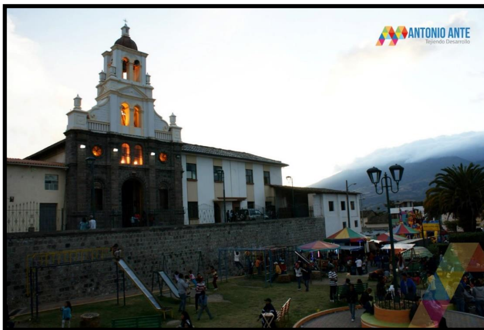
Imagen 1. Parroquia San Roque (11)