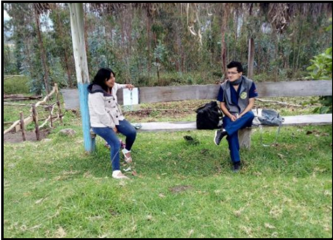
Imagen 1.- Aplicación del instrumento