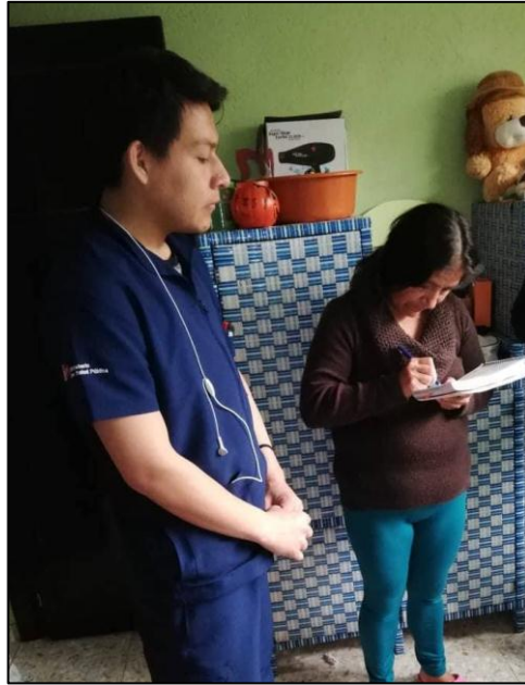
Encuesta a pobladores de Urbina