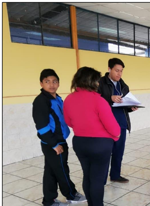
Encuesta a pobladores de Urbina