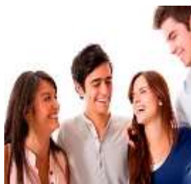
Figura 3: Control de emociones

Talleres para potenciar las habilidades sociales cognitivas