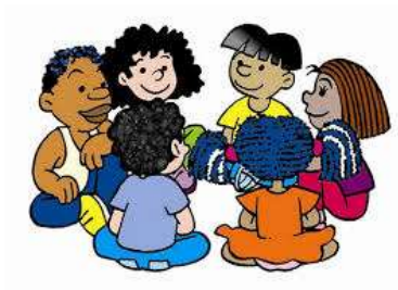
Figura 1: Niños interactuando