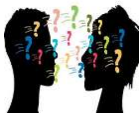
Figura 2: Habilidad cognitiva

Talleres para potenciar las habilidades sociales interpersonales