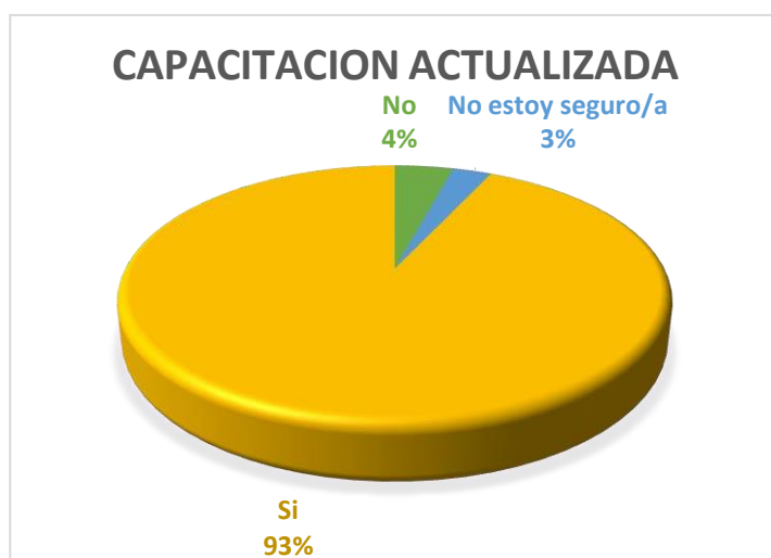
Figura 4. Porcentaje de capacitación continua y actualizada