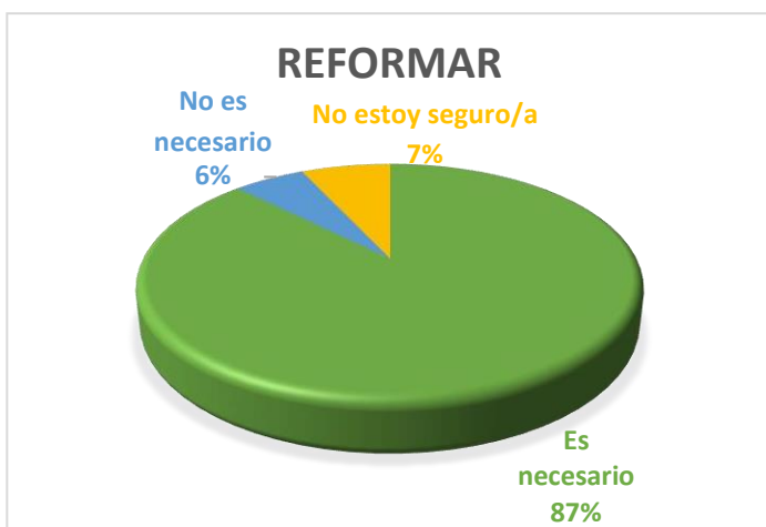
Figura 8. Porcentaje sobre las respuestas a reformar

Fuente: Resultados de la encuesta realizada a la población otavaleña. Elaboración: Cristian Muenala, 2023.