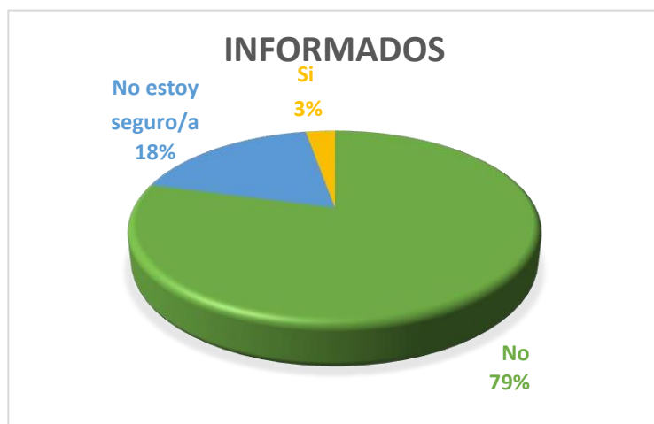
Figura 10. Porcentaje de nivel de información de la ciudadanía

Fuente: Resultados de la encuesta realizada a la población otavaleña. Elaboración: Cristian Muenala, 2023.