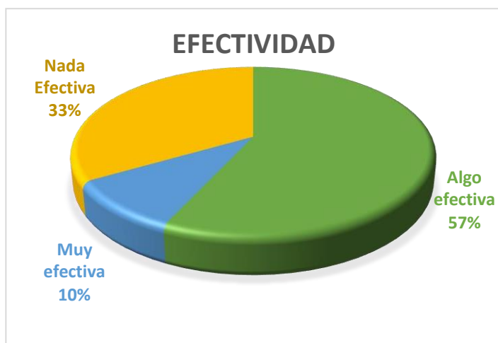
Figura 1. Porcentaje de efectividad