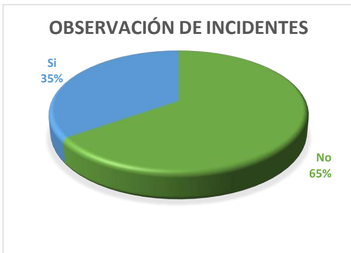
Figura 6. Porcentaje de observación