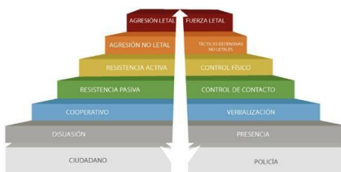
Figura 1. Imagen de la pirámide de uso de la fuerza

Nota: la imagen indica como son los diferentes niveles que la Policía debe utilizar cuando enfrente a la delincuencia.