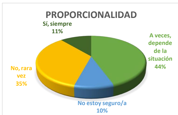
Figura 5. Porcentaje de proporcionalidad del uso legítimo de la fuerza