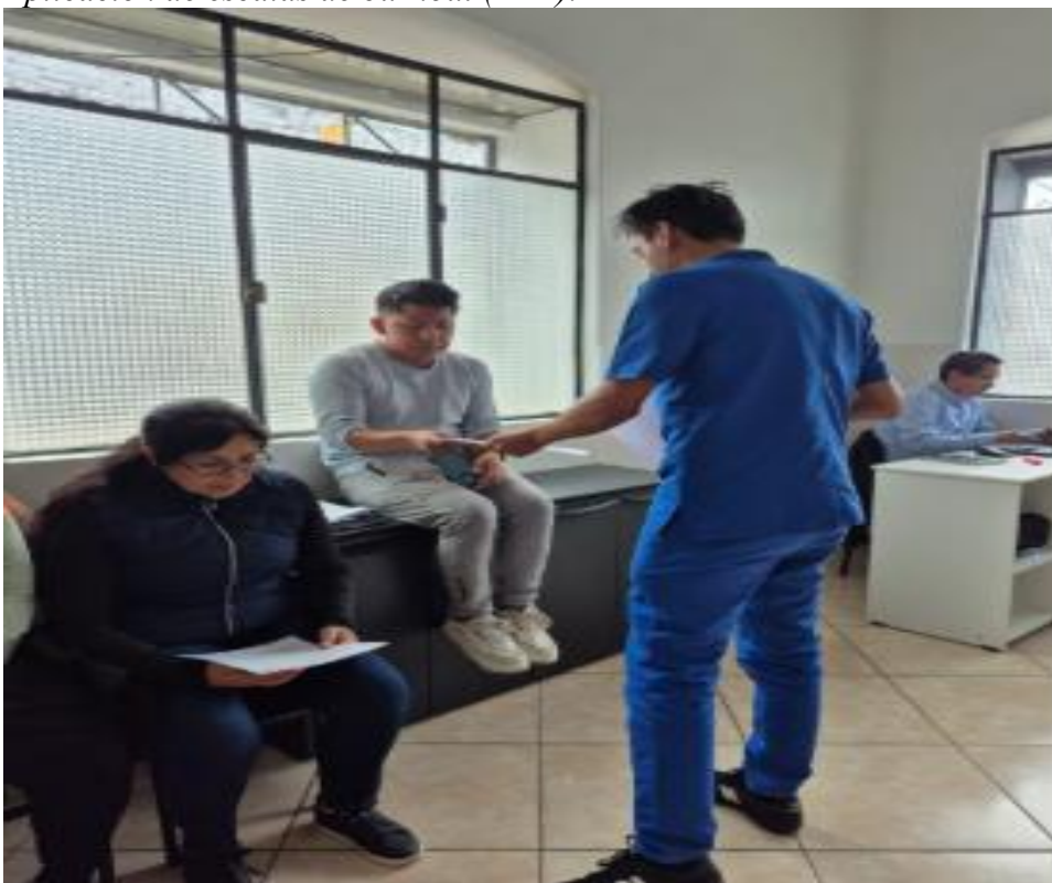
Figura 5. Aplicación de escalas de burnout (MBI).

Fuente: (Bryan Xavier Julio Andrade, 2025)