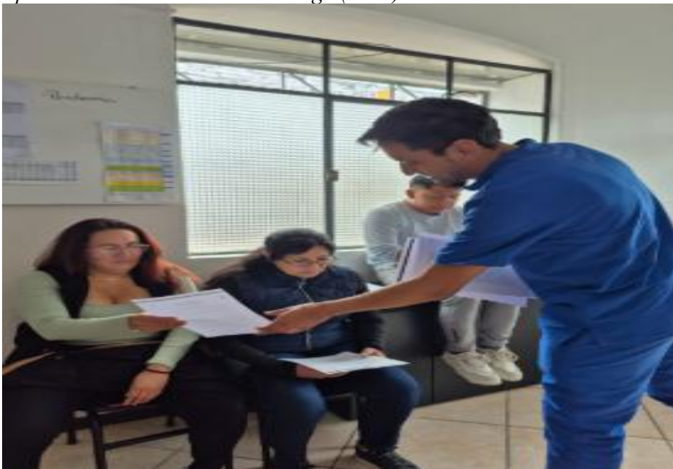
Figura 4. Aplicación de escalas de sobrecarga (Zarit)