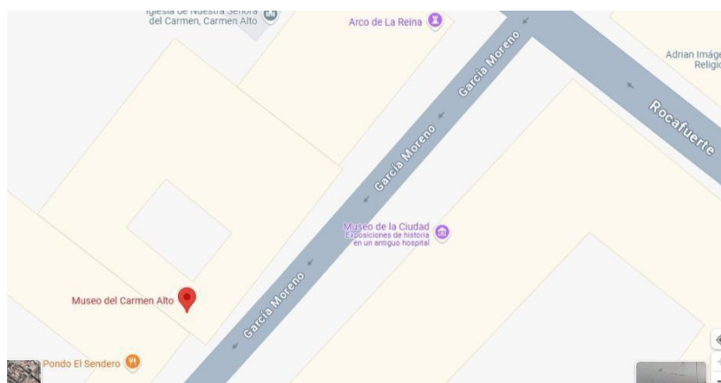
Mapa Museo Del Carmen Alto

Nota: Límites del Museo del Carmen Alto[Mapa], por Google Maps, 2025, Maps ( https://maps.app.goo.gl/9uN9sxySex1tj75Z9 ).