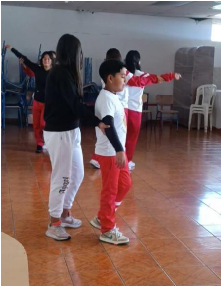
Ilustración 6: Taller de Expresión Corporal