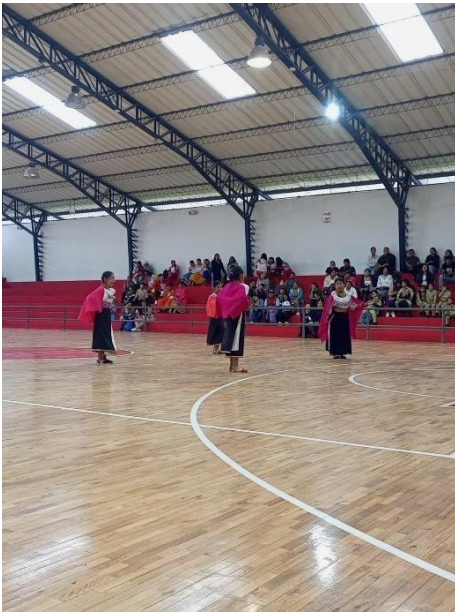
Ilustración 7: Presentación de coreografías