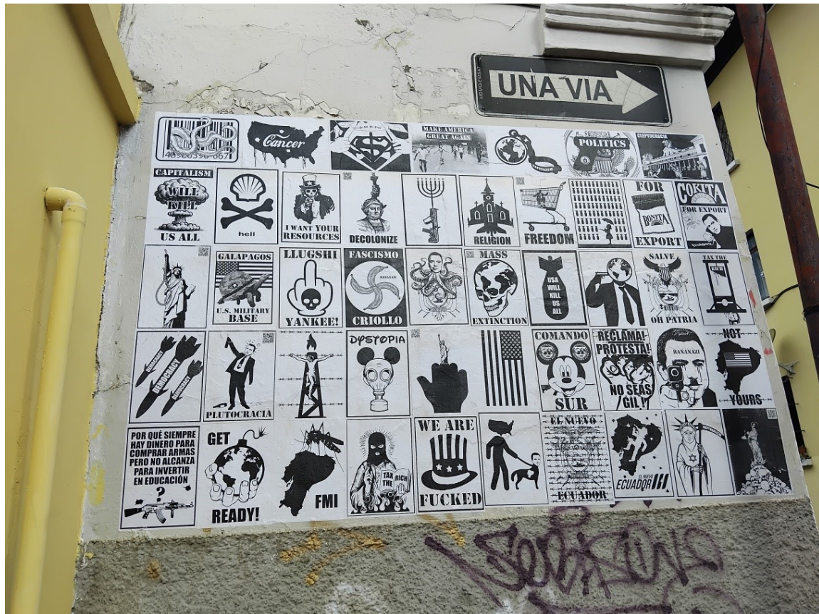
Imagen 12: Instalación de paste up en el marco de la exposición “Crónicas del Hastío”