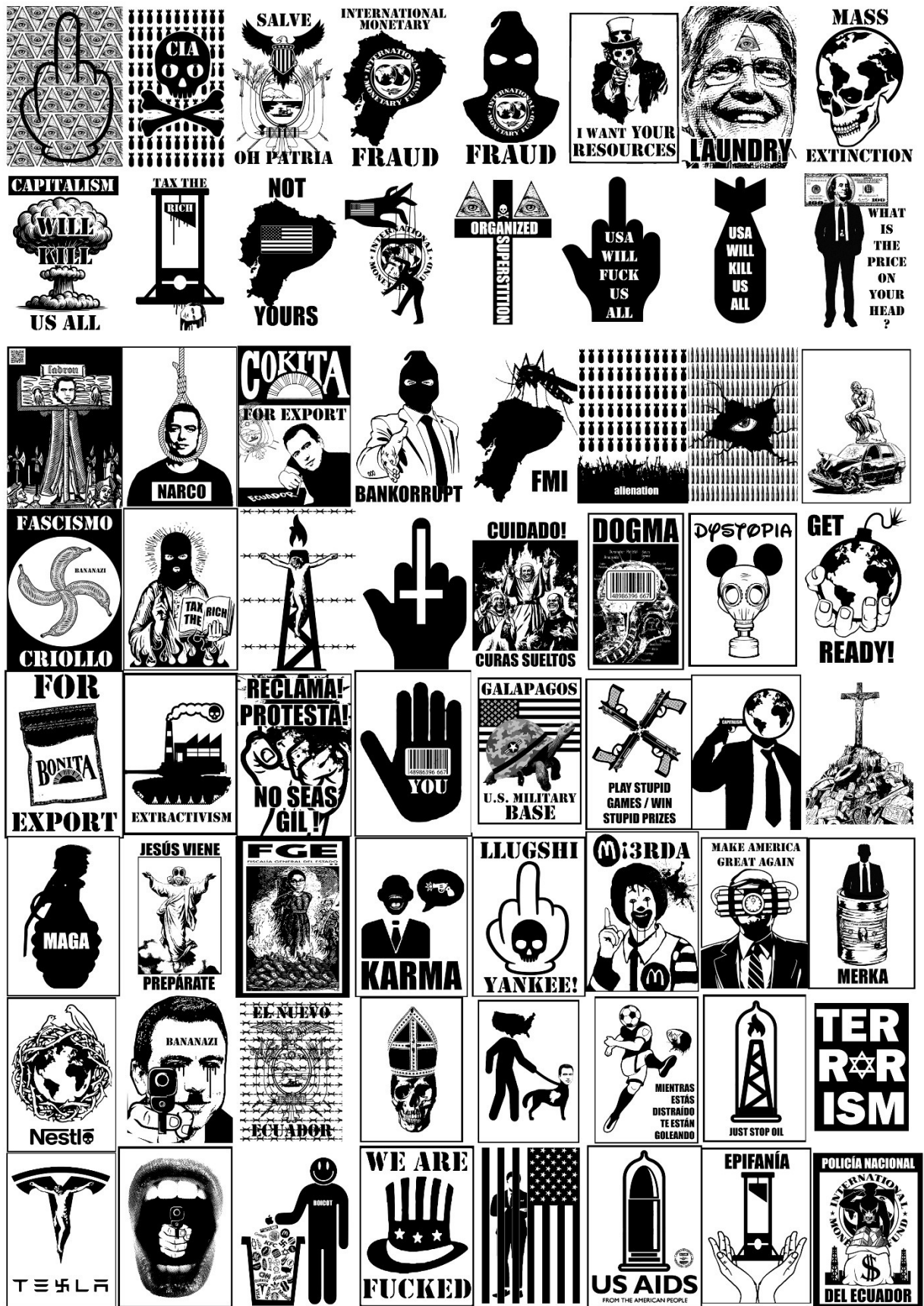
Imagen 6: Catálogo de imágenes de collage digital