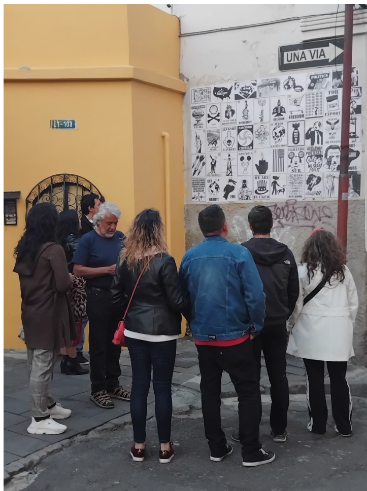
Imagen 9: Registro de la obra montada en el marco de la exposición “Crónicas del Hastío”