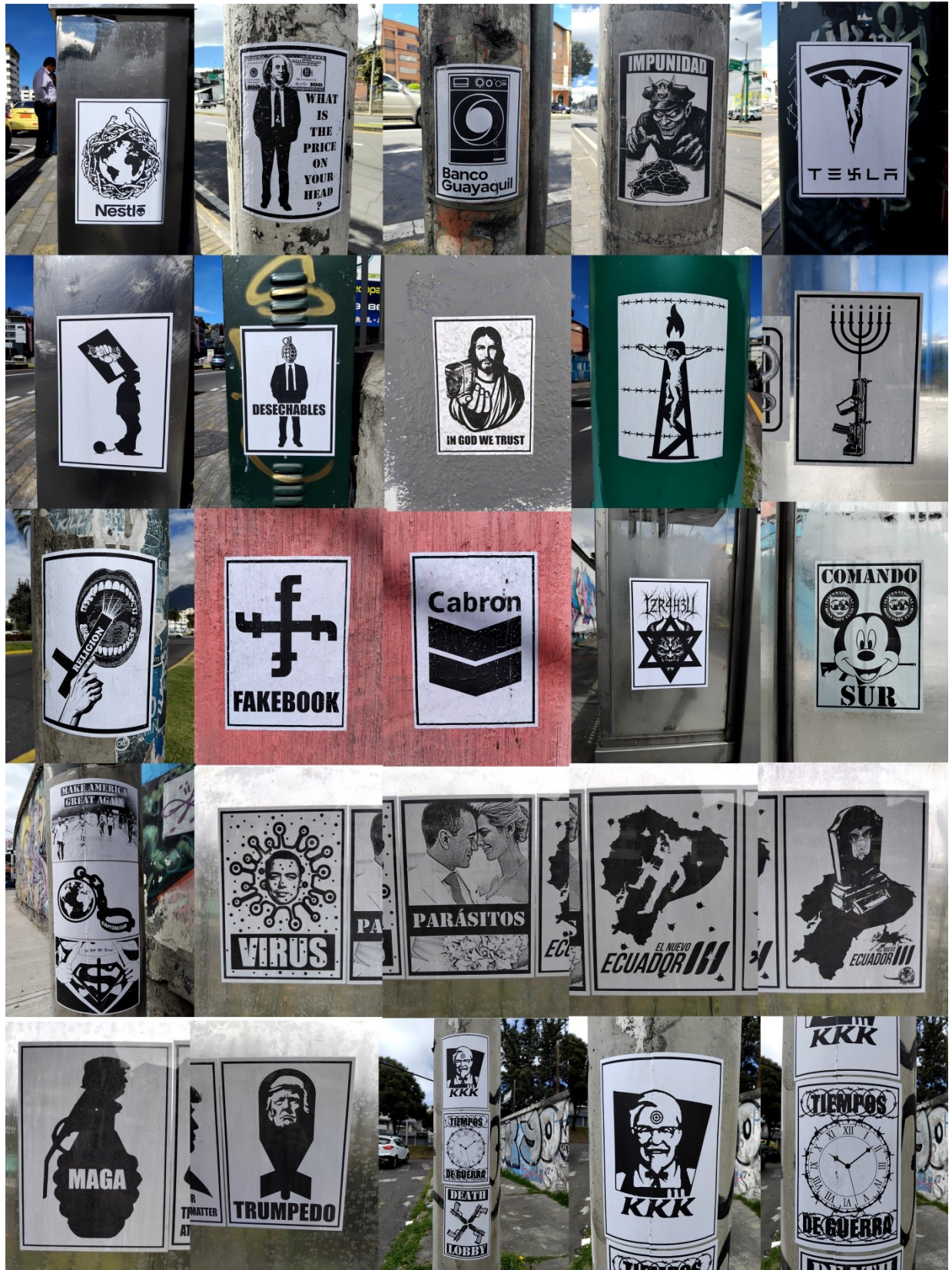
Imagen 16: Registro fotográfico 4 de pastes en diferentes espacios de la ciudad