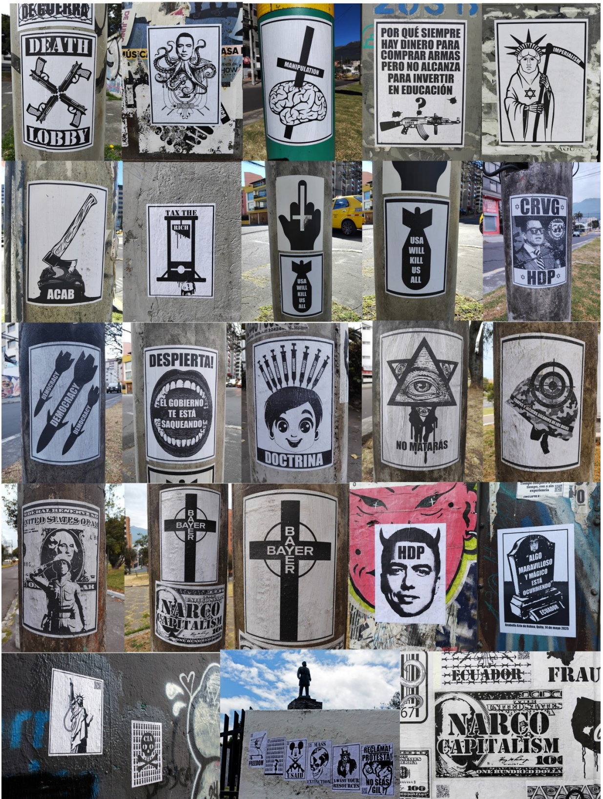
Imagen 17: Registro fotográfico 4 de pastes en diferentes espacios de la ciudad