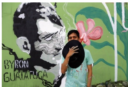
Imagen 5: Mural para Byron Guatatuca. Apxel. Tomado del IG del autor