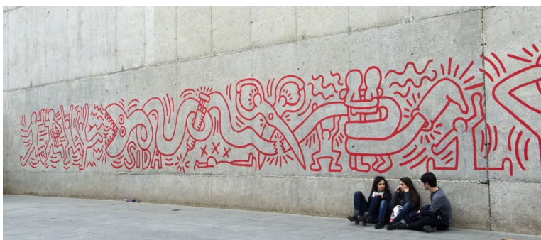
Imagen 3: Mural del SIDA. Keith Haring.