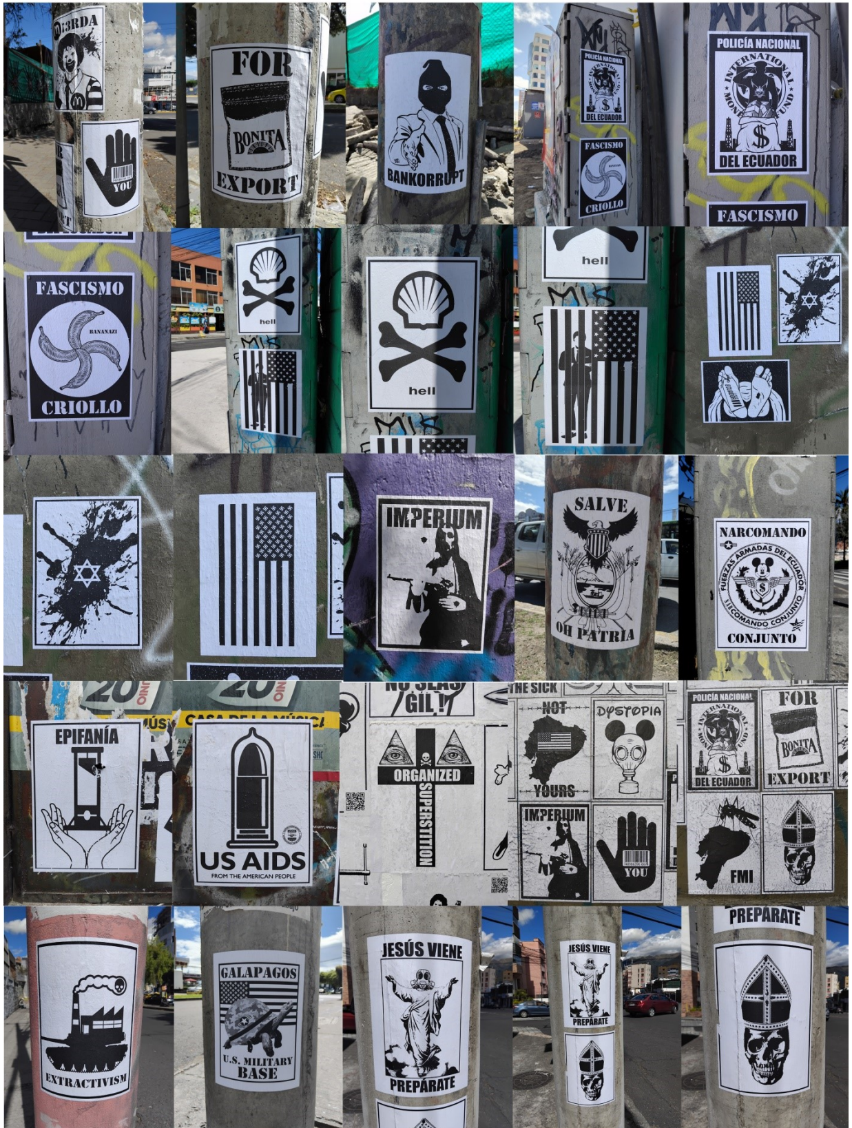
Imagen 15: Registro fotográfico 3 de pastes en diferentes espacios de la ciudad