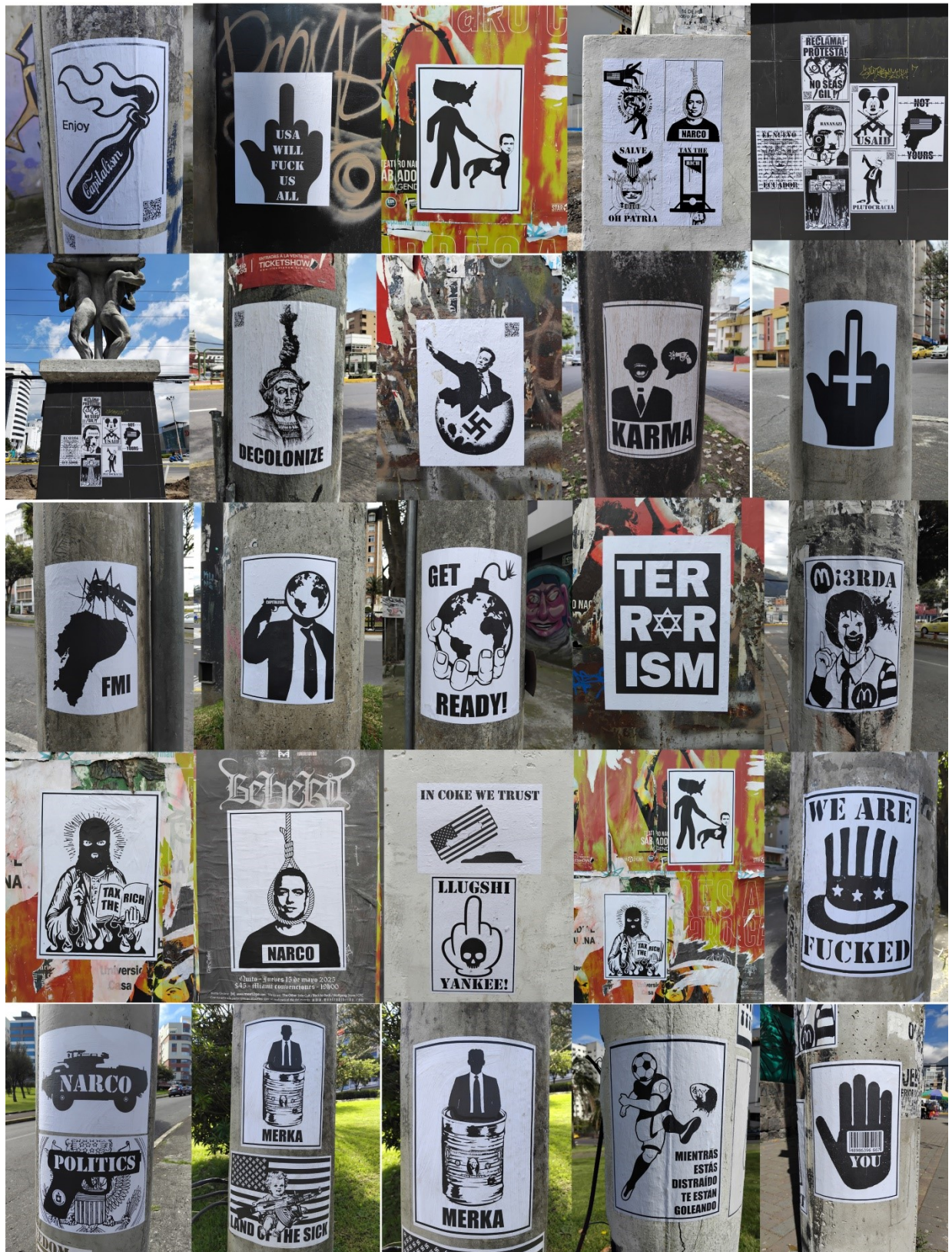
Imagen 14: Registro fotográfico 2 de pastes en diferentes espacios de la ciudad