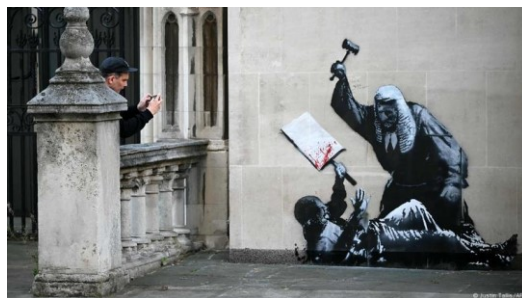
Imagen 1: Royal court of justice. Banksy.

En la contemporaneidad han sido muchos los artistas que me han inspirado y motivado a salir de los límites del cubo blanco. A nivel global y por señalar algunos relevantes de la cultura pop puedo nombrar a: Banksy, Blek le Rat, Keith Haring. A nivel nacional: Alex Ron, Apxel, poetas y artistas, hombres y mujeres con propuestas de carácter político y social, entre muchísimos otros. Estos autores constituyen referentes para mí porque su línea gráfica es abiertamente política, cada uno en su contexto histórico y situado en su realidad específica. Asimismo, reivindico sus contenidos explícitos e interpelantes, a través de imágenes, frases o símbolos fácilmente reconocibles. Constituyen, además, artistas que trabajan en el espacio público como espacio primordial de divulgación de su obra. La suma de estos aspectos ha orientado de manera fundamental mi propuesta artística.