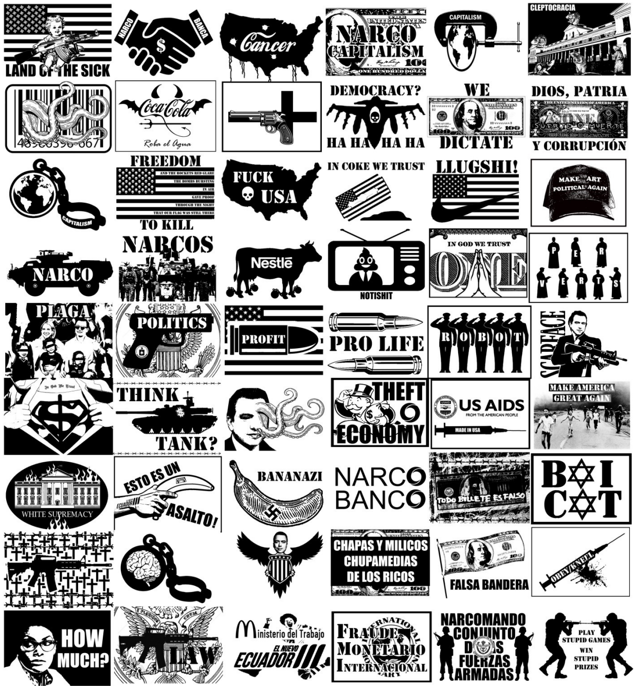
Imagen 8: Catálogo de imágenes de collage digital