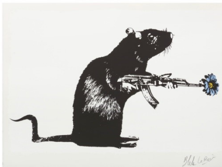
Imagen 2: The Warrior. Blek le Rat.