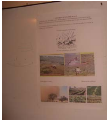
Foto 3.7. Capacitación a las comunidades

El proceso para elaborar el diagnóstico socio ambiental participativo con las cuatro comunidades no fue fácil debido a que los socios beneficiarios del proyecto tenían sus obligaciones tanto en cada una de sus casas como en sus trabajos diarios (Fotos 3.7-3.8 y 3.9).