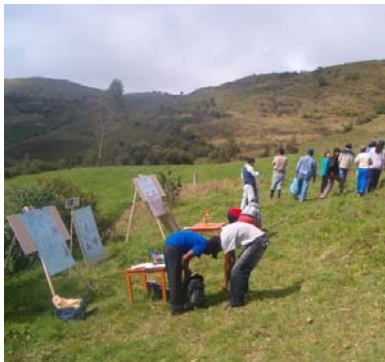
Foto 3.8. Capacitación a las comunidades