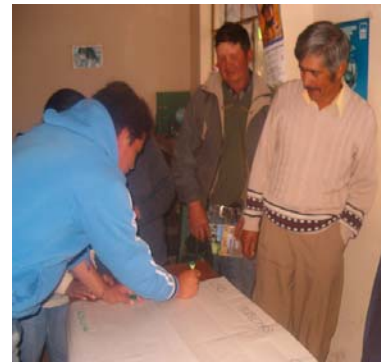
Foto 3.9. Capacitación a las comunidades

El trabajo se lo realizó con todos socios y socios participando todo el tiempo en charlas de educación ambiental y trabajos de campo realizados en cada uno de los recursos naturales expuestos (Ver Mapa 9).