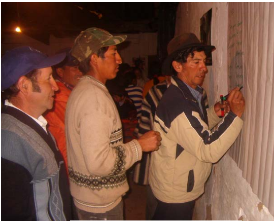
Foto 3.5 Talleres del diagnóstico, Palo Blanco 2006

En la realización del Diagnóstico Participativo se identificó las fortalezas, oportunidades, debilidades y amenazas de los participantes de cada una de las comunidades. (Foto 3.5 y 3.6)