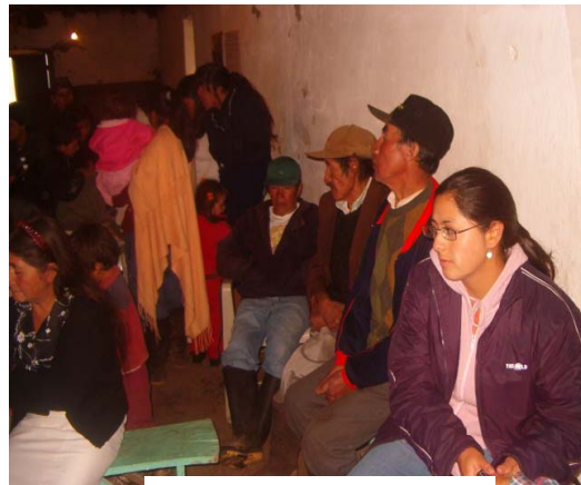
Foto 3.6 Talleres del diagnóstico, San Isidro 2006

Para establecer líneas de conservación de los recursos naturales renovables, a través de la educación ambiental, se realizó el FODA en las fechas del 18 de abril al 15 de junio del 2006 en las cuatro comunidades de una forma rotativa.