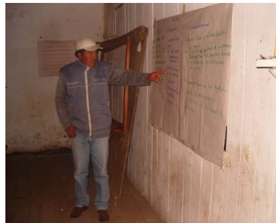
Foto 3.11 Capacitación a las comunidades La libertad2006