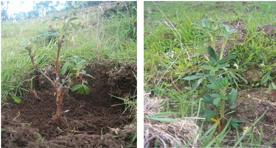
Foto 3.14. Árboles de polylepis en la comunidad de Palo Blanco 2006

La siembra de los árboles se realizó en los meses de Julio y Agosto del 2006 en la comunidad de Palo Blanco tomando en cuenta el riesgo que cada una de las especies forestales tenía debido a que fueron sembradas en época de sequía y no existían las condiciones adecuadas para su desarrollo y crecimiento, pero gracias a la ayuda y al interés de cada uno de los socios por realizar la reforestación se logro que la mayoría de especies sembradas crezcan y se mantengan en buenas condiciones.