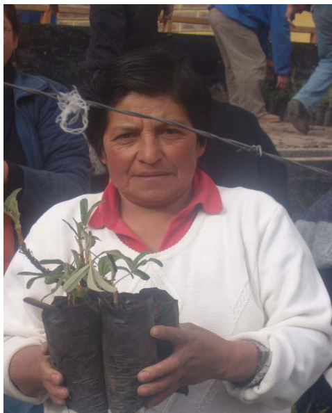
Foto3.12 En la reforestación 2006

El 20 y 21 de julio se procedió a la entrega de las plantas teniendo en cuenta que cada socio beneficiario del proyecto en la comunidad de Palo Blanco tuvo acceso a 125 plantas de Polylepis ( Polylepis sp ) y 125 plantas de Aliso ( Alnus acumuminata )