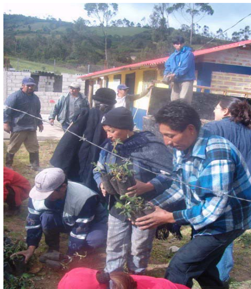
Foto 3.13 En la reforestación2006

Luego de la entrega de las plantas (Foto3.12) se realizó una demostración práctica en la que se consideró importante indicar la distancia de siembra y la utilidad de cada