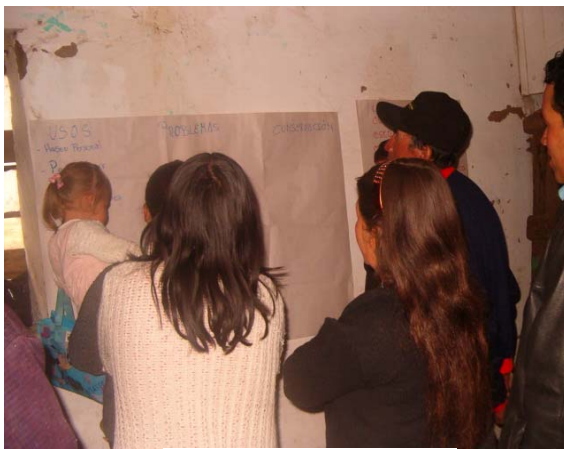
Foto 3.10 Capacitación a las comunidades El Hato2006

Luego de cada una de las exposiciones las que fueron realizadas por los tesisistas se procedió a conformar grupos de trabajo dependiendo del grupo de asistentes a los cuales se les entregaba material didáctico que consistía en un cartel y marcadores que servía para realizar su trabajo grupal en donde los socios ayudaban con ideas y criterios, para tener mejor resultado en su exposición donde se enmarcaban tres puntos específicos los cuales eran el uso , el problema , la conservación de los recurso naturales expuestos en cada uno de los talleres de esta manera se obtuvo información real y concreta mantenido el interés de las familias beneficiarios del proyecto(Foto 3.10 y 3.11).